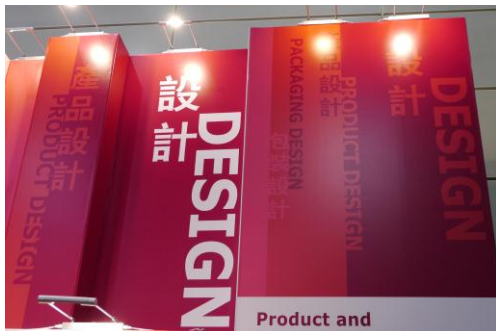
香港禮品展 設計主場