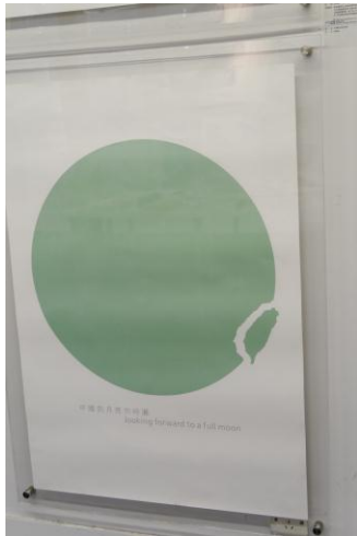
深圳大學學生設計作品