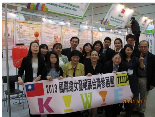
圖 2.5 台灣代表團