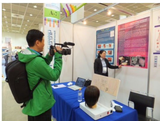
圖 2.6 媒體採訪