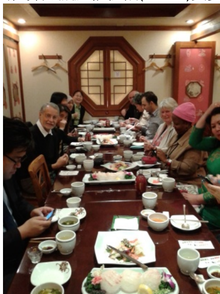
圖 2.3 各國領隊晚宴

本日並協助發明協會蘇理事長代表台灣團參加各國領隊晚宴，與主辦單位、聯合國世界知識產權組織(WIPO)貴賓、各國領隊代表進行交流。