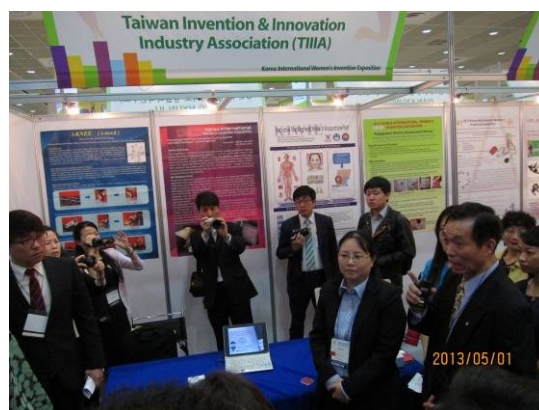
圖 2.4 貴賓參觀