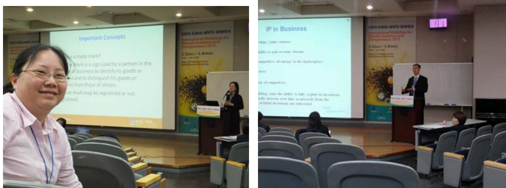
圖 2.10 參與研討會照片 (左：新加坡學者講授商標；右：WIPO 代表講授專利)