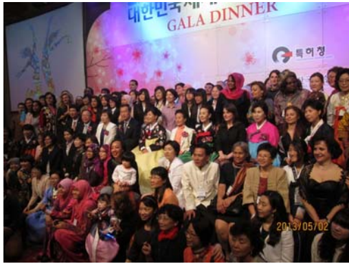
圖 2.8 晚宴大合照