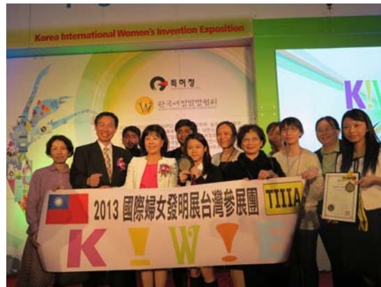
圖 2.9 (左)獲獎照片 (右)台灣參展團與大會主席合照