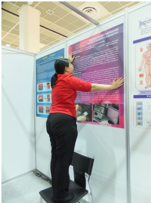
圖 2.1 桃園機場出發