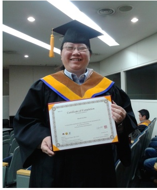
圖 2.11 獲得證書