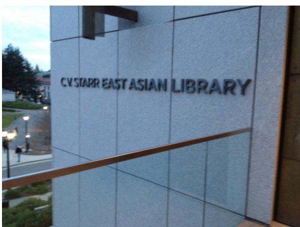
加州柏克萊大學東亞圖書館