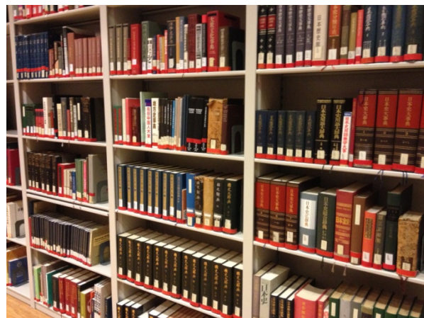
加州柏克萊大學東亞圖書館