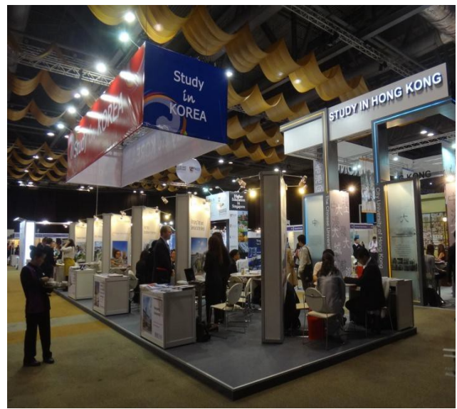
圖 6 韓國展示攤位