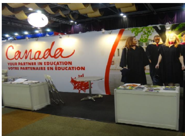
圖 9 加拿大展示攤位