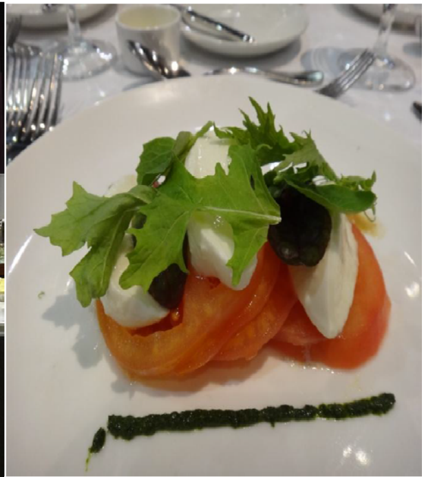
圖 17 開幕晚宴餐食之一