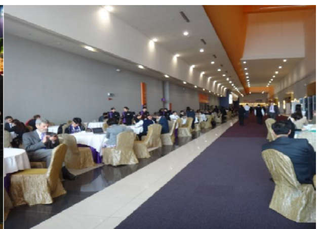
圖 10 會場外交流場所