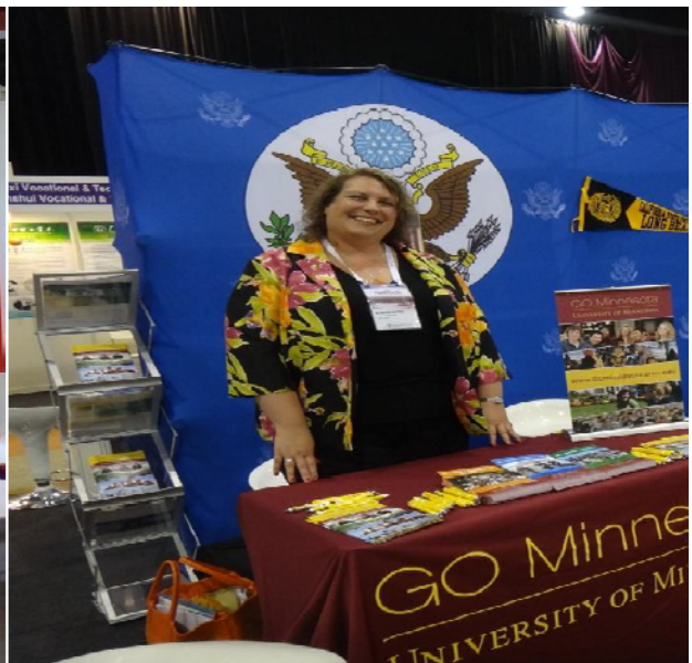
圖 8 美國明尼蘇達大學展示攤位