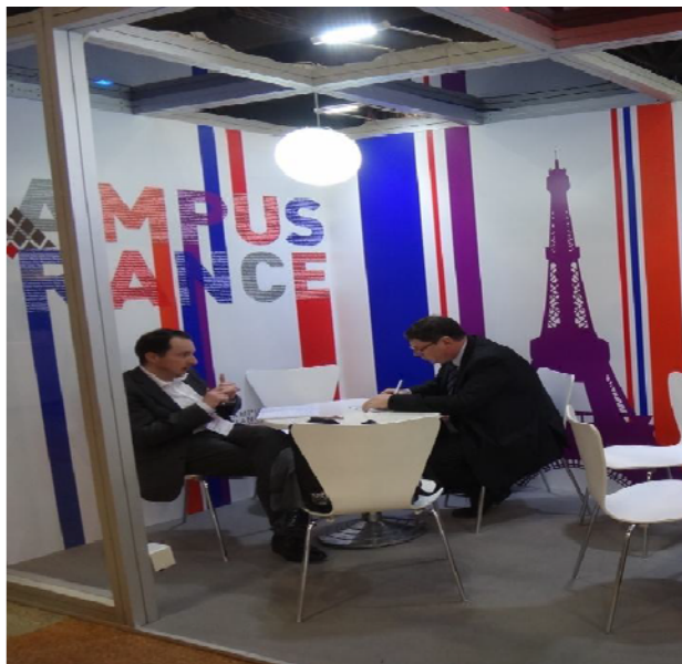
圖 7 法國展示攤位