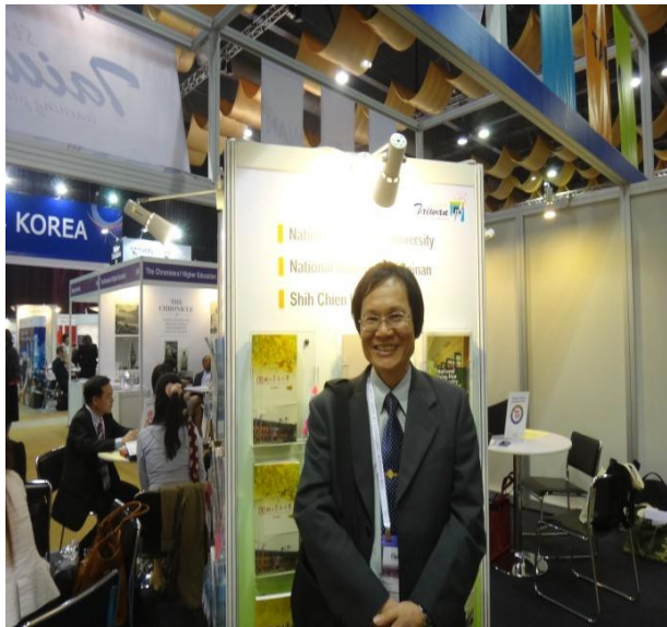
圖 5 國立臺南大學展示位置