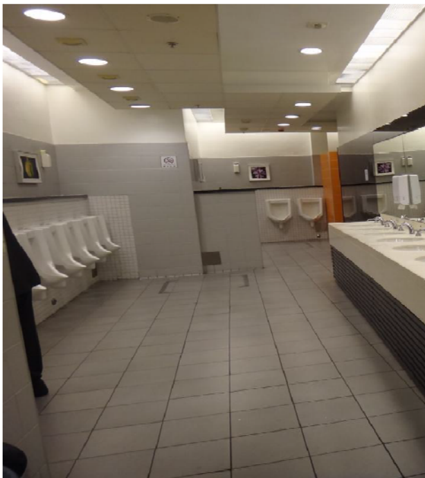
圖 18 寬敞明亮的洗手間