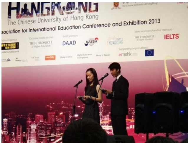
圖 20 大會兩位香港大學的學生主持人