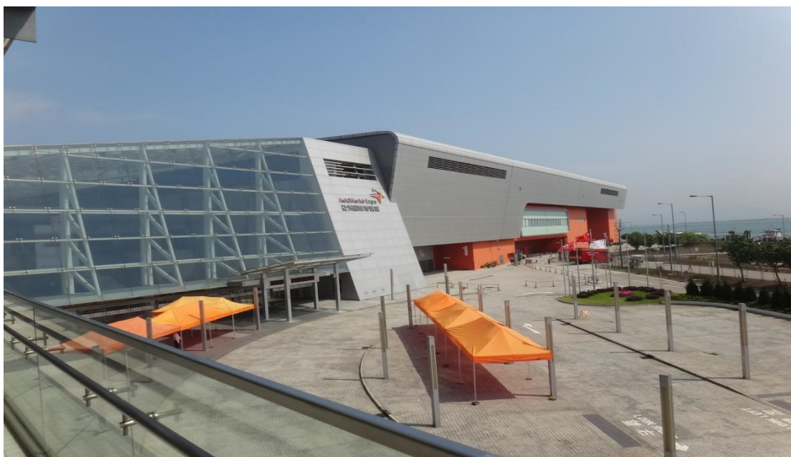
圖 1 2013 APAIE 舉辦地點 亞太國際展覽館

2013 年亞太教育者年會由香港主辦，承辦單位是香港中文大學，日期從 3 月 11 日到 3 月 15 日，地點選在靠近機場之亞洲國際博覽館，從機場乘坐機場快線只要一站就到達展覽館，對於來自各國的嘉賓可說相當方便。