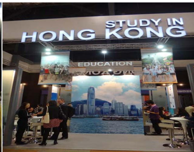
圖 23 香港展示攤位