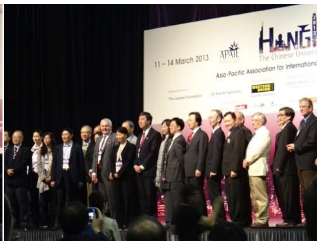
圖 21 大會開幕時貴賓介紹