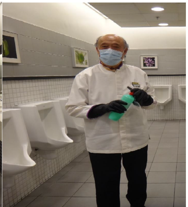
圖 19 負責盡職的伯伯