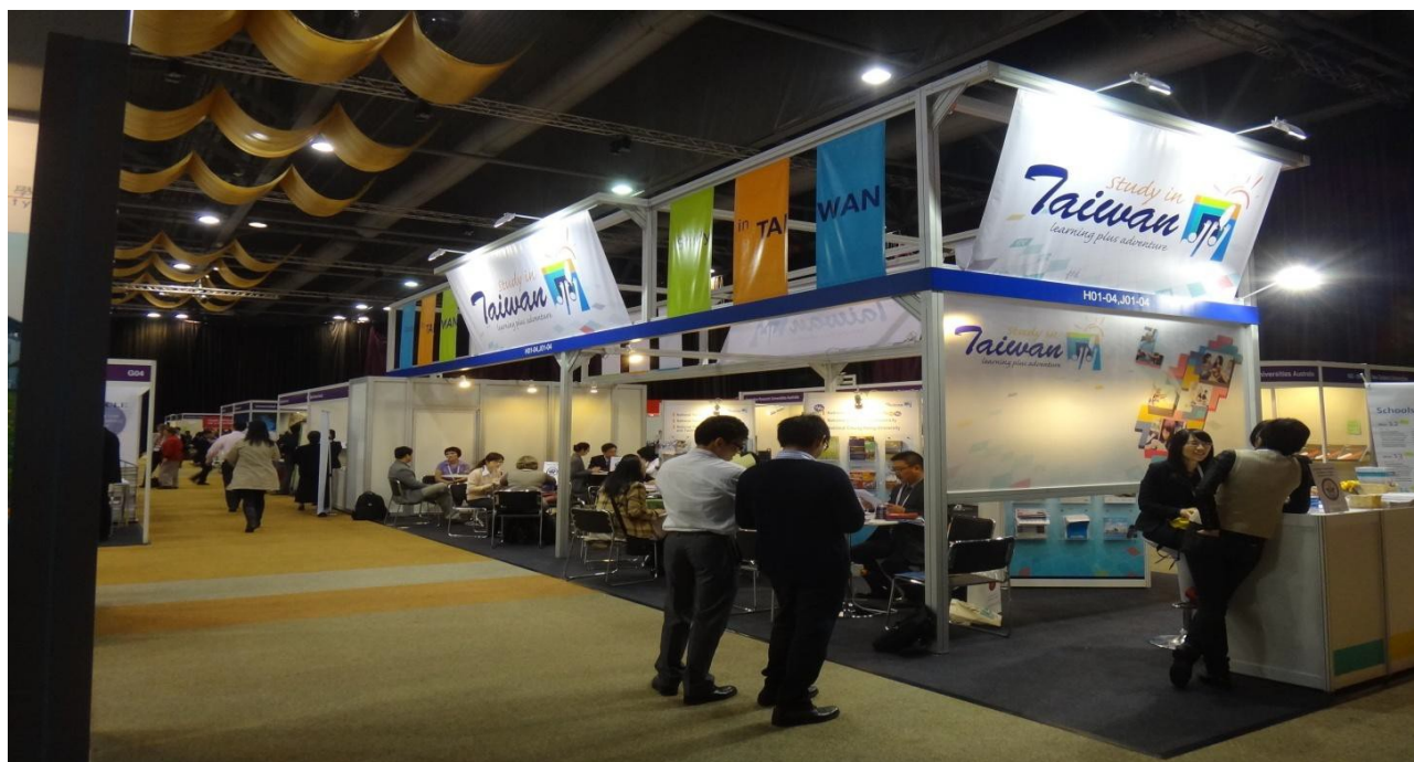
圖 4 我國各大學的共同展場

3月11日是佈展，我國由高等教育基金會統一布置，位置非常好，就在展場進門第一個攤位。各校有一壓克力裝置可以擺放展品，展示架後面可以置放各校自己的東西。另外留下大部分空間作為與我國各校與世界各校交談的座位。各校分別安排輪值時段，每一時段有六個學校的參展人同時在展場待命招待客人。整個臺灣展區看起來美觀、清爽、大方，其他各展場也都各盡本事，以吸引目光。