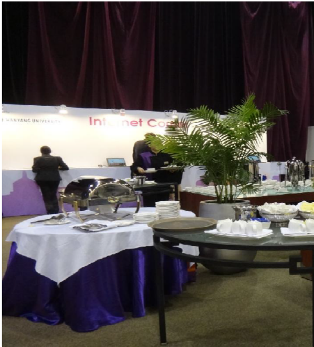
圖 16 茶敘會場一角

其他方面，大會所在的會場場地相當寬敞、明亮、整潔、有序，就連茶敘、午餐、晚宴也都精心設計，符合國際各方需要。最令我驚訝的是衛生間的服務，有一位伯伯非常盡責地清潔場地，洗完手還抽好拭手紙讓使用者擦手，服務做到這樣實在令人折服。