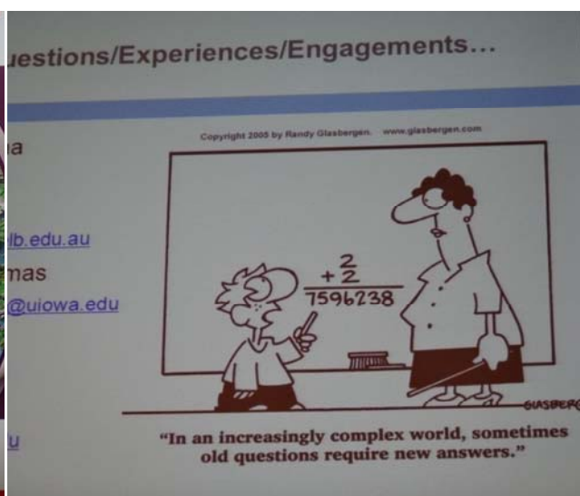
圖 25 專題講座一張有趣且值得深思的投影片