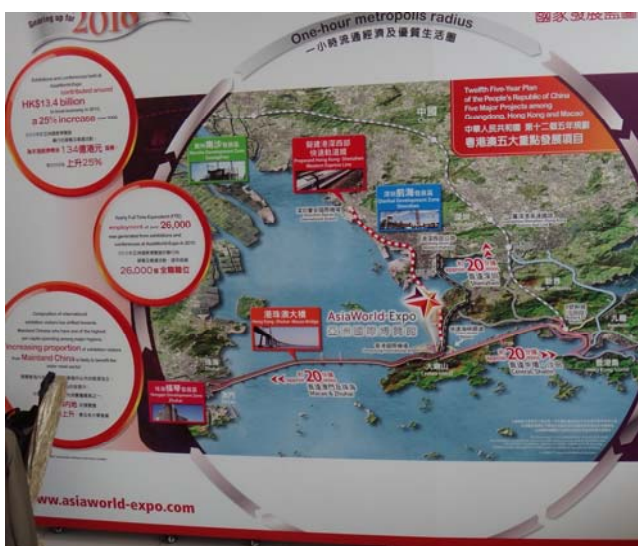
圖 24 香港未來開發圖