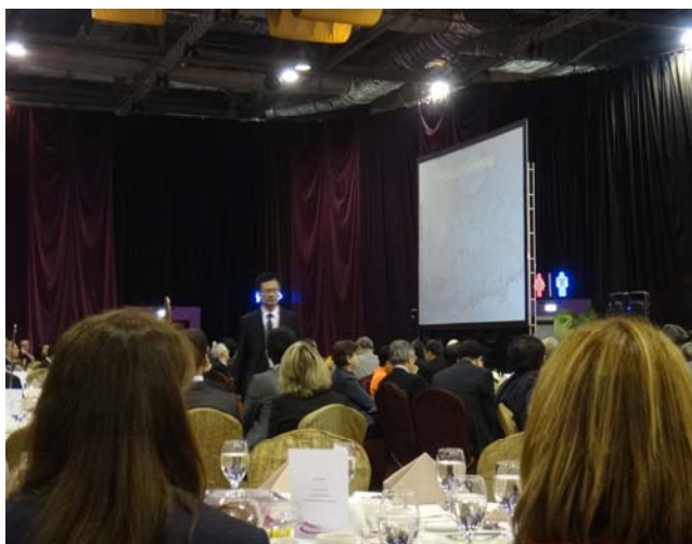
圖 22 大會主題專題演講