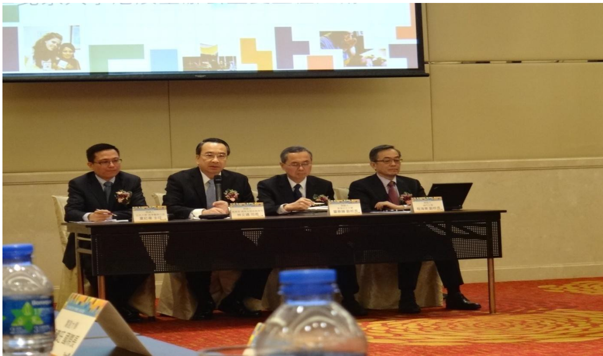
圖 2 兩岸四地會談四位引言人

實踐大學應用外語系講座教授陳超明曾在聯合報一篇「12 年國教給孩子國際移動力」的文章中提到，所謂國際移動力包括：具國際視野的專業能力、國際溝通力、跨文化思維和適應生活的能力(聯合報 2013 年 3 月 26 日)。