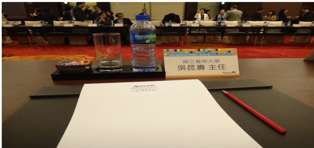
圖 3 兩岸四地會談座位布置

3月11日是佈展，我國由高等教育基金會統一布置，位置非常好，就在展場進門第一個攤位。各校有一壓克力裝置可以擺放展品，展示架後面可以置放各校自己的東西。另外留下大部分空間作為與我國各校與世界各校交談的座位。各校分別安排輪值時段，每一時段有六個學校的參展人同時在展場待命招待客人。整個臺灣展區看起來美觀、清爽、大方，其他各展場也都各盡本事，以吸引目光。