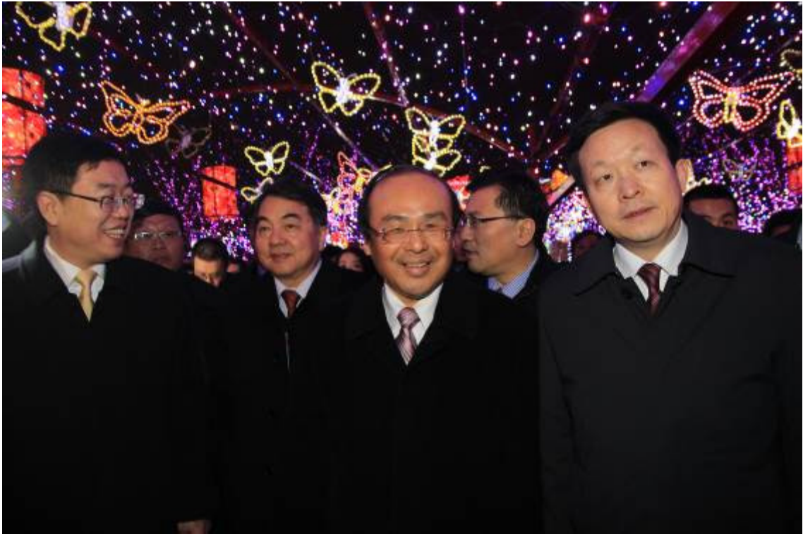
陳次長與陸方貴賓視察臺灣燈區