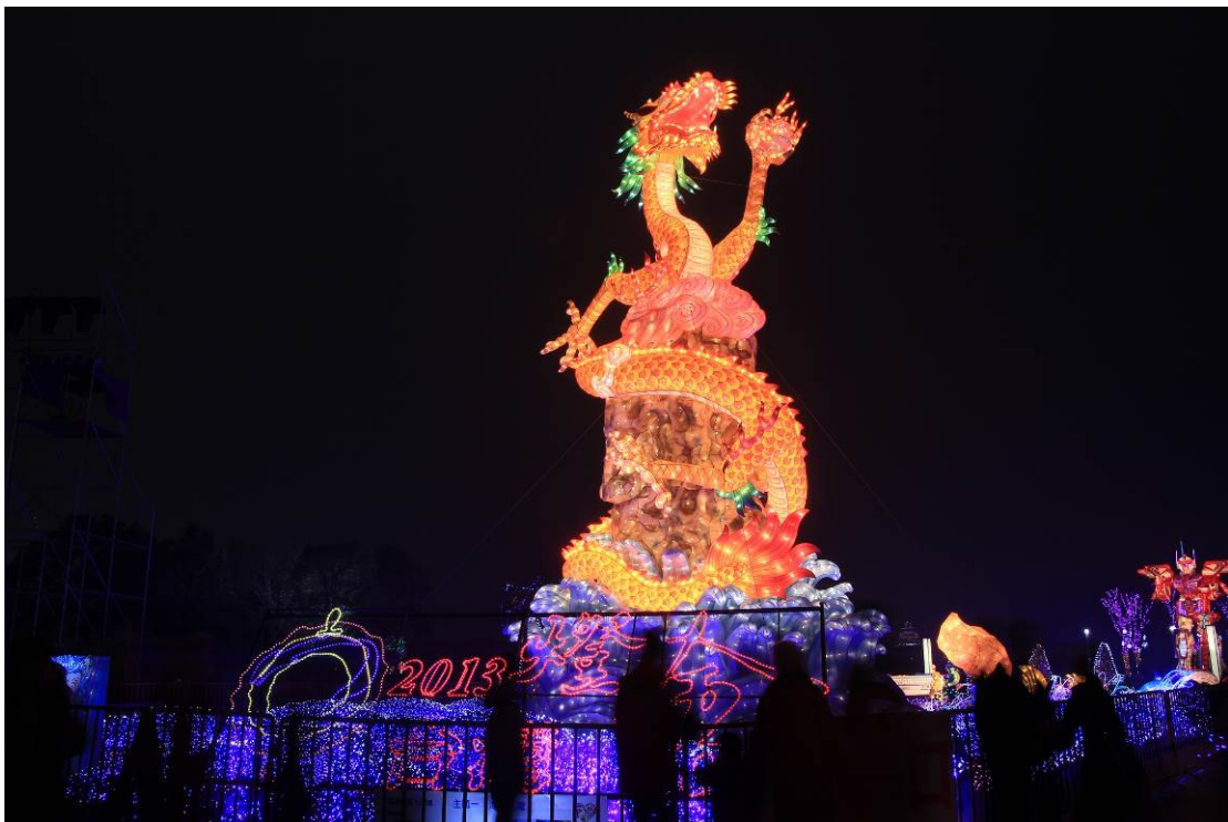
主燈「金龍獻瑞」(夜晚)