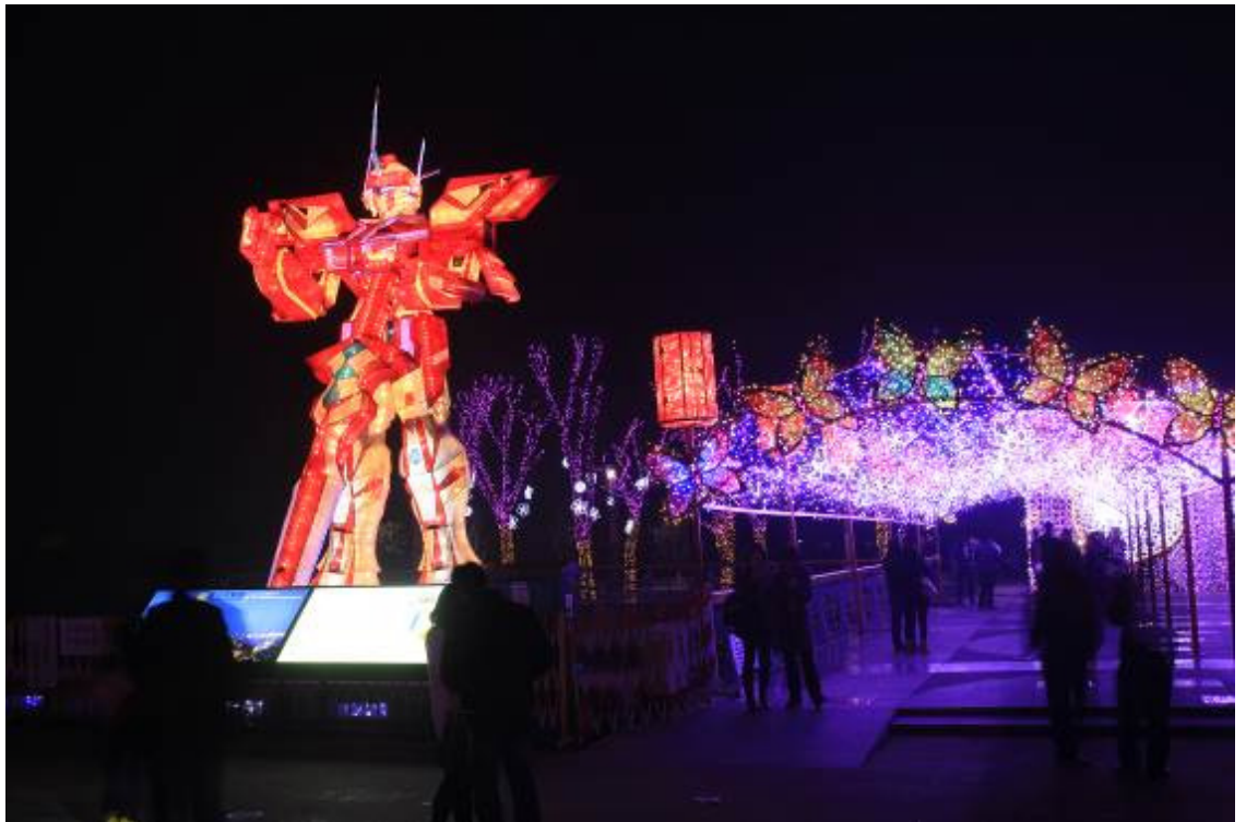
光環境－變形金剛花燈及彩蝶隧道