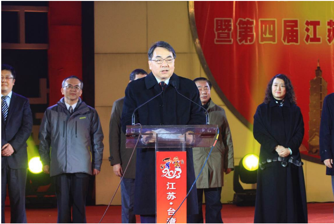
2013 臺灣江蘇燈會交流－開燈典禮由謝局長代表致詞