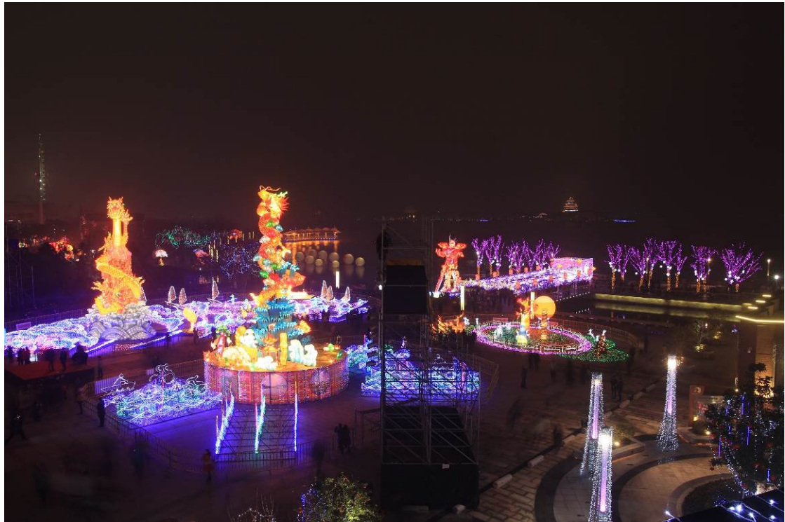
2013 臺灣江蘇燈會交流－臺灣燈區全景