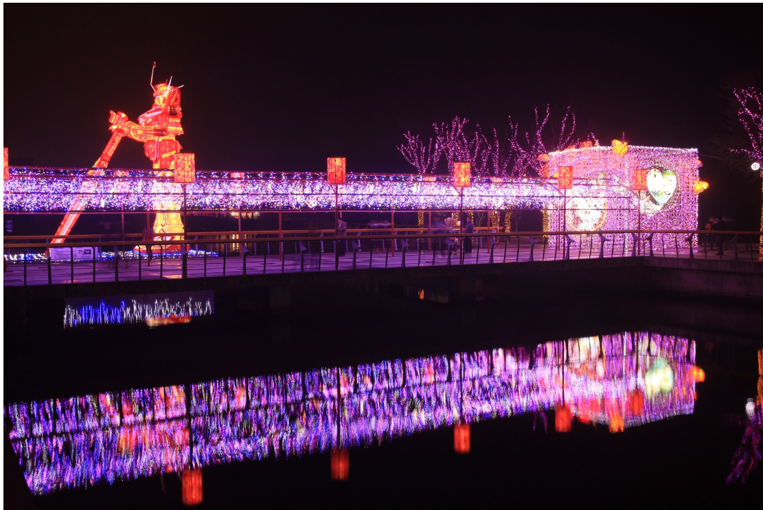
光環境－變形金剛、彩蝶隧道及好客區