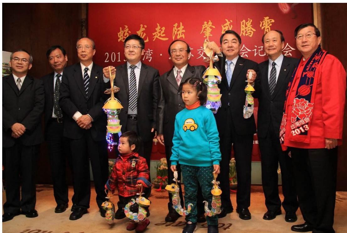
2013 臺灣江蘇燈會交流—記者會