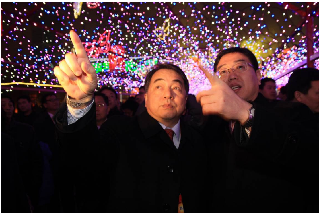
謝局長向海旅會杜江執行會長介紹及說明臺灣燈區特色