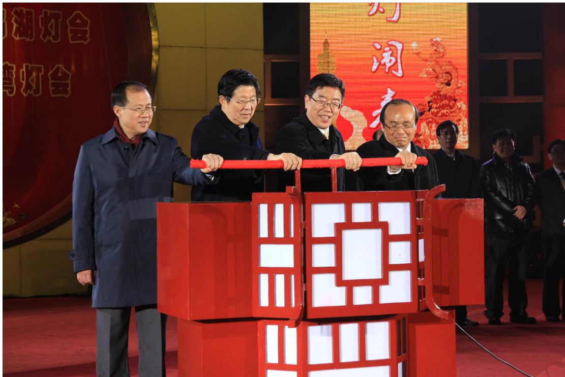
2013 臺灣江蘇燈會交流－開燈典禮啟動儀式由陳次長代表