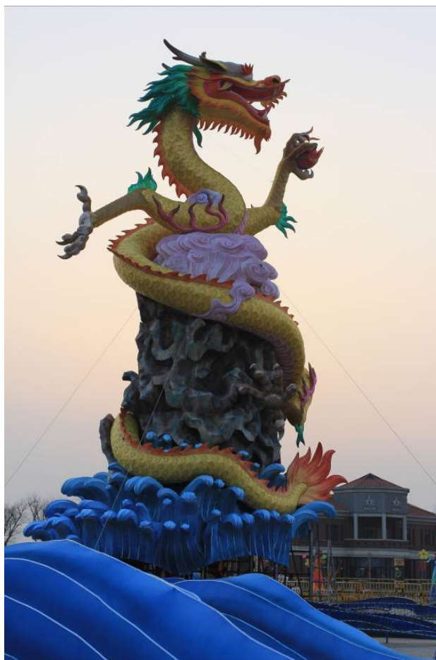
主燈「金龍獻瑞」(白天)