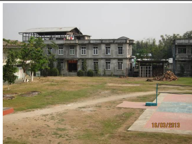
密支那育成學校校景