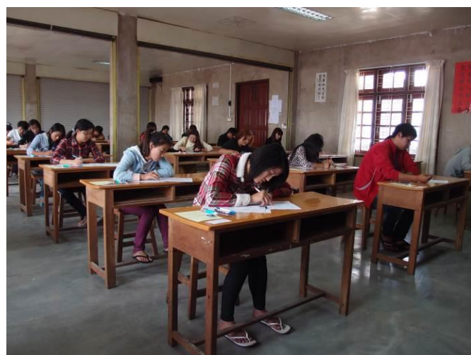
東枝興華學校考試情形