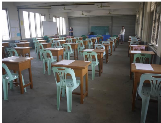
曼德勒考區開考前，布置題卷的情形