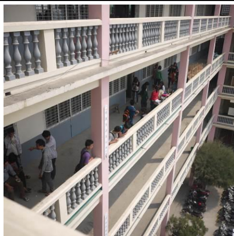
曼德勒東區孔教學校校舍大樓