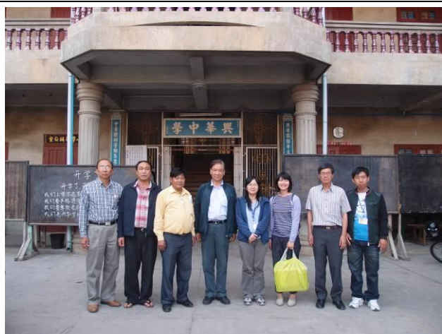
試務人員與東枝興學校校長、董事們合影