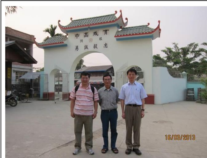
試務人員與育成學校校長合影留念