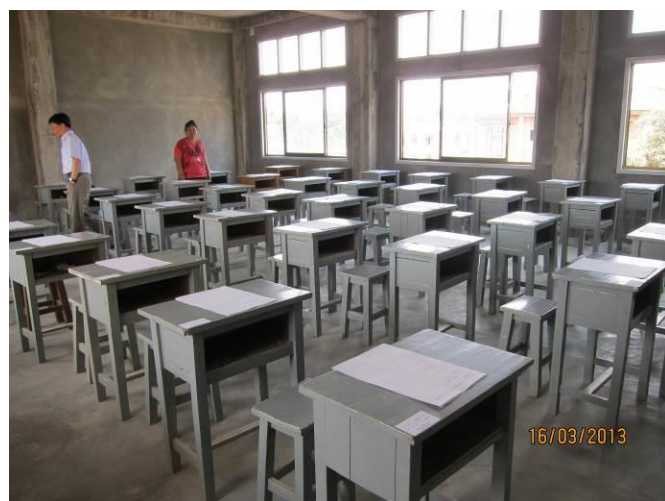
密支那育成學校試務工作安排情形