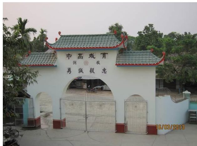
密支那育成學校校景