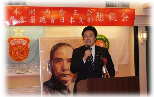
日本眾議院議員中山泰秀也應邀全程出席、交流互動

除了向在場鄉親細數客委會近年來的政策措施外，黃主委也特別邀請在場鄉親踴躍報名參加廣受歡迎、目前正在報名中的「海外客家美食料理研習班」，以及預計 11 月份在臺灣舉辦的「全球客家懇親大會」。黃主委說，「海外客家美食料理研習班」只要一開班，年年報名人數都破表，顯示海外客家鄉親對傳承客家飲食文化的殷切期盼。黃主委表示，海外鄉親的支持，是客委會推廣客家文化的動力，未來客委會也會持續舉辦各項活動，期待大家共同努力，讓客家文化與精神永續傳承。