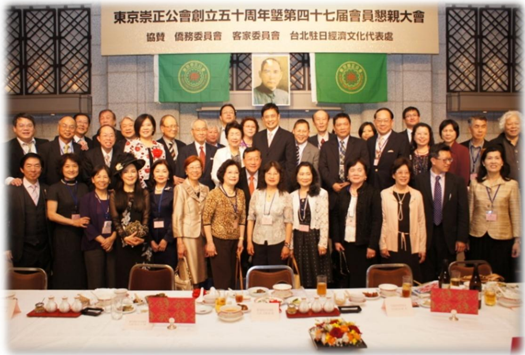
客家委員會黃主委及與會貴賓合影留念。

緊接著由其他貴賓輪流致詞，並進行紀念品互贈及懇親交流餐會。包括臺北駐日本經濟文化代表處沈大使斯淳、日本參議院議員大江康弘、西田まこと與前眾議員中津川博鄉及印尼第一任總統蘇卡諾的遺孀黛薇·蘇卡-諾夫人等人，均上台致詞恭賀大會成功。會中由本會邀請的臺灣客家山歌團也帶來多首精采的客家歌謠表演，讓大家沉浸在濃濃家鄉味的客家藝文饗宴氛圍。主辦單位也邀請和太鼓及日本傳統的阿波舞踊等代表日本文化的藝術表演，為大會增添臺、日文化交流意象。最後在摸彩抽獎的高潮下，畫下圓滿的句點，大家相約明年再相見。