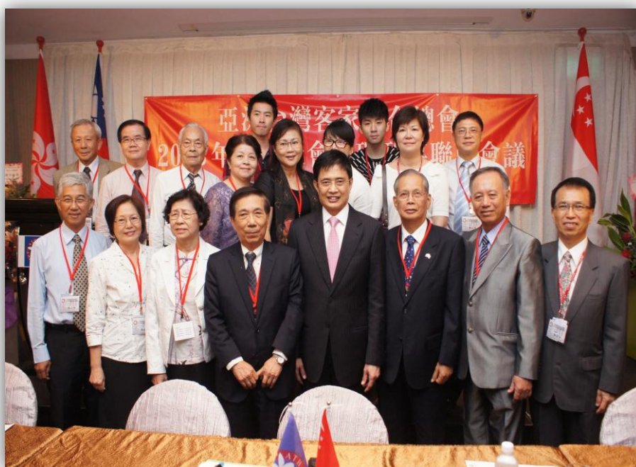
本會黃主委與亞洲臺灣客家聯合總會重要幹部合影留念。