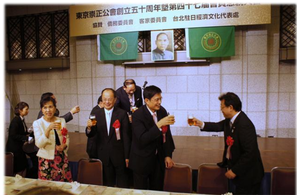
出席貴賓舉杯恭賀大會圓滿，圖為黃主委與日本參議院議員西田まこと舉杯恭賀情形。

客委會對客家語言復甦和傳承所做的努力經過黃主委的說明，獲得在場鄉親一致讚賞，也讓身在異鄉的鄉親們頻頻點頭表示認同。最後黃主委再度提及，很高興能夠來到日本參加活動且遇到許多的客家鄉親，更感到相當親