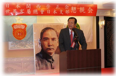
臺北駐大阪經濟文化辦事處黃處長諸侯應邀出席致詞

忘祖宗言」的祖訓，讓客語代代傳承下去。他強調，唯有鼓勵年輕人和小孩子學習客語，才能有效保留客家文化及語言；黃主委也指出，「客家基本法」的公布施行，不但對台灣的客家人是一個