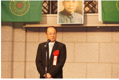
臺北駐日本經濟文化代表處沈大使斯淳應邀致詞

黃主委說，他深知語言學習需要妥善的環境，尤其是在海外傳承客語更是不容易，因此特別推出「客語百句認證網」，除了可說是海外鄉親傳承客語的最佳利器外，更是客語教學及線上測驗