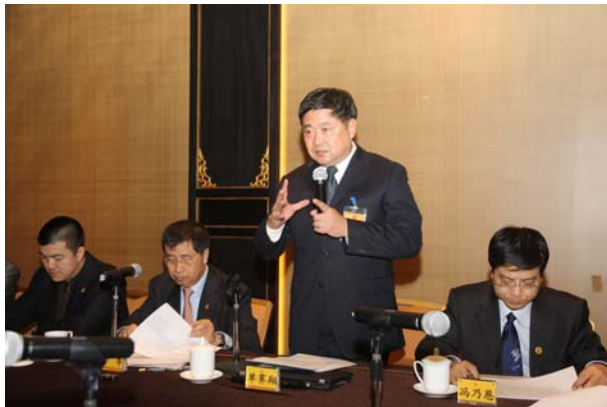
雙方交流合作會議結束，單院長進行總結報告

(十) 至於民國九十九年（2010）十一月兩岸故宮視訊會議決議「成立兩岸故宮合作研究課題庫，由業務部門討論，確定後逐年落實」部分，北京故宮博物院提議進行文物分屬收藏情況聯合調查。據北京故宮表示，一九四九年文物遷台造成部分清宮舊藏同一件（套）文物分藏於兩岸故宮，文物整體歷史資訊因而無法保持完整，於典藏及研究