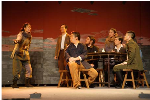
《海棠依舊》話劇一景

下午二時，本院訪問團受邀赴北京故宮博物院報告廳觀賞由其員工自行編製排演的青年文化節演出劇目《海棠依舊》。劇情以民國二十二年（1933）迄三十八年（1949）文物播遷為背景，頗足表現故宮人對於國寶文物的情懷，以及維繫民族文化於不墜的責任感與使命感。劇中