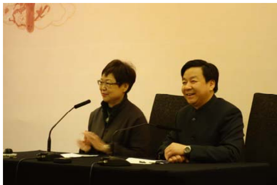
馮院長與龔良院長召開聯合記者會