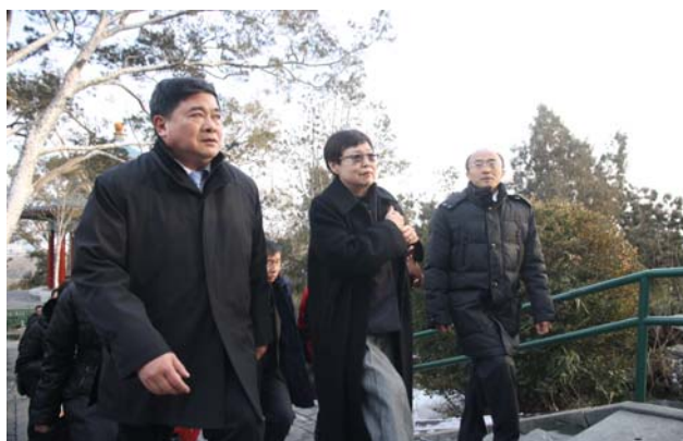
馮院長一行登景山，單霽翔院長（左）沿途親自導覽解說

上午八時，本院訪問團一行自桃園國際機場出發，十一時許抵達北京。故宮博物院單霽翔院長率李季、馮乃恩二位副院長，以及外事處處長楊長青、科長楊森等接機。雙方於機場貴賓接待室相互致意，略作寒暄。下