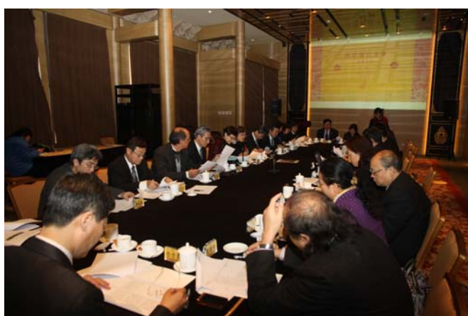
兩岸故宮交流合作會談一景

(四) 展覽交流部分，雙方近數年來合作頗為順利。本院自民國九十八年迄今推出之大型年度展覽，如「雍正—清世宗文物」、「山水合璧—黃公望與富春山居圖」、「康熙大帝與太陽王路易十四—中法藝術文化的交會」等，均曾向北京故宮博物院申借文物；北京故宮辦理「故宮文物南遷」、「建院八十五週年故宮院史」等特展活動時，亦曾請求本院協助。今年十月，本院舉辦「乾隆皇帝的藝術品味」展覽，將再次商借文物，充實展陳內容。北京故宮亦已正面回應，展現善意。至於借展文物清單，猶待兩院器物部門同人進一步討論確認。