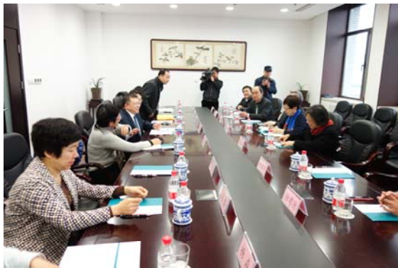
本院訪問團與中國國家圖書館張志清副館長等會談

以及國家圖書館出版社方自今社長、歷史文獻影印編輯室殷夢霞主任等亦在座。對於合作出版「天祿琳琅」叢書，並共同編纂《天祿琳琅書目新編》與《天祿琳琅書目圖鑒》，雙方興致極高，會場氣氛頗為熱絡。主要結論凡有如下三端：(一)《天祿琳琅書目新編》與《天祿琳琅書目圖鑒》二書所收目錄之格式體例宜統一，其內容樣式將由國家圖書館與北京故宮博物院圖書館擬定，並送由本院確認；(二)