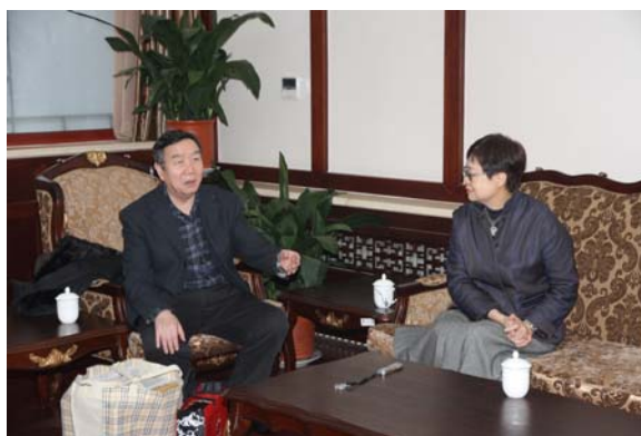
馮院長拜會北京故宮博物院鄭鑫淼前院長

午，北京故宮安排赴景山游觀，由單院長親自導覽解說。一行自景山公園東門拾級而上，途經富覽、輯芳二亭，繼達峰頂萬春亭，瞻仰木質漆金毗盧遮那佛像。當日晴空萬里，前日大雪猶殘，由景山俯視紫禁城，紅牆黃瓦高低井然，宮殿歷歷在目，侵擾北京多時之霧霾一掃而空。單院長以其建築工程背景，既言北京建城之中軸理念，亦論明清宮殿苑囿之架構統緒。四時許，馮院長等出景山公園西門，由單院長引領赴北京故宮文物保護基金會，與鄭前院長欣淼先生晤面，感謝其在推動兩岸故宮交流合作方面之貢獻。案故宮文物保護基金會會址乃前清內務府御史衙門所在，住用戶於二〇〇四年騰退遷出後，故宮博物院即重予整修維護，現為其城北新基地，亦屬北京重要古蹟維護成果之一。鄭院長於二〇一二年元月致休後，即在此埋首故宮院務發展之史料梳理與宮殿修築之文獻調查。