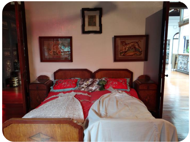
檳城僑生博物館內新娘房一景

這棟有百年歷史的鄭景貴故宅自二次大戰後，經過一段長時間的荒廢，經相關人士購得此宅及經多年修復，終在 2003 修復完成，目前每日約有 300 名至 500 名遊客入內參訪。而館內建築風格及裝飾結合了中西文化，涵蓋中華木雕、西方雕像、英式地磚等，館內除展示著各式各樣來自中國或西方的珍藏品，亦有「30 至 50 年代娘惹新娘房」，讓人一窺當時的婚紗及新娘房設計。由於檳島當時是著名的貿易區，鄭景貴經由來自世界各地商家貿易時機，收集各項優質品並置放豪宅內，並以結合中、西、馬來的峇峇娘惹生活型式於一身，諸如中式家具搭配西式鍛