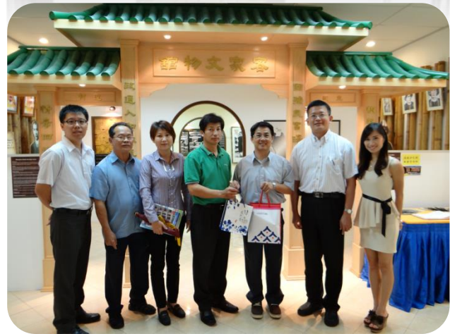
檳州客屬公會會長及副會長接贈本中心園區簡介及園區馬克杯等禮品