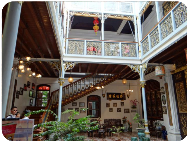
檳城僑生博物館內天井一景

前往馬來西亞並與父親及兄長相聚，鄭景貴經多年的努力及靠採錫、收稅金成為當地的富豪，後於 1877 年獲封為霹靂州的甲必丹，並設立「海山會」，後因當地於霹靂州及檳城爭奪錫礦引起動亂，鄭景貴即以首領身分，與介入協調的英國人簽署「邦咯協約」，以