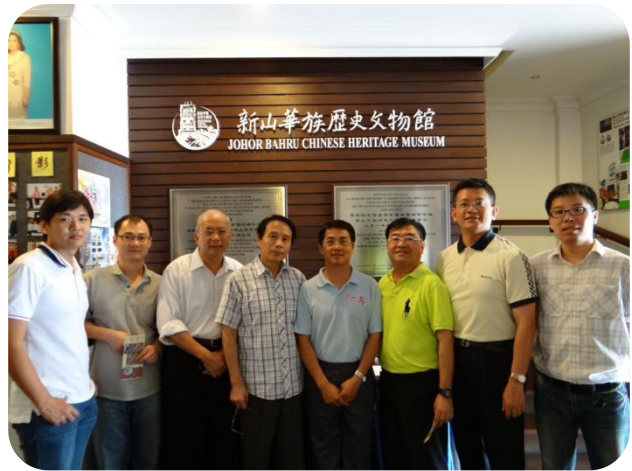
與新山客家公會總務於新山華族歷史文物館內合影

的活動情況和舊日用品等，亦有五幫的歷史發展軌跡，可以看到新山華人對在地華人文化保存所做的努力，這些前人走過的軌跡，是新山人重要的資產文化，它不僅記錄和保存了新山華裔先賢過去在新山開山闢野的史跡，也為新山老城區注入了新的生命，成為新山重要的地標之一。