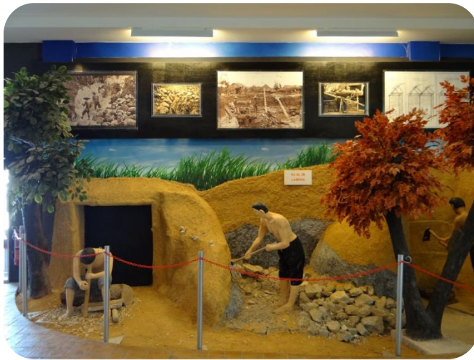
近打錫礦工業(沙泵) 博物館內採礦演進展 示一景-人工開採

近打錫礦工業(沙泵)博物館是馬來西亞私人界第一個展示錫礦業的博物館，該博物館仍持續擴充館藏，並就文獻、文物及器材持續蒐羅，以讓人們更能瞭解當年錫礦業的故事。進入博物館，就能實地感受當年錫礦開採演進，從一隻逃走迷失於森林中的大象「拉律(LARUT)」，因被人尋獲後，發現其身上泥土沾滿錫苗，進而成功發現礦產及開採，並將發現地命名為「拉律(LARUT)」，到展示採礦方式的演進、華人採礦史、採礦工具及其礦產應用範圍，其館藏在個人經營上可稱非常完整豐富，尤以展示說明同時有華語、美語及馬來語等多種語言，使參訪過程能輕鬆順利進行。