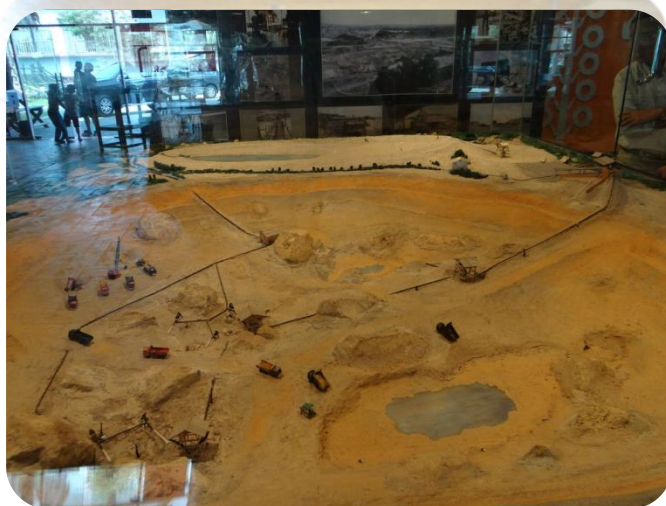
近打錫礦工業(沙泵) 博物館內採礦演進展 示一景-機械化開採