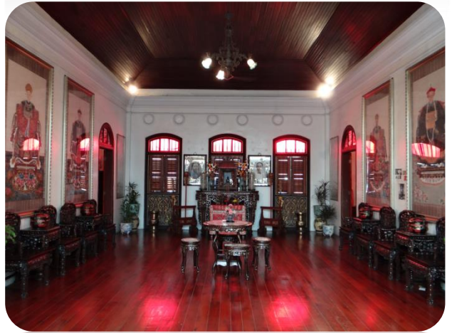
檳城僑生博物館內二樓一景