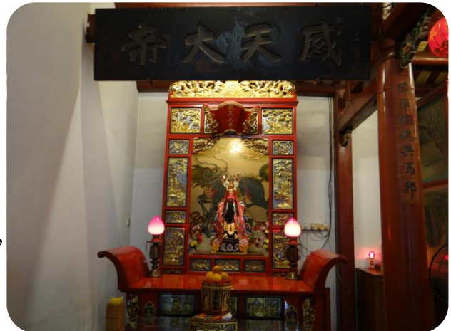
柔佛古廟內所供奉之感天大帝 係由客家幫負責之神明

柔佛古廟位於柔佛州新山市直律街，是新山最古老的建築物之一，其象徵著中華五個不同籍貫人民相互合作及奮鬥的精神，這五幫就是「潮州幫」，「福建幫」，「客家幫」，「廣東幫」和「海南幫」。柔佛古廟於 19 世紀後期建造，供奉玄天上帝、洪