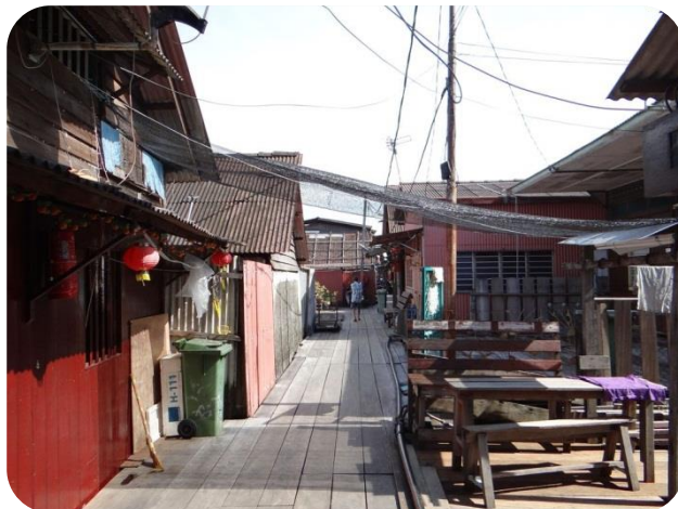
檳城姓氏橋之周橋

姓氏橋係於 18 世紀初華人來到檳城時，大多作為碼頭工人定居之處，又因某些因素，造就不同姓氏的人佔據一條橋，在橋上建