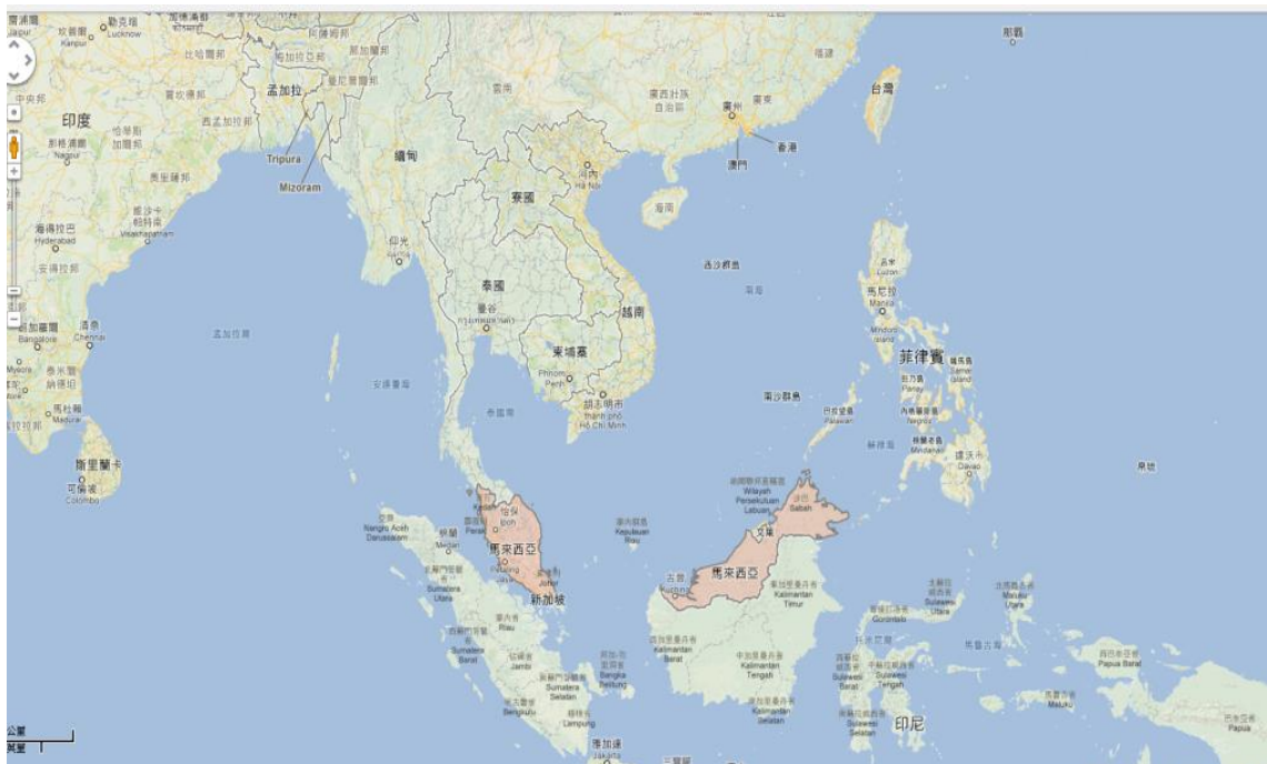
東南亞各國位置圖

本報告主要是以參訪馬來西亞霹靂洲、檳州及柔佛州的客家華人的生活形式、會館組織及辦學等觀摩經驗，書寫各處觀摩簡介、參訪過程及心得建議。以作為本中心日後對於海外客家聚落調查(含東南亞客家)之研究與客家文物保存方面之施政參考。