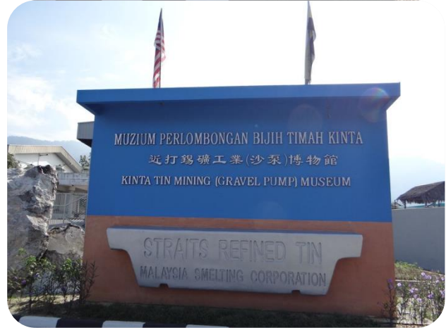
近打錫礦工業(沙泵)博物館

錫礦工業本是馬來西亞重要產業，在1985年以前，一直是馬來西亞輸出及賺取外匯主要來源，華人移民之初，亦大多從事此項事業，而該館係由馬來西亞錫礦工業公會前會長丹斯里丘思東創辦，並於2012年10月24