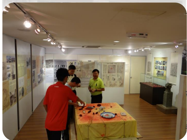
文物館內導覽人員解說義興展內容