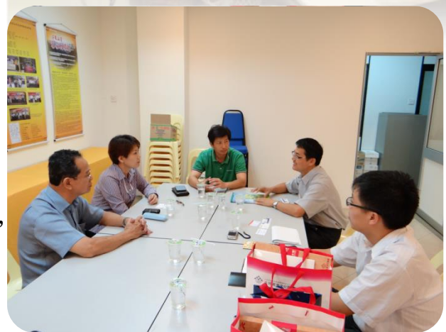
檳州客屬公會會長及副會長解說會務及文物館執行現況情形