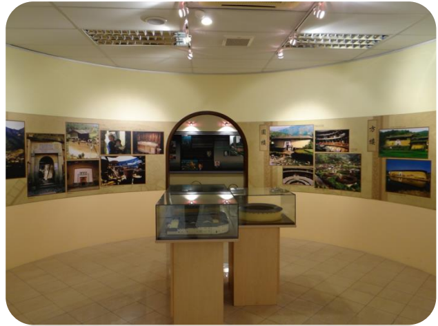
馬來西亞客家文物館內仿土樓展區一景

組織的歷史、興學辦校和開採錫礦事蹟，第三展區則為客家人在政治上扮演的角色、開闢城鎮、二戰抗日與文化和經濟上的貢獻，第四展區說明現代客家人在組織、教育、政治及經濟的事蹟，以及客家人的宗教信仰、傳統行業和飲食文化，第五展區為仿土樓圓式設計而建，展示和介紹中國最獨特的客家民居建築物「土樓」，並設有土樓模型，第六展區屬活動展區，以作為主題展覽空間，另外文物館內亦有藝術走廊、閱讀空間及資料研究室，主要展示客籍藝術工作者作品、典藏客家書籍刊物及提供學者和研究人員搜尋和參閱資料的空間，其內容透過影像、文字和實物，展示馬來西亞客家人於不同時期，即獨立前、二戰時和獨立後，對馬來西