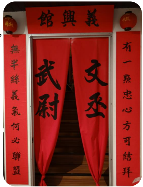
文物館內義興特展一景

進入新山華族歷史文物館，配合新山中華公會 90 周年會慶，正展示義興公司作為特展課題，而在新山，的確有許多與義興有關係的歷史遺跡，例如：陳厝港、柔佛古廟、明墓、義興路等。而展覽的內容包括洪門誓言、義興入會儀式、義興由來與新山義興領袖。另外在館內，亦展出昔日各鄉公會