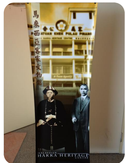
馬來西亞客家文物館內一景

首座馬來西亞客家文物館創立於檳城，於 2004 年 8 月 26 日正式開幕，文物館位置位於檳州客屬公會三樓，面積約為 3000 平方尺，並分為六個展區，分別為入口牌樓處展示客家人來歷背景、客家名人及馬來西亞客家組織分布地圖，第二展區為馬來西亞獨立前客家