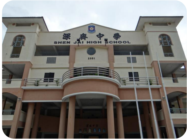
霹靂客屬公會創立之深齋中學

怡保深齋中學與客家人有很大的淵源，據怡保《深齋中學慶祝創校30周年紀念特刊》(1988年出版)記載，霹靂客屬公會遠在1956年就已決定創立深齋中學；兩年後，1958年該校一座3層教學樓在古老的霹靂客屬公會旁屹立起來(即今日深齋入門右手邊的校舍)，深齋是附屬於霹靂客屬公會的華校，1958年6月客屬公會董事會決議由董事15人申請註冊，隔年1959年建校至今(2013年)已54年，