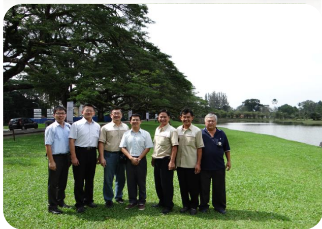
與北霹靂太平嘉應會館人員於 太平湖濱公園合影留念