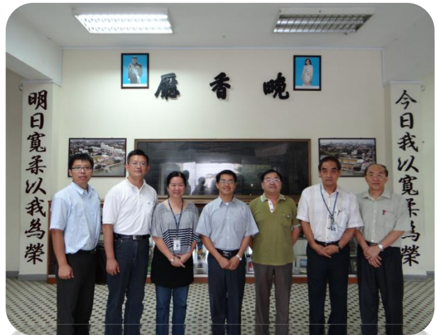
與寬柔中學校長、副校長及新山客家公會總務合影

費是由各階層的華裔人士所捐助，1958 年自行宣布成為全馬來西亞第一所獨立中學，該校是全馬最大型的獨立中學，在大馬當地被稱為「華人文化堡壘」，它讓華裔人士有機會接受從小學到中學的完整華文教育。並於 1999 年獲准建立分校，2005 年分校正式啟用，稱寬柔中學古來分校。現今寬柔中學總校及分校學生人數達 9000 餘人，為全馬來西亞最大獨立中學。