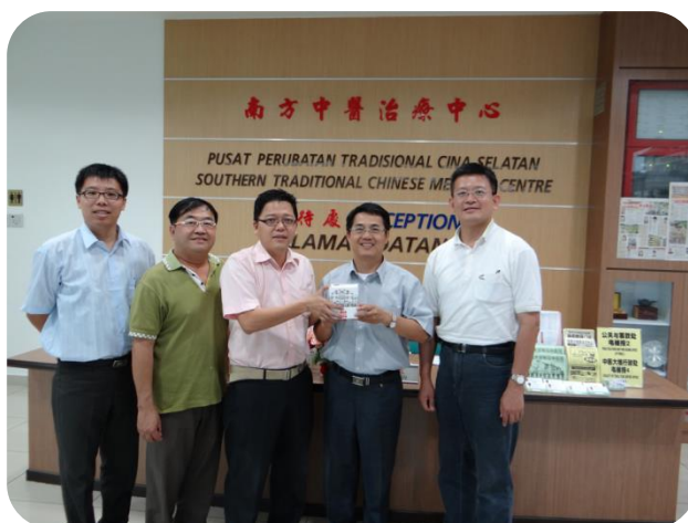
南方大學公關與籌款處主任贈送紀念品予本中心參訪人員

目前，南方大學學院共有 5 個學院：人文與社會學院、商業管理學院、藝術與設計學院、電機與電子工程學院及中醫藥學院，未來亦計畫興辦教育及研究學院，期以發展成著名國際大學。