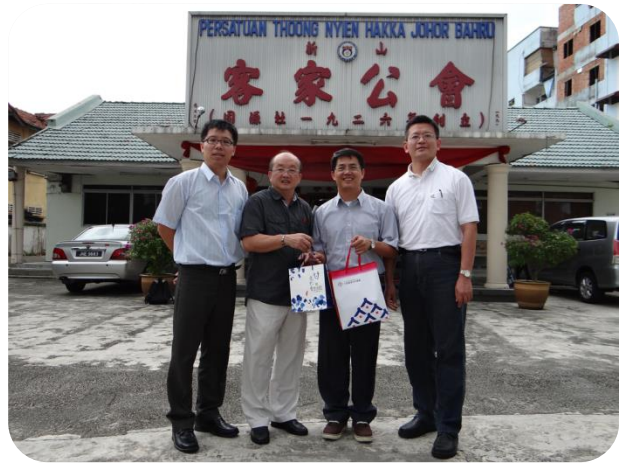
新山客家公會財政接贈本中心園區簡介及園區馬克杯等禮品

尋根考察團，使會員更進一步瞭解祖先開創精神及客家傳統文化，及推廣客家戲曲表演藝術，與臺灣的榮興客家採茶劇團於新山演出，共同為傳承客家文化努力。