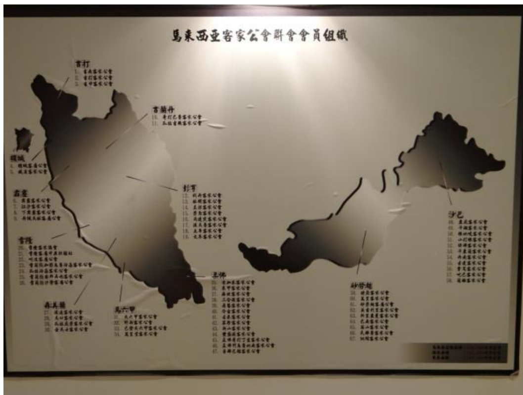
檳城客屬公會內之馬來西亞客家文物館所載之馬來西亞客家公會組織。

馬來西亞的客家人很早就有了組織，其中最早的華人會館當屬檳城嘉應會館(最初稱為仁和會館)於 1801 年創辦，並藉由會館與社團及血緣與地緣的關係結合讓外鄉的客家華人因此有可以聚集及互相幫助的依著點，其主要功能是照顧同鄉福利、提供暫時住所、尋找工作、祭拜神明、支持華文教育或報刊、供奉靈位等。