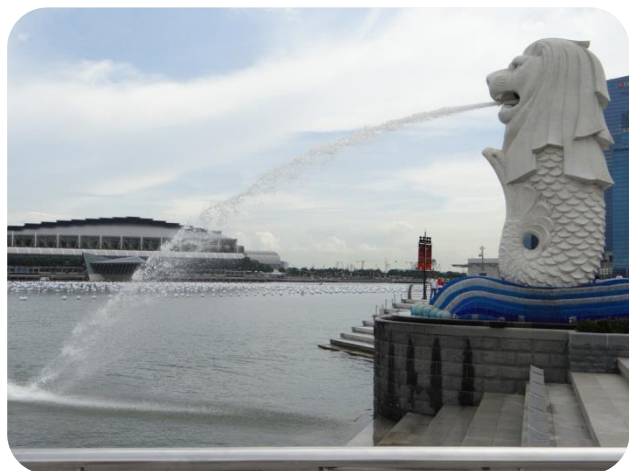
新加坡的象徵-魚尾獅

新加坡的魚尾獅自1972年誕生於新加坡藝術家林浪新之手，其獅頭代表傳說中十一世紀三佛齊王國的聖尼羅烏達瑪王子在踏上這個小島時所發現的一頭獅子，而魚尾象徵著古城淡馬錫（爪哇語中海洋之意），代表新加坡是由一個小漁村發展起來的，魚尾獅整體代表著