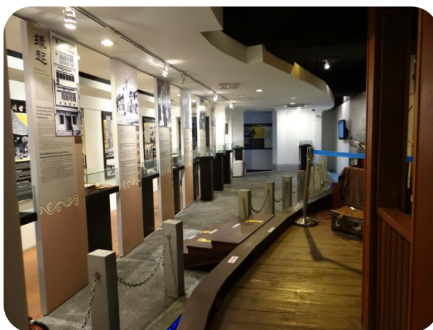
文物館內展覽一景：展示先民渡海下船開墾經營歷史

講到新山華族歷史文物館，就不得不提到陳旭年街，該區域一直是新山華僑的經濟活動中心，盛極時有商號 70 多家，都是老一輩華裔先賢努力經營的美好回憶。近年來