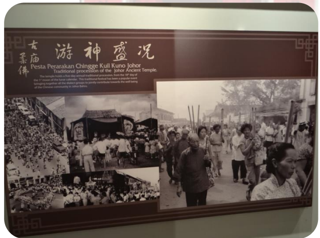
文物館內展覽一景