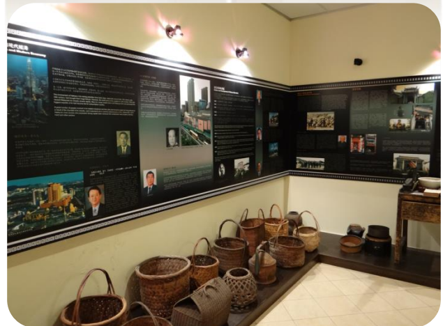
馬來西亞客家文物館內展區一景