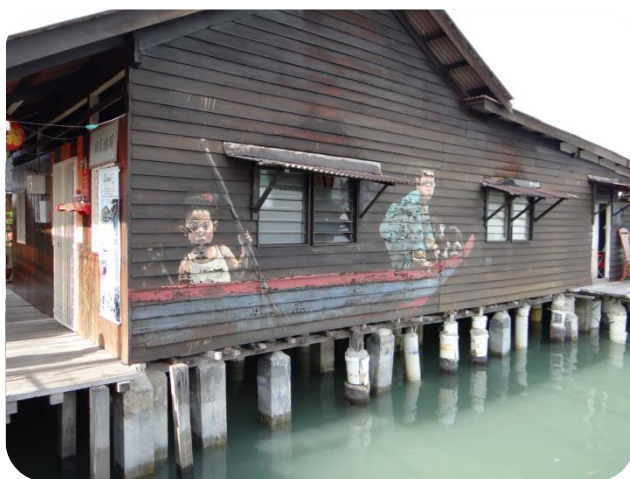
檳城姓氏橋之周橋上聚落一景 該建築物為周橋民宿

立家園。之後，陸續從它地而來的同姓人因無依無靠，就會於自己姓氏的橋屋居住，形成一種同家鄉或同姓氏居住在一條橋，以便互相照應，進而逐漸形成當地的文化遺產「姓氏橋」。姓氏橋房屋最早都搭建在海上，底部由混凝土或其他結構作為基座，再由木樁作為上部支撐，另其上以木板作為村里的街道，再於街道兩旁搭建房屋。如今姓氏橋僅剩 6 座，此項特殊景館亦於當地人士要求下，已獲當地政府承諾保