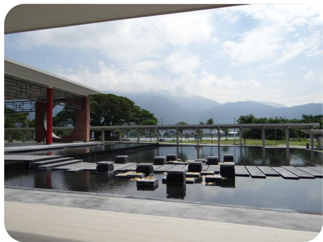
敦林良實禮堂前水池，其底部是黑色水泥，寓意「墨水」。

(Petaling Jaya)、吉隆坡文良港(Setapak)以及双溪龍鎮(Bandar Sungai Long)校區。其學生主要以華人為主，教學主要係以英文為語言，而在中文系則以華語為語言。