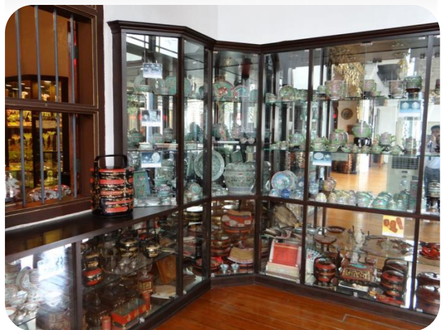
檳城僑生博物館內收藏展示物品