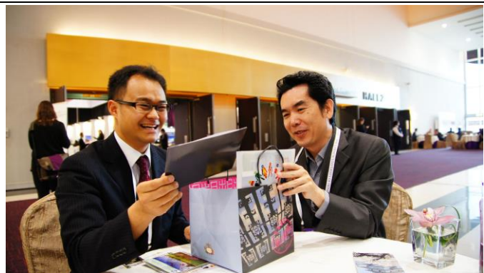
與日本會津大學會談後，並致贈本校禮品