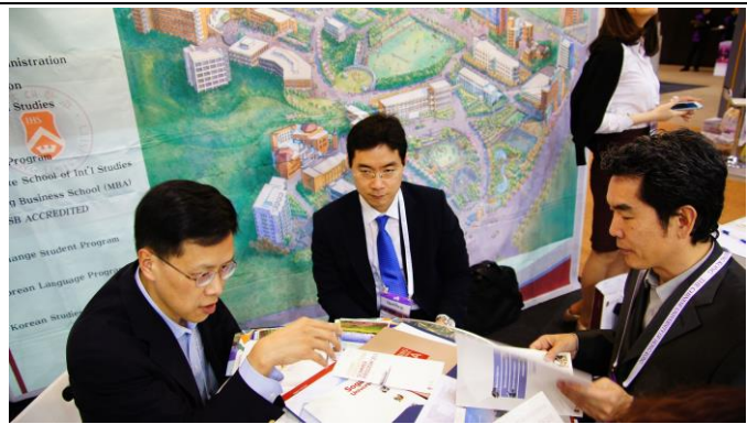
與韓國 Sogang University 會談