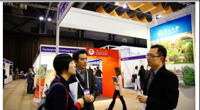
至中山大學攤位拜會該校代表人員