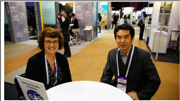
與紐西蘭 Waiakato 大學於會談後合影