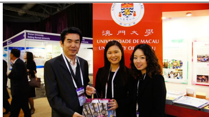
與姊妹校澳門大學會談，雙方互贈紀念品與文宣