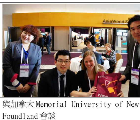
與加拿大 Memorial University of New Foundland 會談