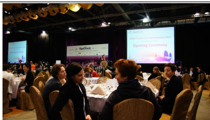
亞太教育者年會開幕餐會，並於餐會時間與海外學校介紹本校特色，也藉此認識其他海外學校。