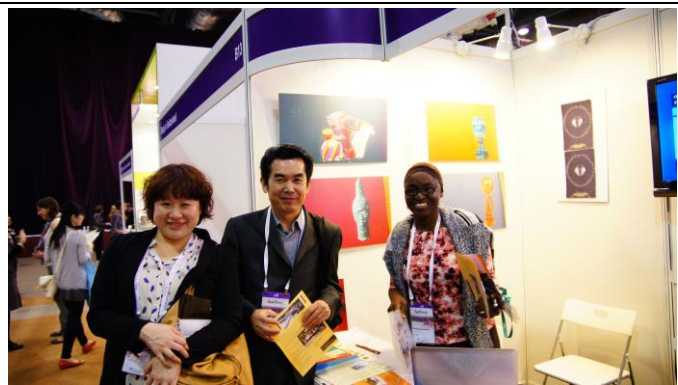
拜訪其他與會參展學校，介紹雙方學校，並致贈各校文宣，以供後續參考。