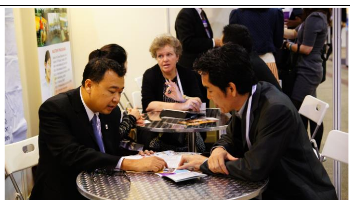
與泰國朱拉隆工大學教授會談