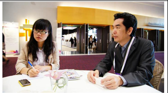
與上海東華大學會談