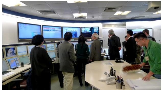
圖三、香港天文台氣象預報系統展示