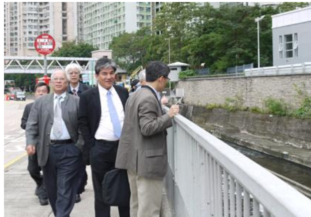
圖五、香港渠務署工地參訪