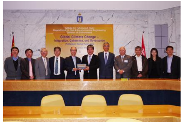
圖八、香港科技大學與李鴻源部長互贈禮物