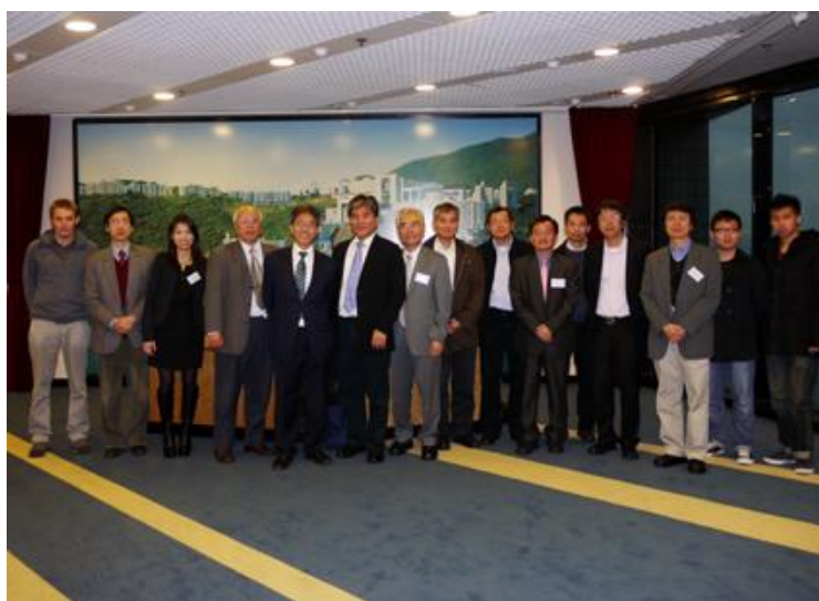
圖六、香港科技大學訪問

香港科技大學是亞洲排行前端的大學，行程中特別安排拜訪香港科技大學，包括圖書館及學生活動中心的參觀，最後由陳繁昌校長、李行偉副校長、史維副校長等召集學校主要主管共同討論學校發展方向及未來合作事宜。並由內政部李鴻源部長報告臺灣以全球氣候變遷及調適策略為題做專題報告及討論，圖六為訪問團在香港科技大學校長室合影，圖七及圖八為雙方互贈禮物紀念。