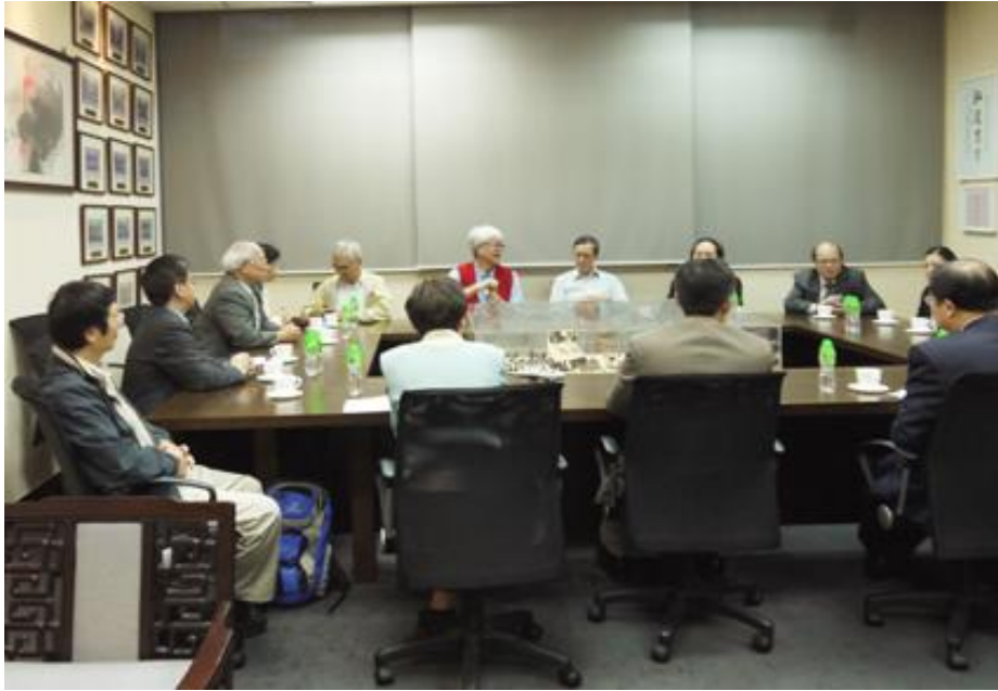
圖一、香港珠海學院交流