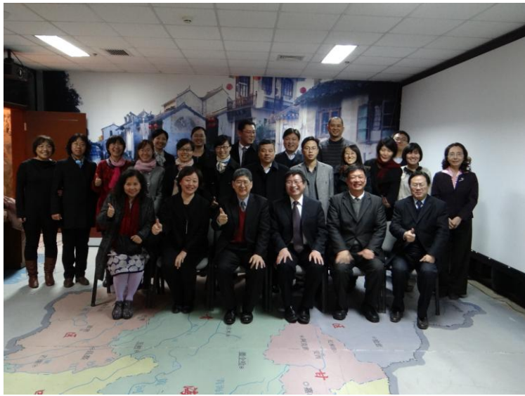
與會人員合影留念