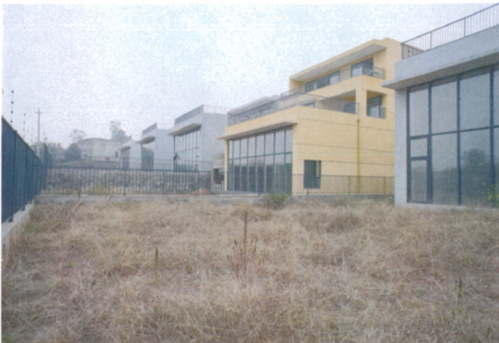
藍頂藝術家工作室區域