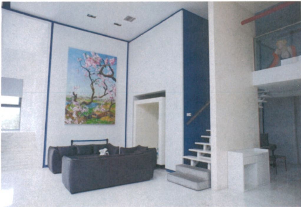
藍頂藝術會所內部空間