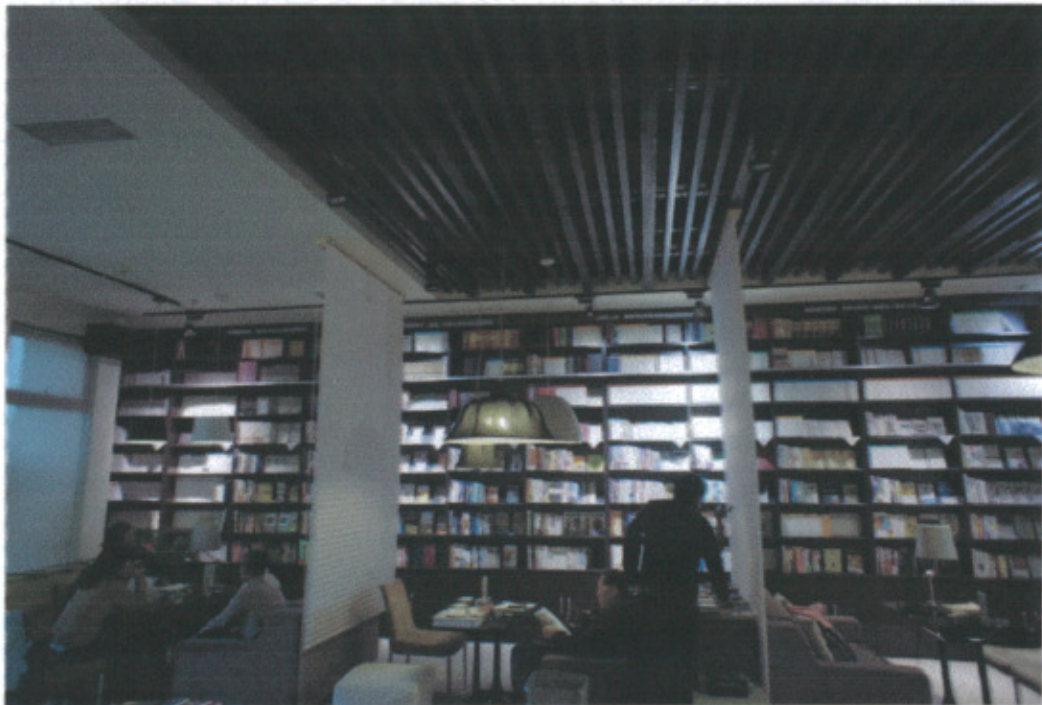
A4 當代藝術中心藝術書吧