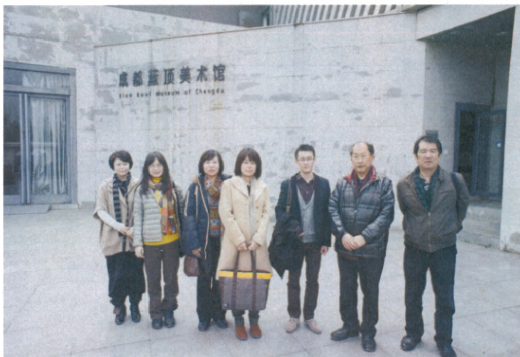
國美館參訪人員與藍頂美術館工作人員合影