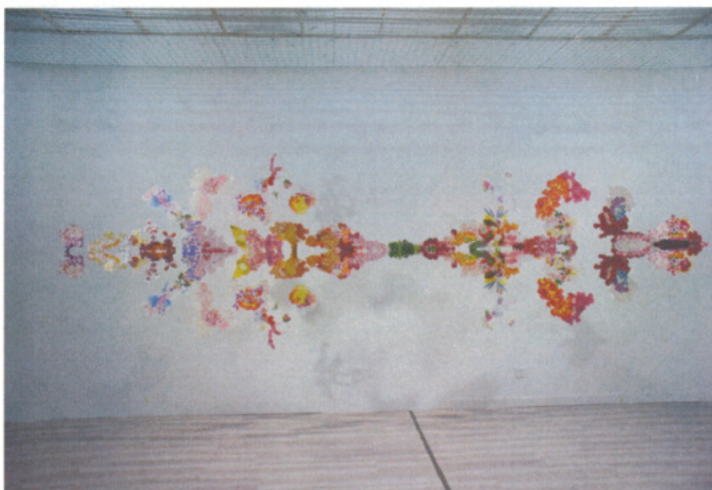
日本藝術家荒神明香作品