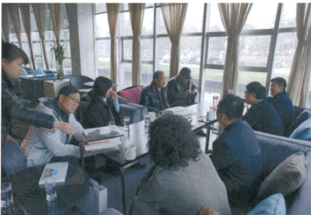
拜會呂澎館長及與當地藝文人士交流