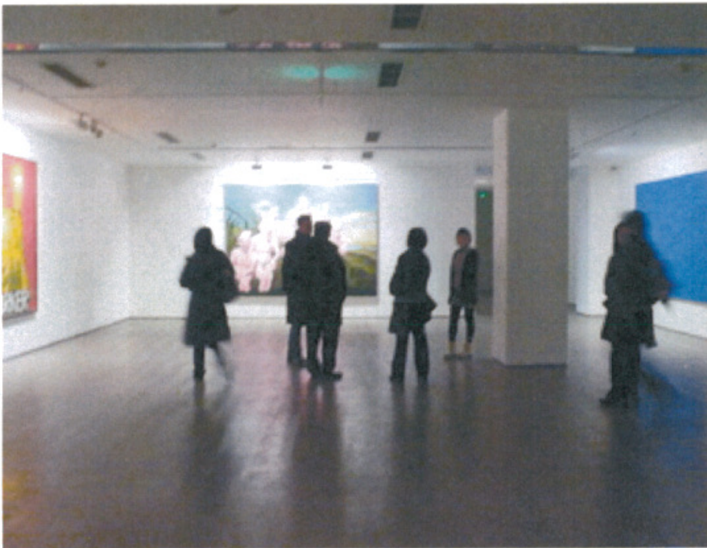
參觀今日美術館展覽與空間