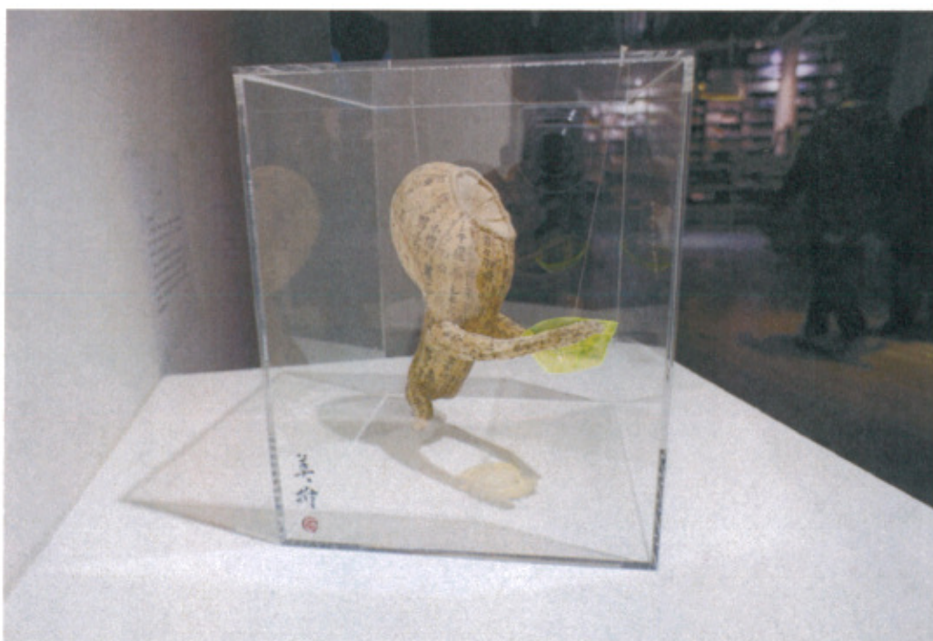
日本藝術家村山留里子作品