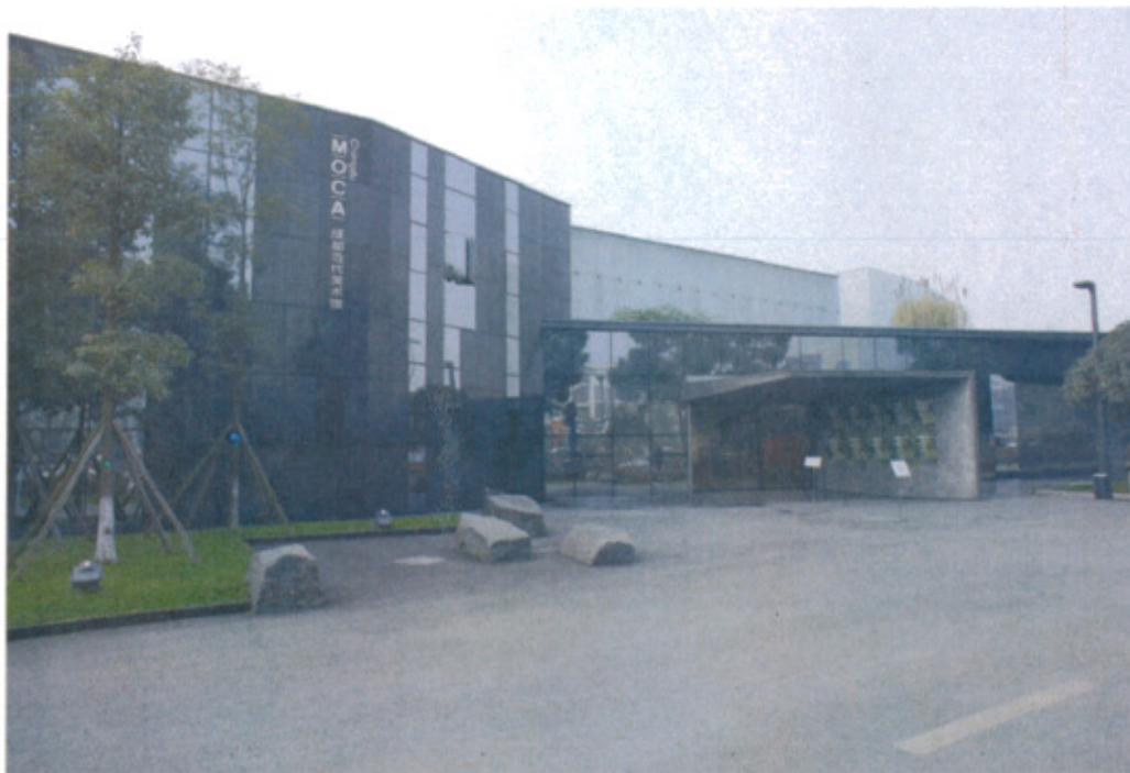
成都當代美術館正門