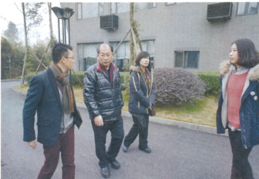
藍頂美術館工作人員介紹藝術家工作室區域