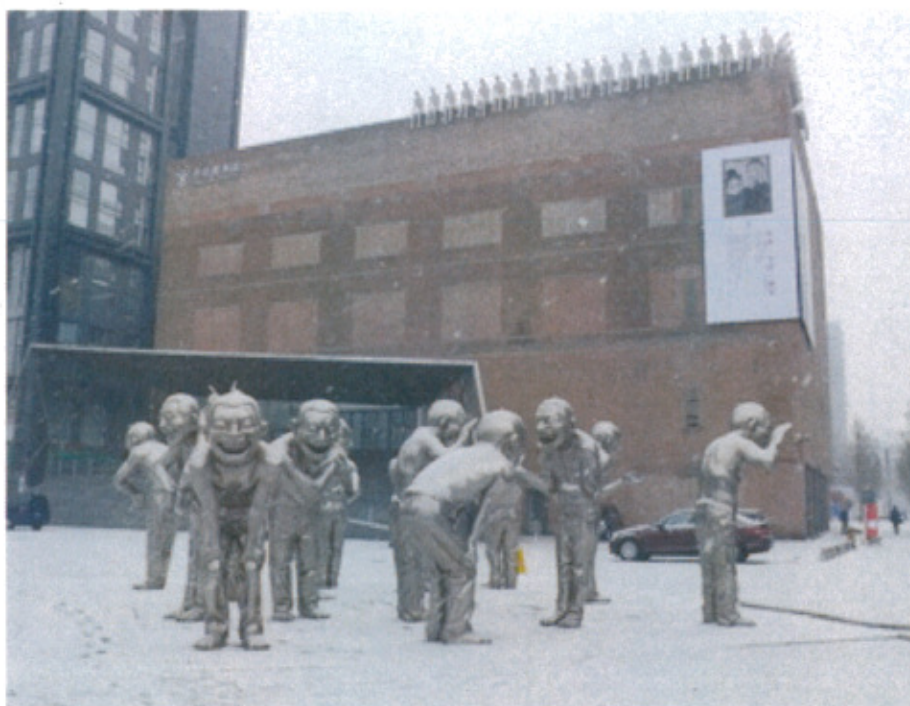
北京今日美術館外觀