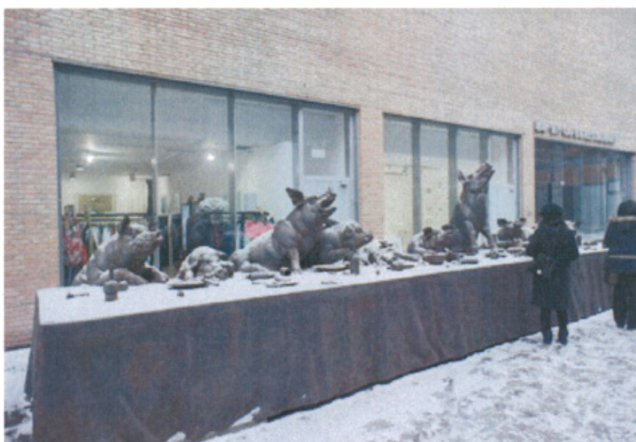
今日美術館戶外雕塑作品