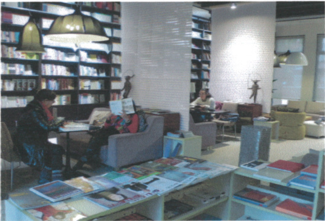
A4 當代藝術中心藝術書吧一隅