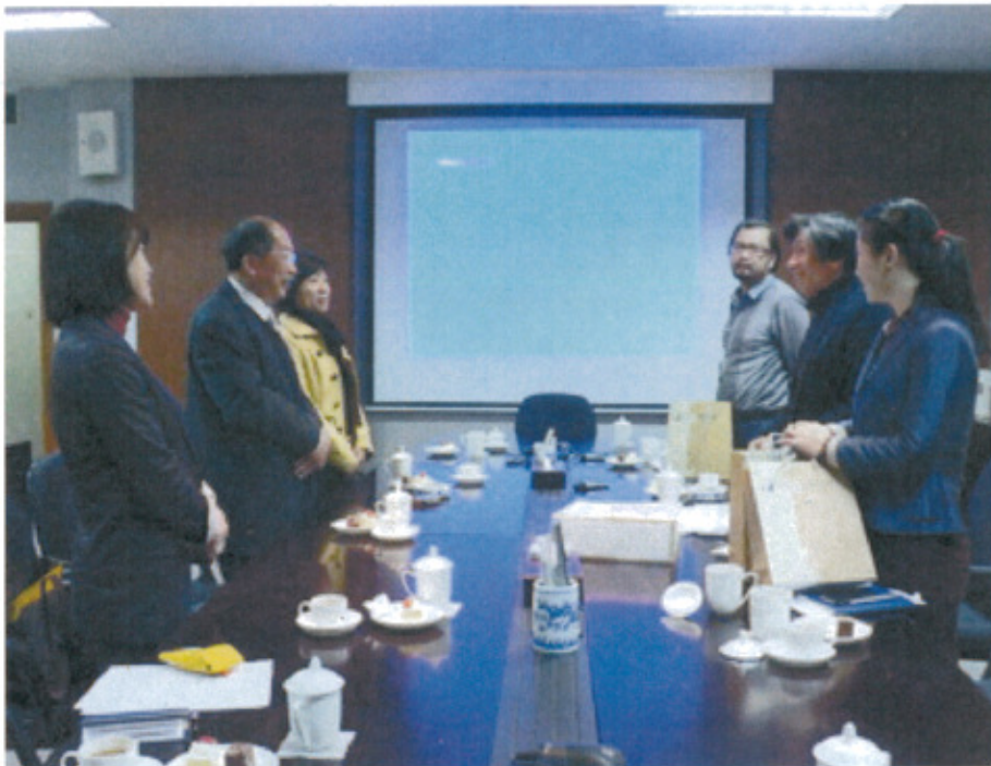
展覽計畫簡報意見交流