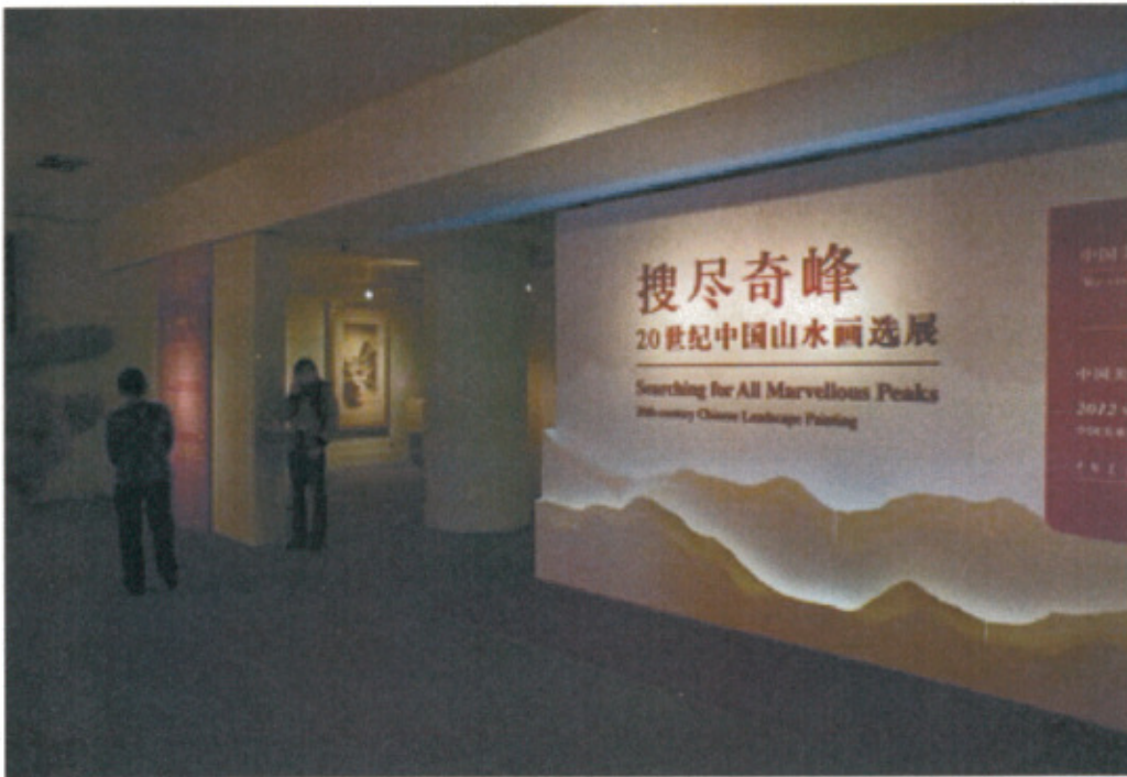
勘查中國美術館展廳狀況