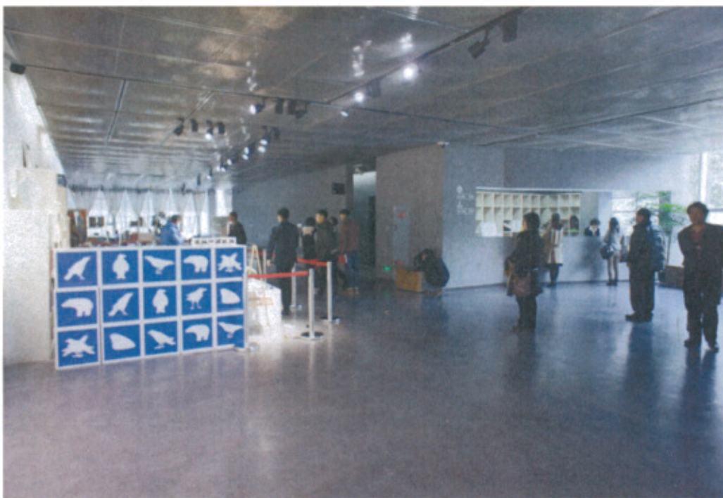
成都當代美術館入口大廳