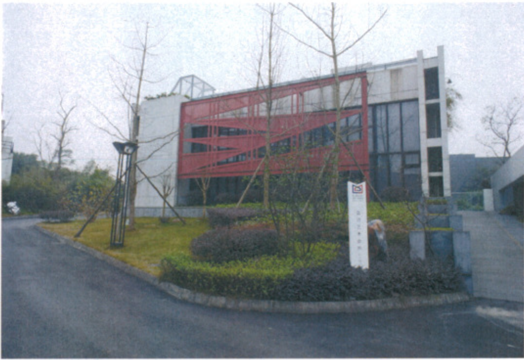
藍頂藝術會所外觀