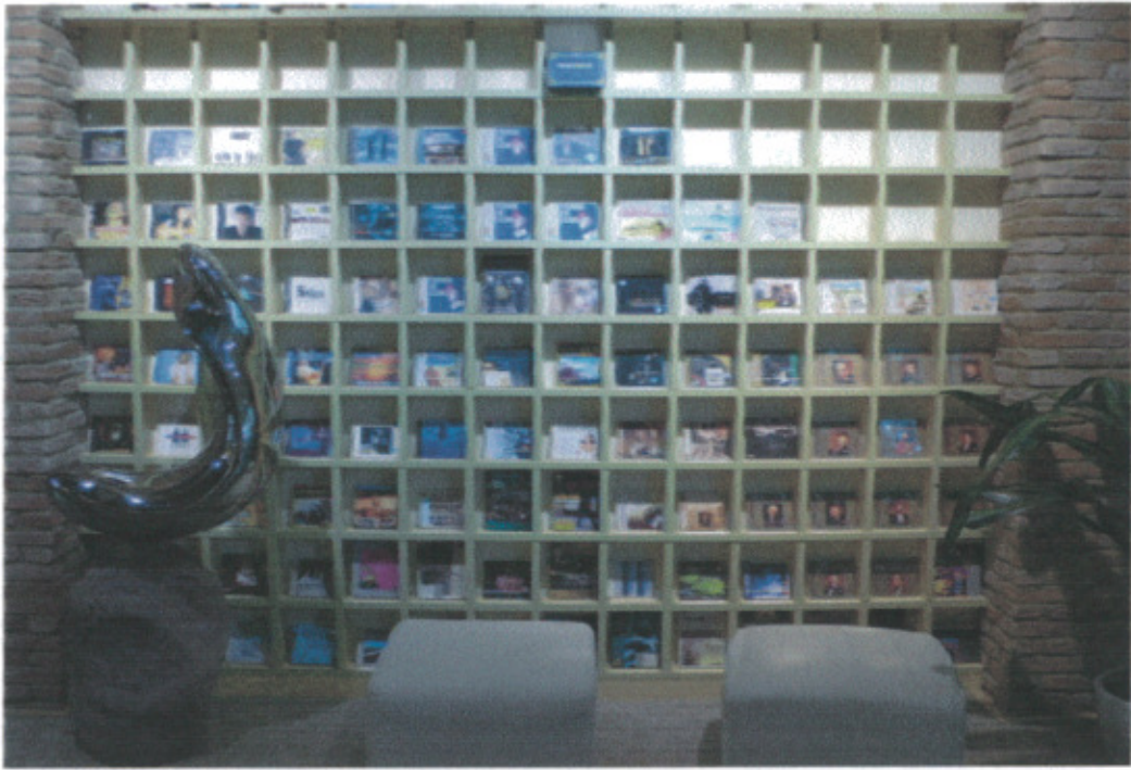
A4 當代藝術中心藝術書吧一隅