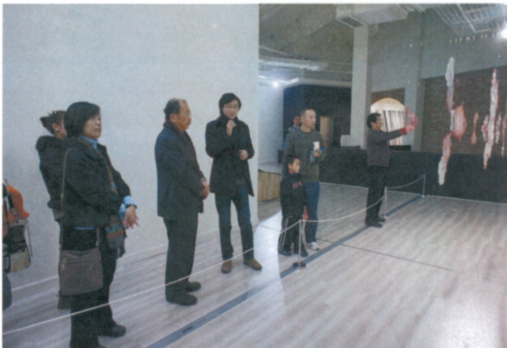
參觀 A4 當代藝術中心「平行的極東世界」展覽