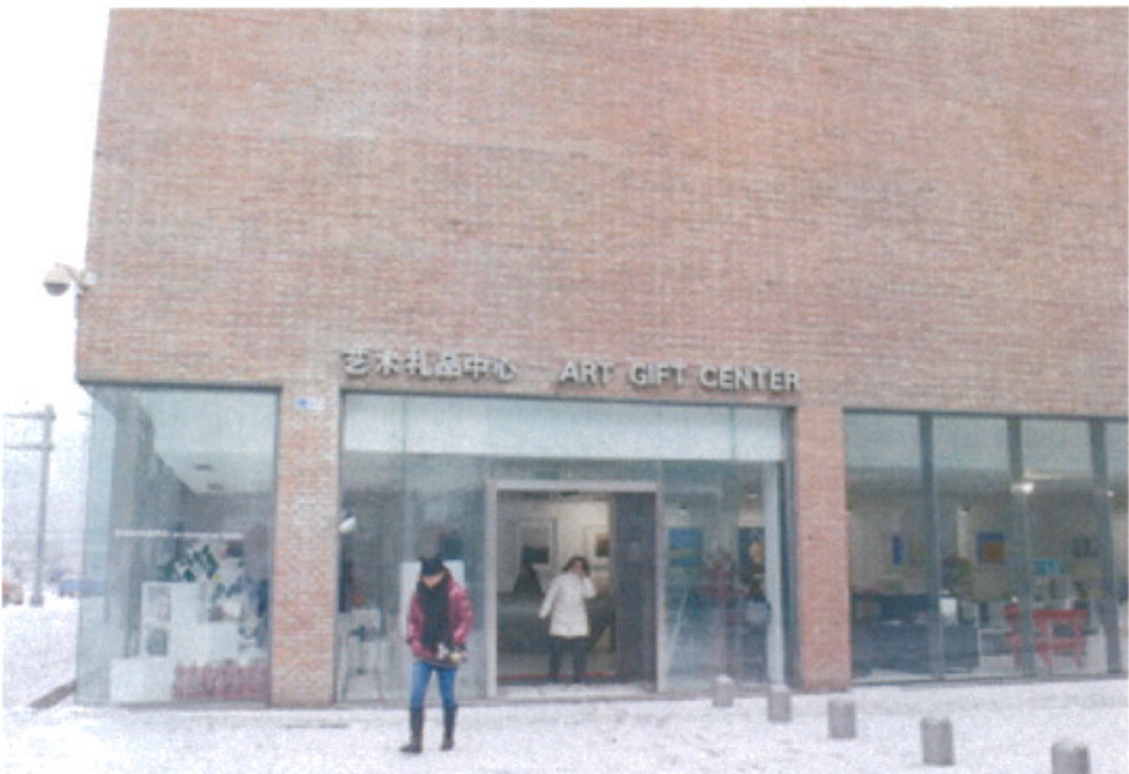
今日美術館外圍文創區域禮品中心