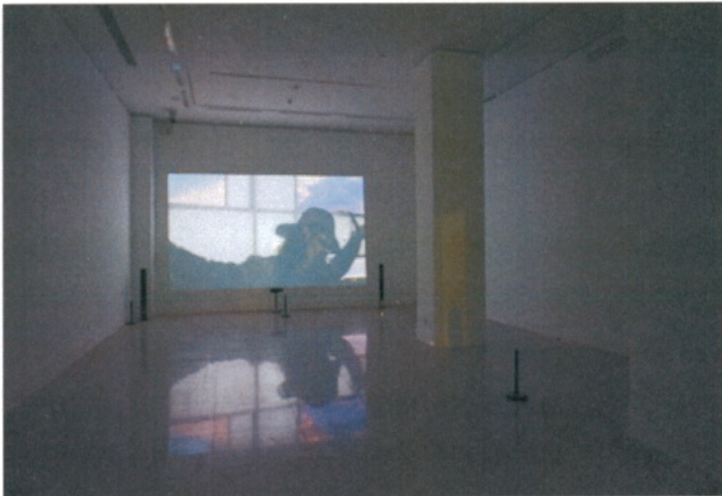
勘查中國美術館展廳狀況