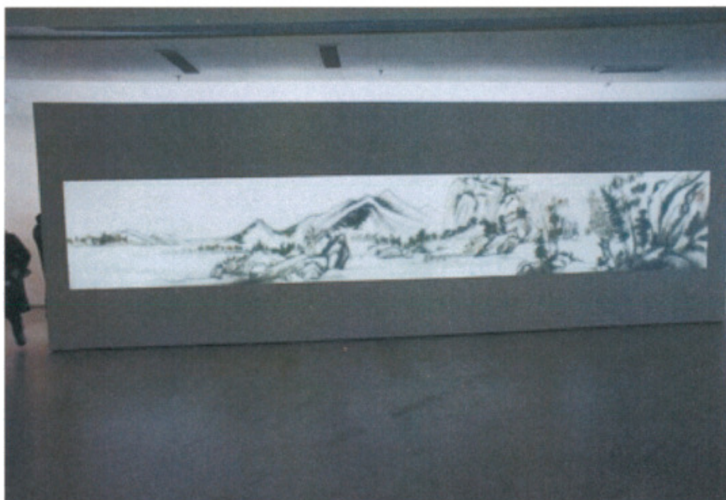
今日美術館展出藝術家徐冰作品