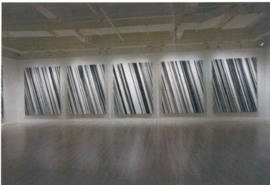
日本藝術家名和晃平作品