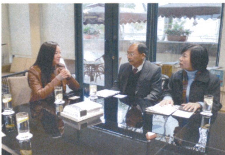
拜會孫莉館長並進行意見交流