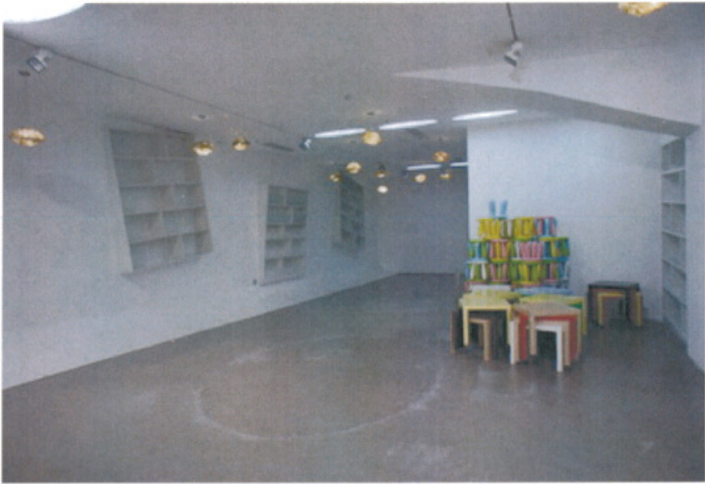
今日美術館教育活動區