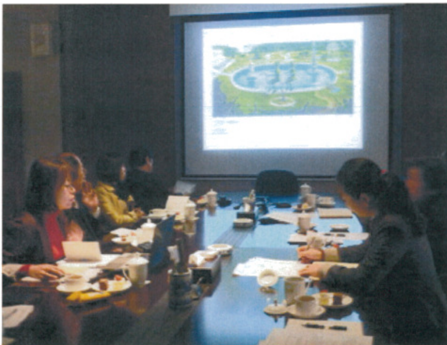
國美館進行展覽計畫內容簡報