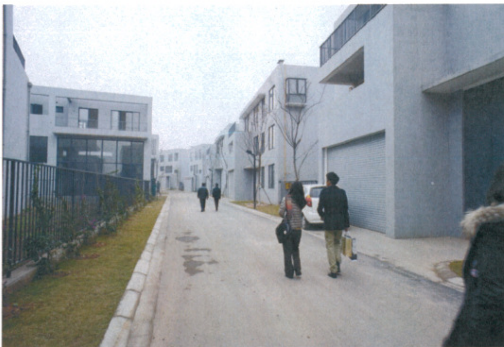
藍頂藝術家工作室區域