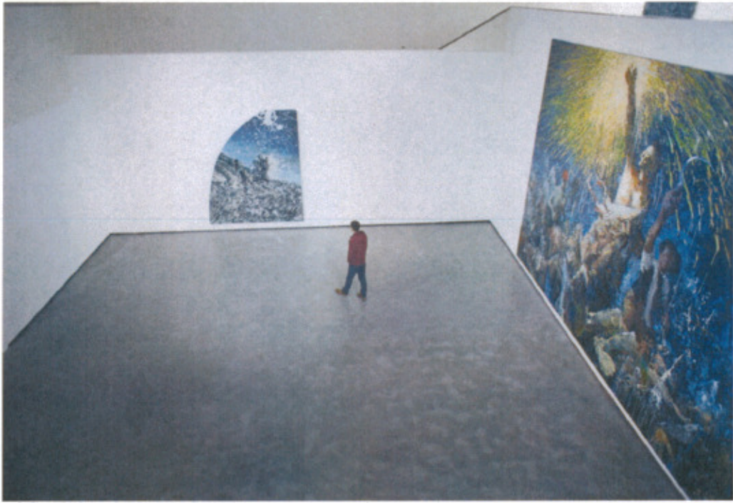
成都當代美術館空間獨特