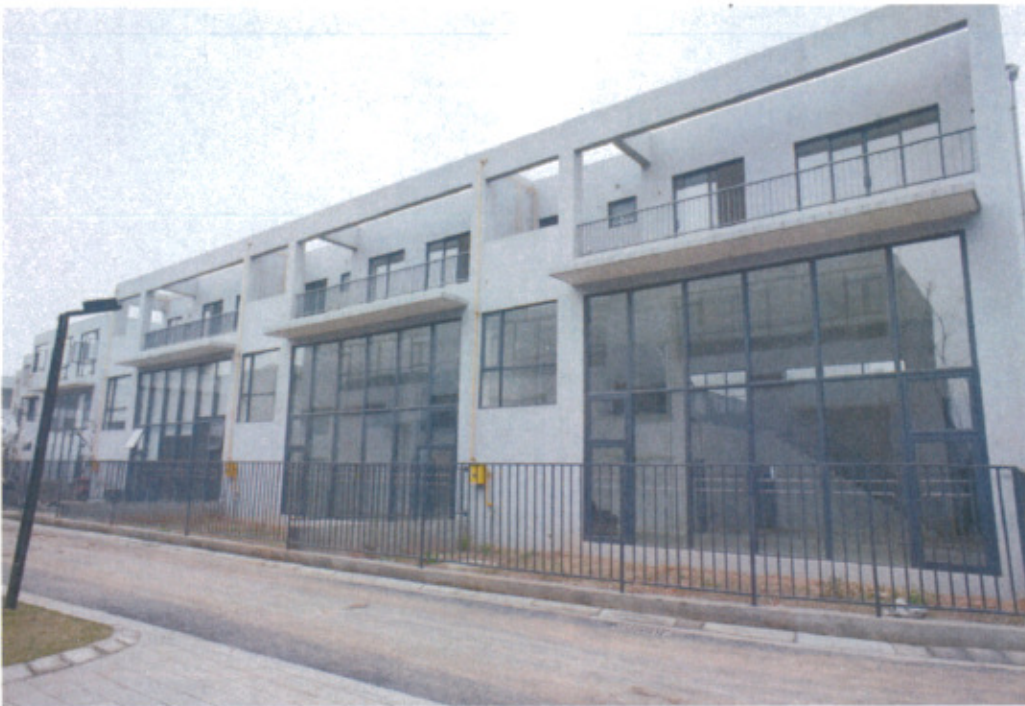
藍頂藝術家工作室區域