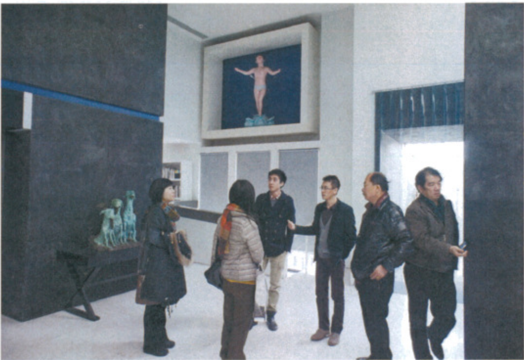
參觀藍頂藝術會所內部空間及作品情形