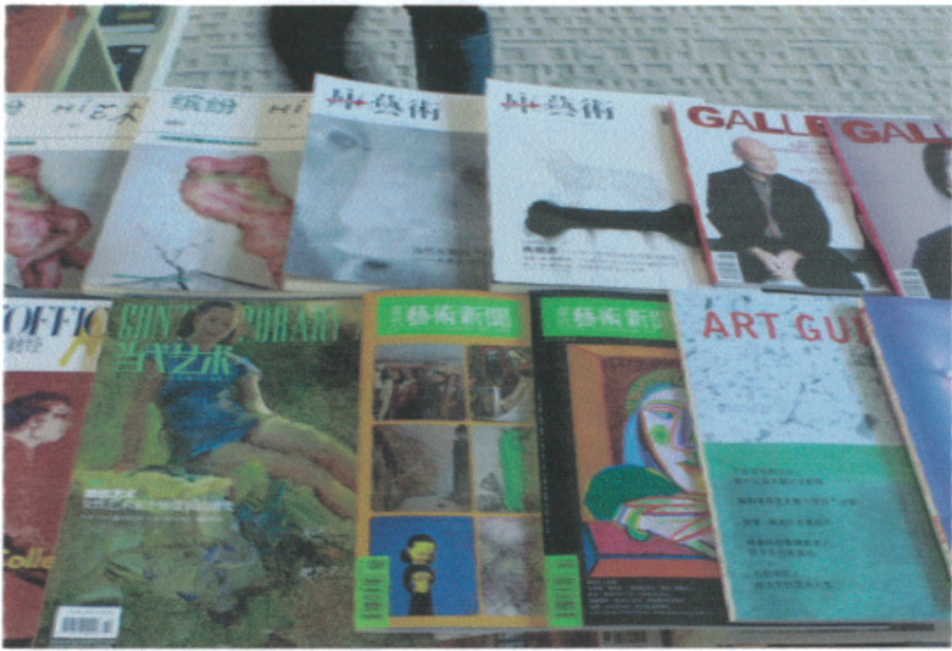
A4 當代藝術中心提供之雜誌資源