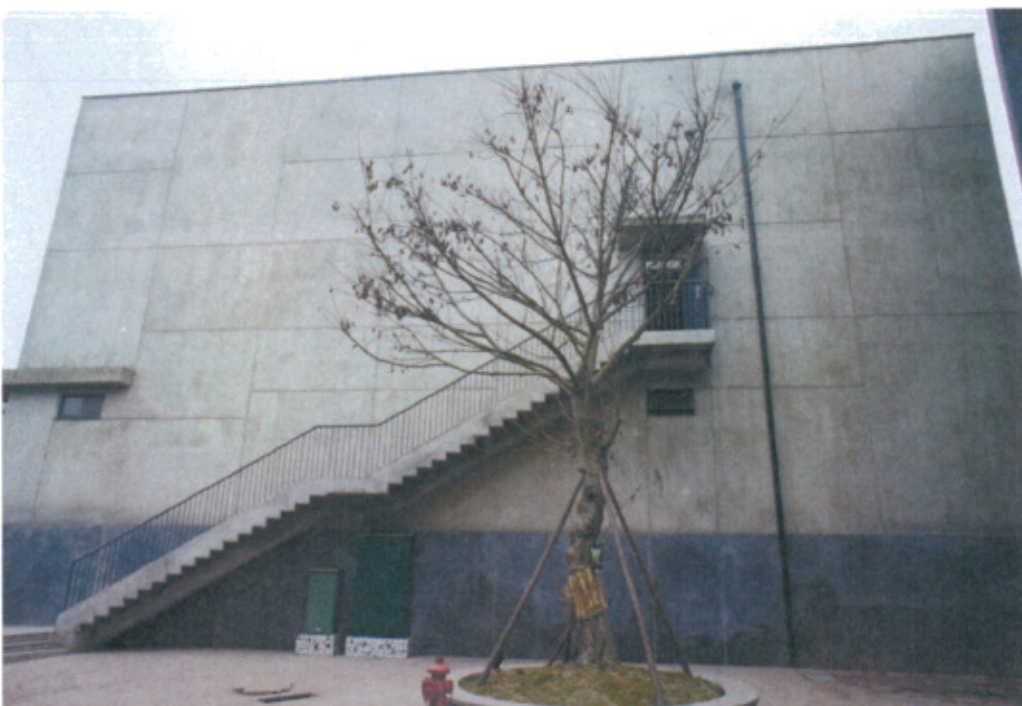
興建中的藍頂美術館新館外觀