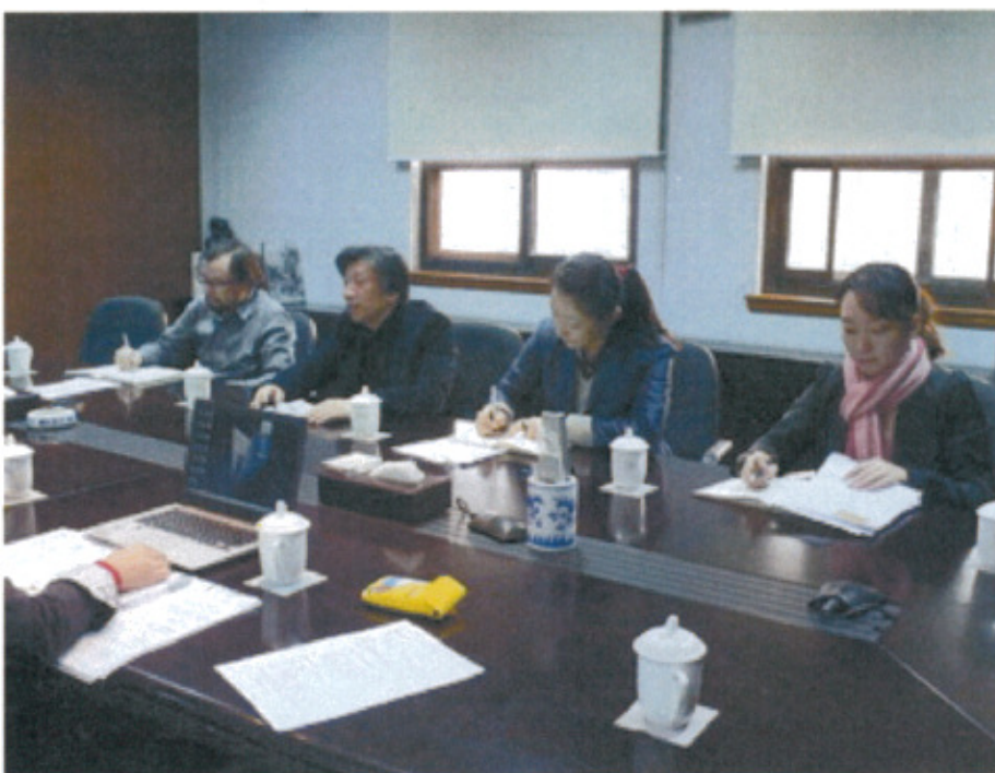
中國美術館就計畫簡報內容提出相關意見