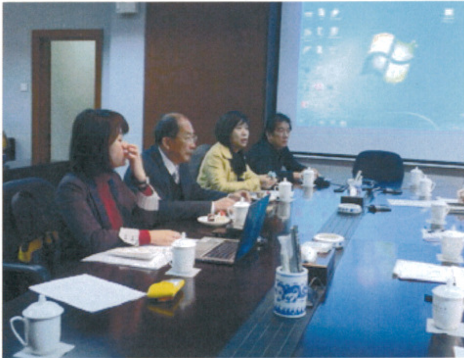
展覽計畫簡報意見交流