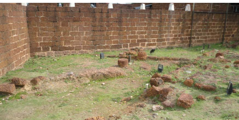
←馬來西亞政府沒有善加保存原古蹟，反而在古蹟上興造建築物來吸引觀光客，破壞古蹟。