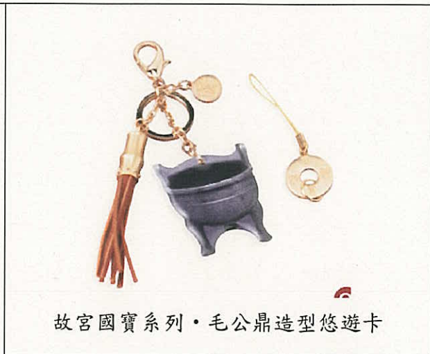
故宮國寶系列·毛公鼎造型悠遊卡