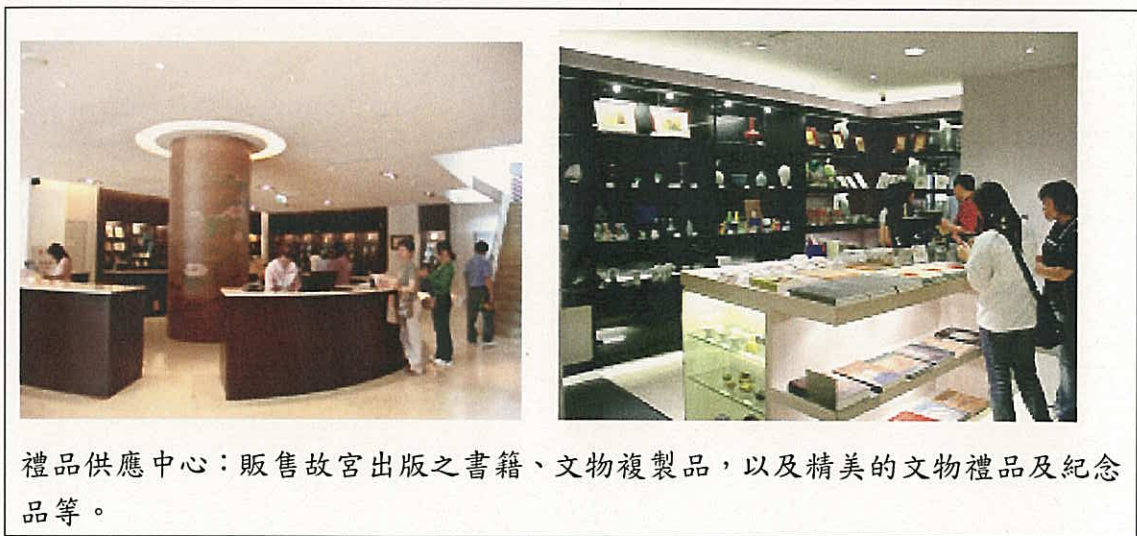
禮品供應中心：販售故宮出版之書籍、文物複製品，以及精美的文物禮品及紀念品等。