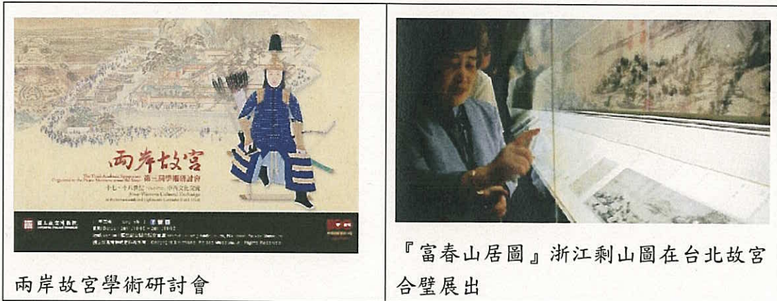
兩岸故宮學術研討會