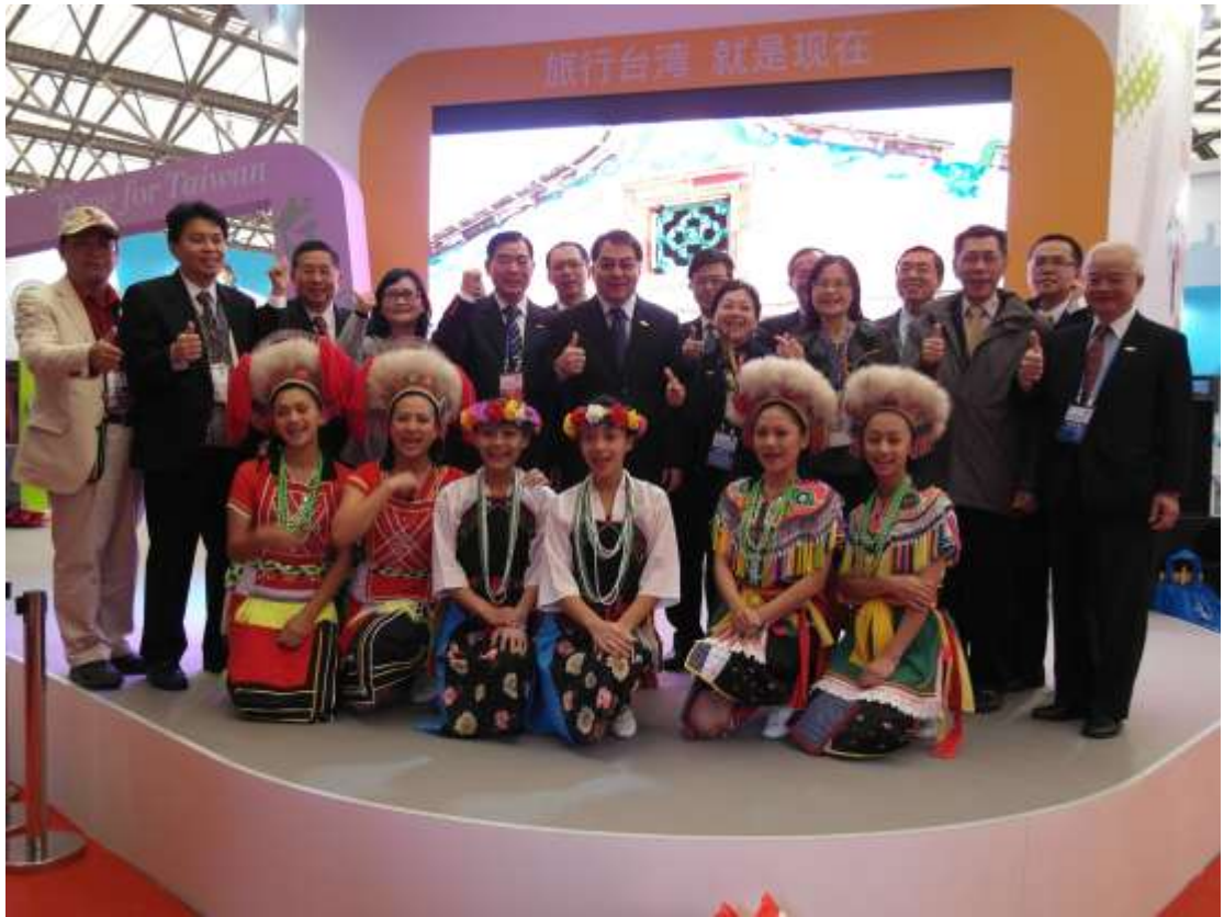
表演團隊於台灣館演出與代表團合影