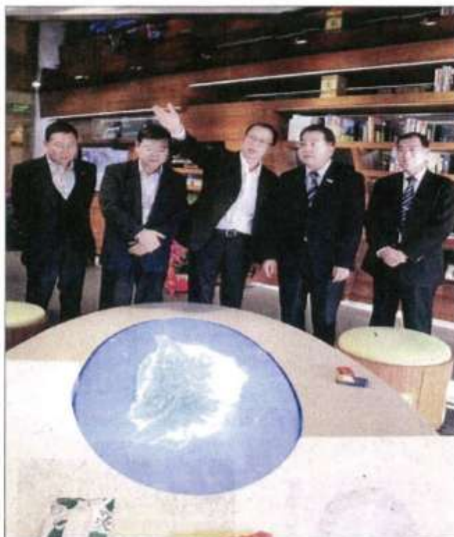
▲交通部觀光局長謝謂君（右2）昨日在上海台旅會辦事分處主任李燕斌（中）引領下參觀上海辦事分處。