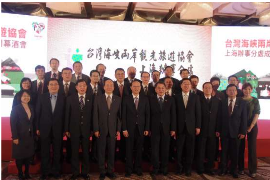
海旅會邵會長蒞臨上海辦事分處揭牌暨酒會活動