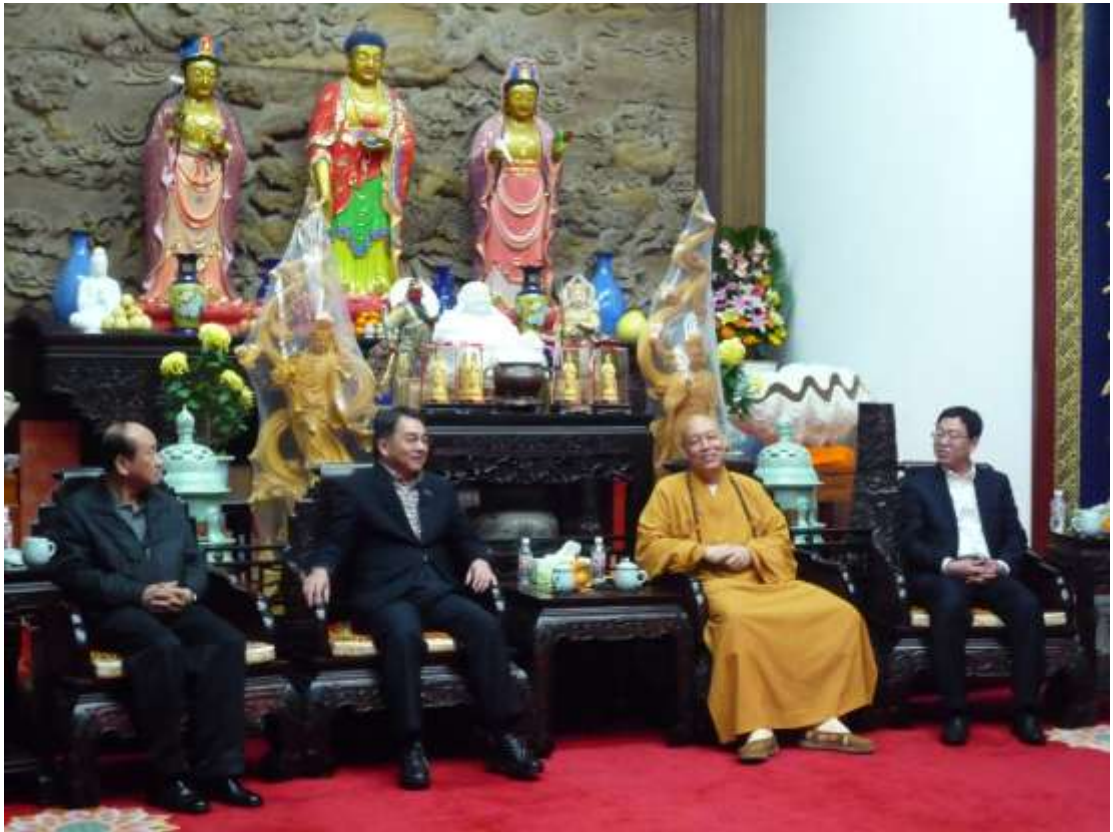
參訪普陀寺佛教觀光考察交流