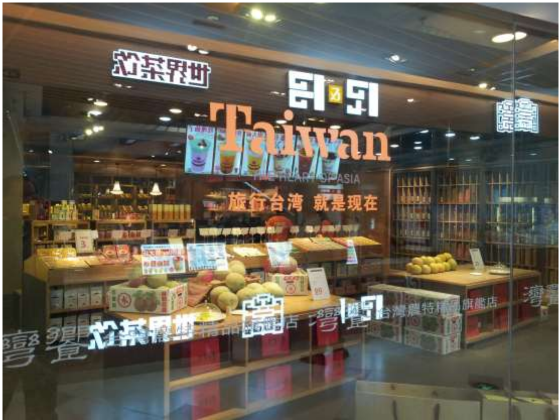
「灣饗」臺灣農產品專賣店