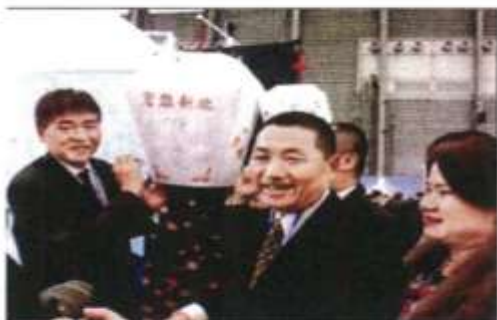
▲2012中國國際旅遊交易會昨日在上海開幕。新北市副市長侯友宜（右2）到「美麗新北」攤位為天燈護宇，吸引不少民眾與熱心遊事家。

在個人遊方面，上海去年赴台旅遊自由行人數約8000人，今年到目前已達1.7萬人次，較去年同期倍增。台灣觀光業者指出，過去團客較受制於旅行社，由於開放自由行，陸客較能隨心所欲地深入遊台灣，也才能真正加惠民間民宿、小吃美食與其他縣市地方區域。