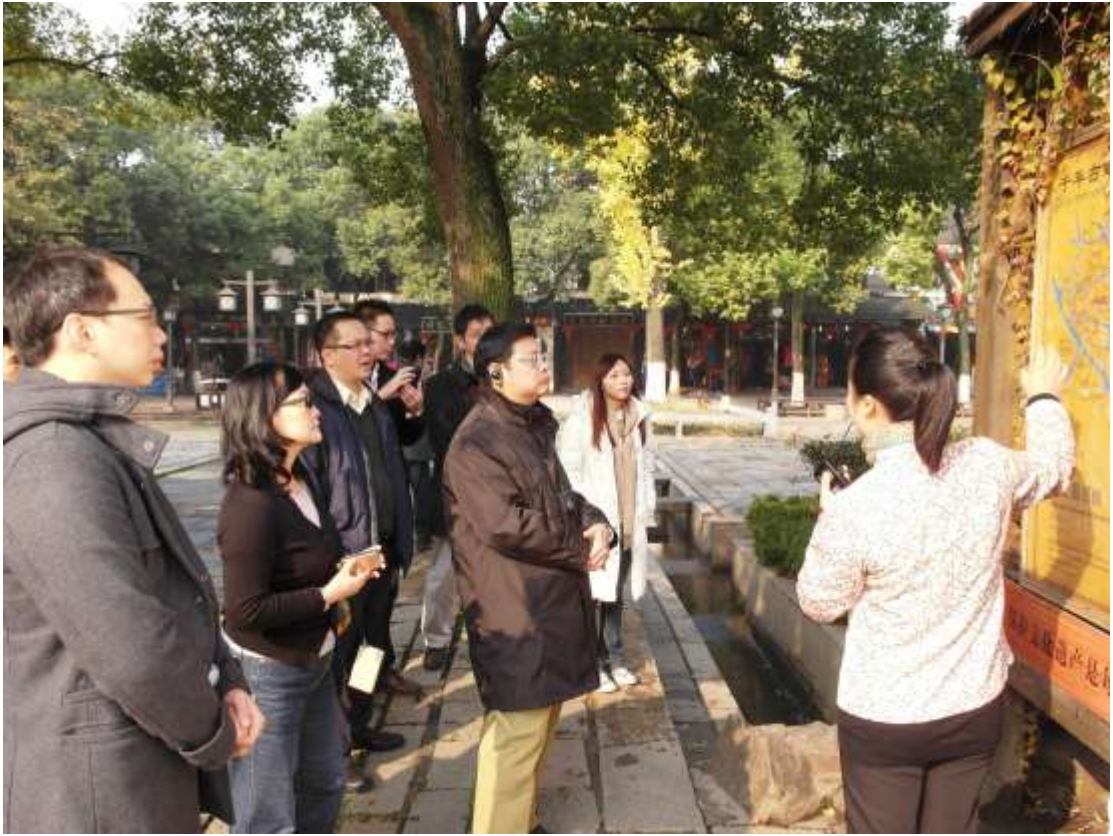
江蘇省旅遊協會同里古鎮考察交流