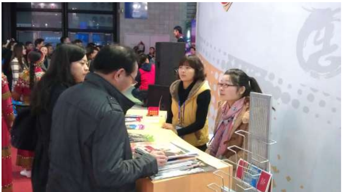
台灣館參觀詢問人潮