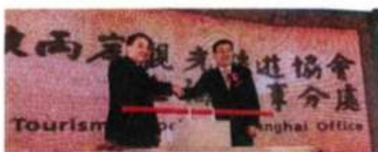
●交通部觀光局局長謝謂君（左）與海旅會執行會長杜江昨日共同為台旅會上海辦事處揭牌。

謝謂君表示，近年兩岸觀光交流大幅邁進，不僅雙向旅客人次數成長，觀光相關產業也活力大開。陸客來台除了團體遊，個人遊的城市也增加到13處，比例正逐步提高。因大陸地廣人多，為