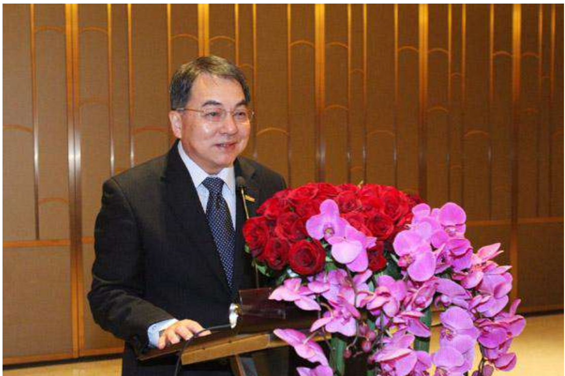
謝局長於上海辦事分處揭幕晚會上致詞