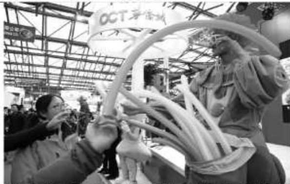
2012 中国国际旅游交易会现场热闹非凡，人头涌动。

商报记者 楼丽娜 尽管全球经济低迷，然而，昨天开幕的 2012 中国国际旅游交易会现场却是另一番景象，现场热闹非凡，人头攒动。商报记者从采访中了解到，众多国内外旅游目的地各出奇招，推出自己的新产品和新线路，招揽客源，旅游市场的火爆程度不容小觑。