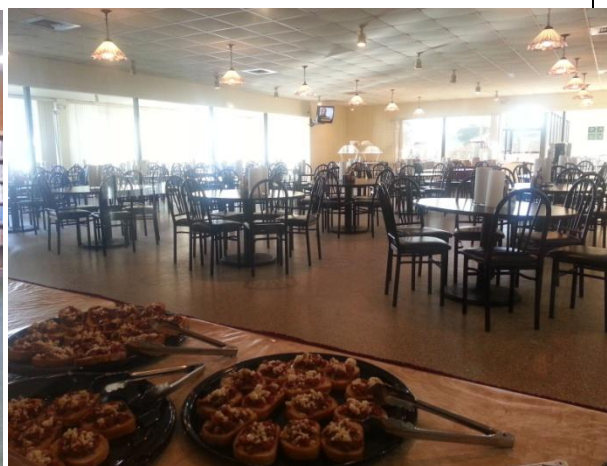
參觀美國韋伯國際大學校園環境、學校宿舍及教學設備