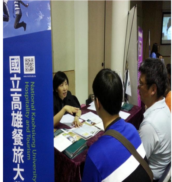
家長及學生詢問申請本校入學管道、學校特色及課程介紹