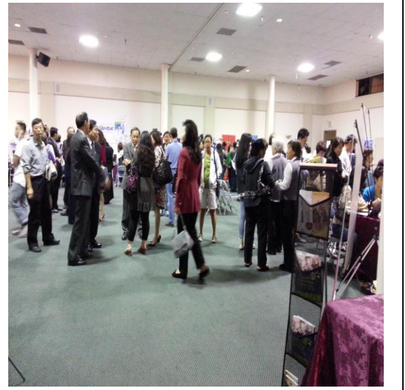
三、2012 鮭魚返鄉計畫第一屆臺灣教育展本校參展攤位及活動照片