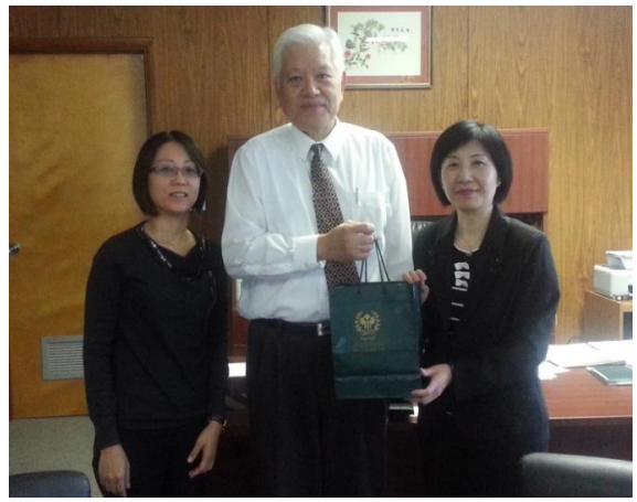
拜會美國韋伯國際大學校長及副校長