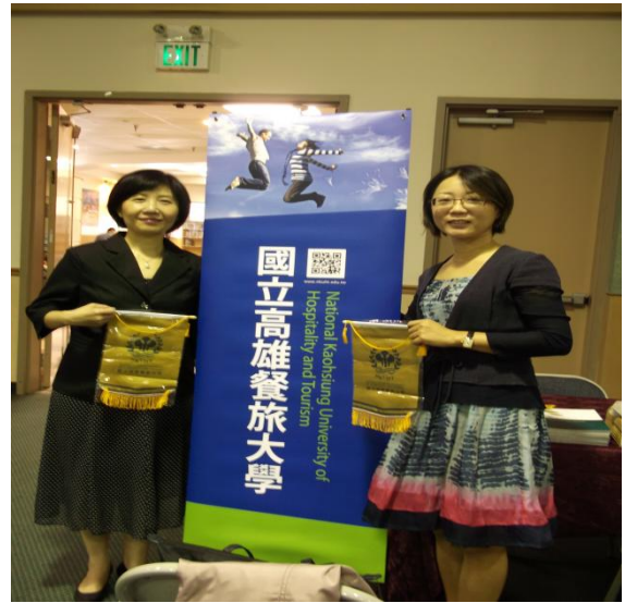
教育展本校參展工作人員合影