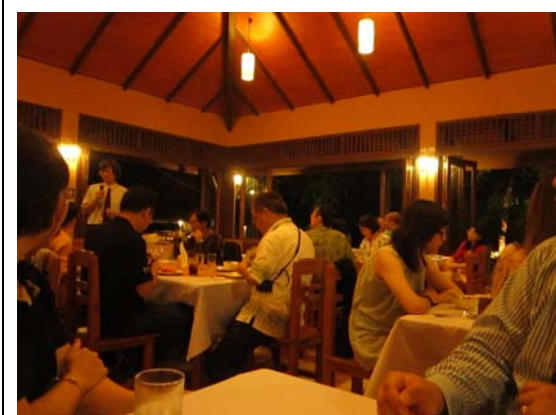
11月7日泰北清萊皇太后大學 Resort 餐廳晚宴，據該校資訊管理系教授說明，該系與企業合作辦理競賽，提供獎金鼓勵學生創新