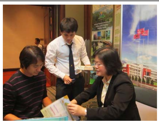
本校賴副處長(右)向參訪民眾介紹本校，由泰國當地大學工讀生協助翻譯