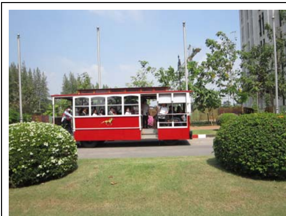
易三倉大學校內接駁車接送學生