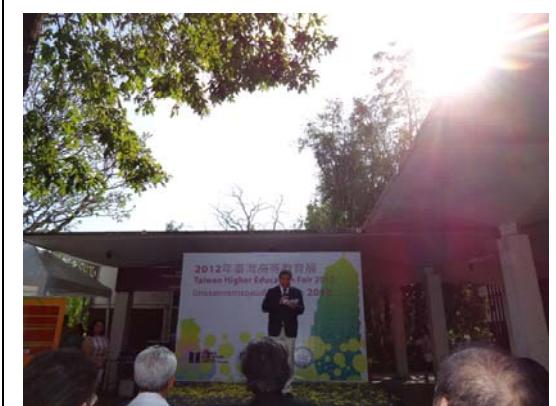
清邁大學副校長於教育展開幕式致詞