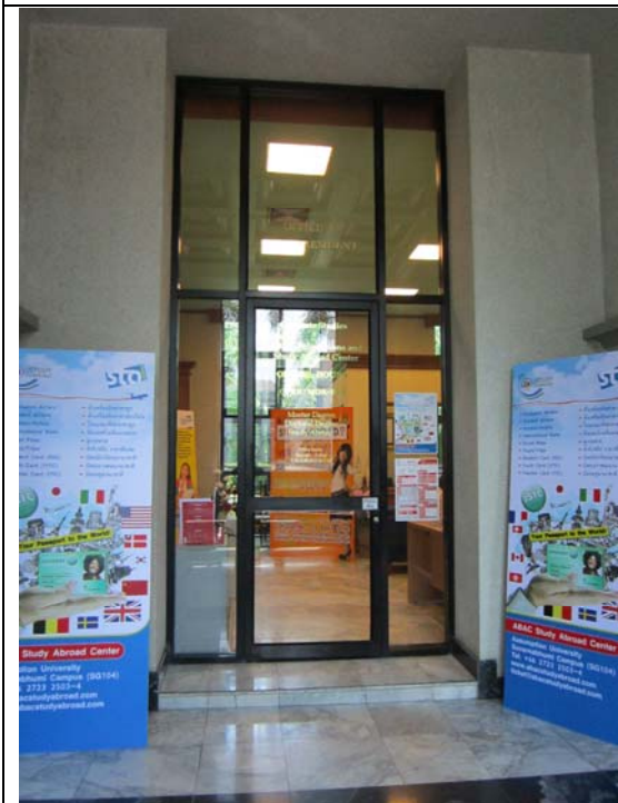
易三倉大學留學中心