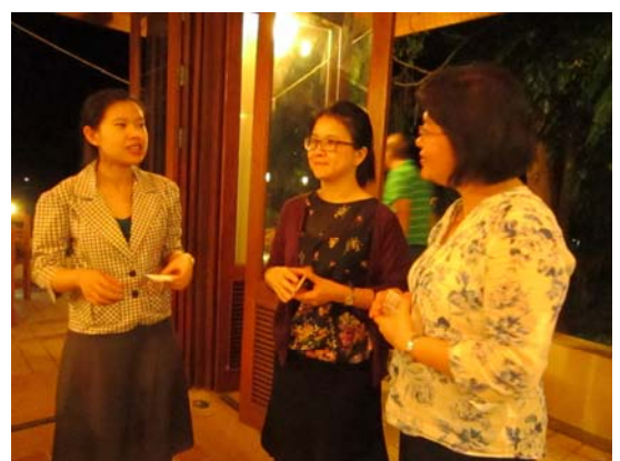
清萊皇太后大學晚宴賴副處長與該校教師互動交流