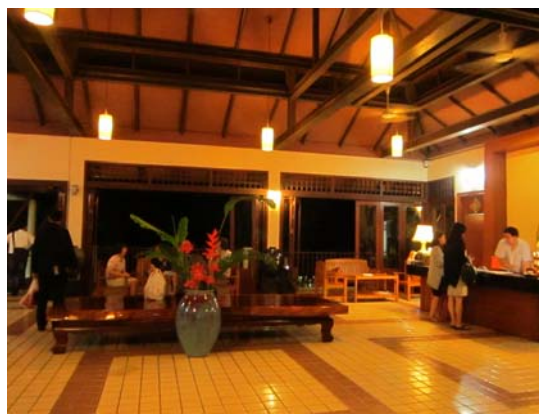
皇太后大學 Resort 大廳，實習學生可逐一體驗熟悉接待 Check in、Check out、供餐等程序