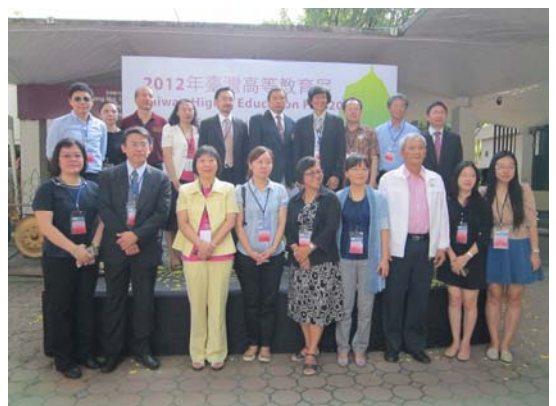
清邁大學教育展參展學校代表合影