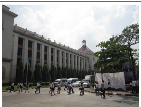
易三倉大學下課時間校園一隅