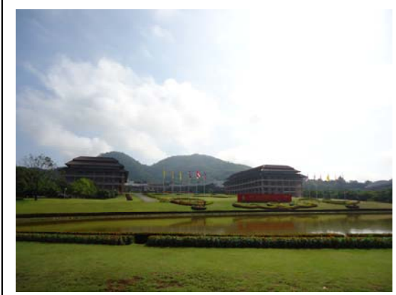
清萊皇太后大學校景，該校幅員廣闊，校園內有接駁公車接送學生