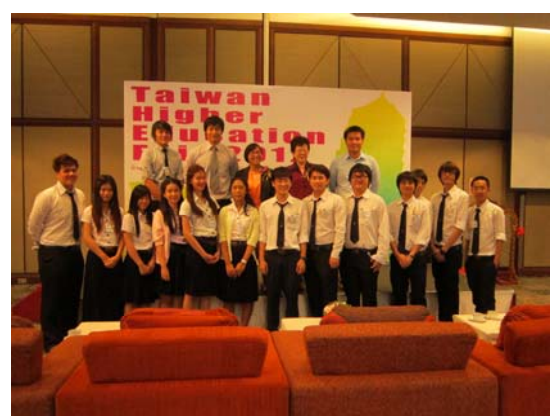
泰國臺灣教育中心成員與泰國工讀生