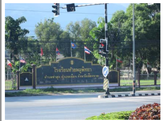
皇太后大學入口(右方)，該校位處郊區，校園包含平地及山區，各類設施一應俱全，有餐廳、咖啡廳、便利商店、書店等等