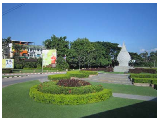
皇太后大學入口(左方)