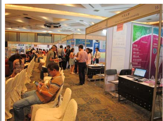
曼谷教育展會場部分攤位場景