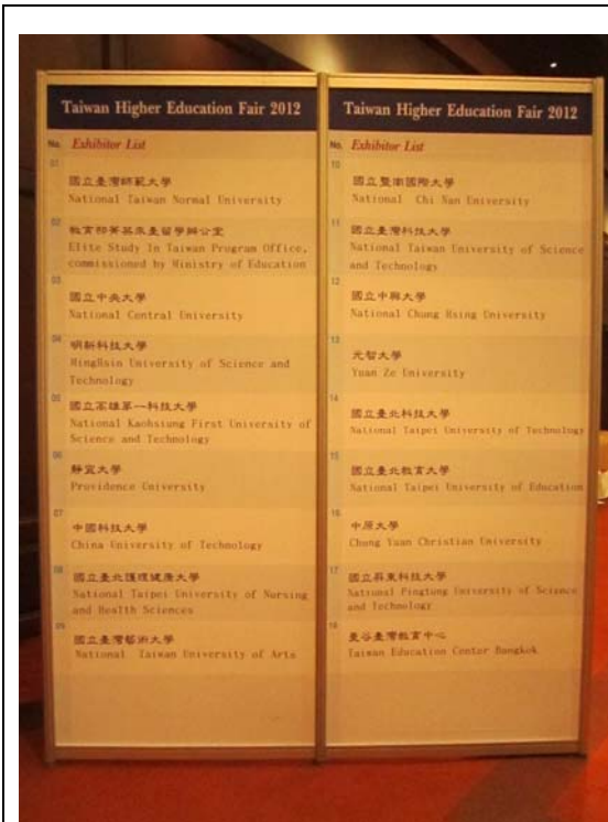
曼谷教育展設有參展學校表展示架