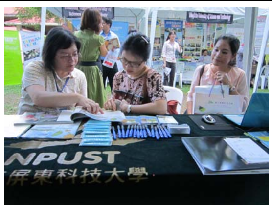
賴副處長(左)於皇太后大學教育展向來訪教師介紹本校系所