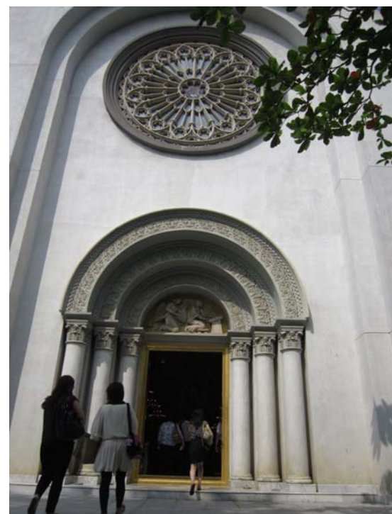
易三倉大學教堂，該校融合西方基督教與泰國佛教精神，辦理全英語教育，旨在培育一流國際人才，該校有來自約 86 國學生