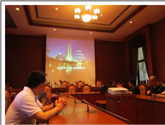
易三倉大學國際事務處接待臺灣學校代表，播放介紹影片(中、泰、英語)