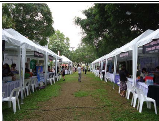
皇太后大學教育展會場