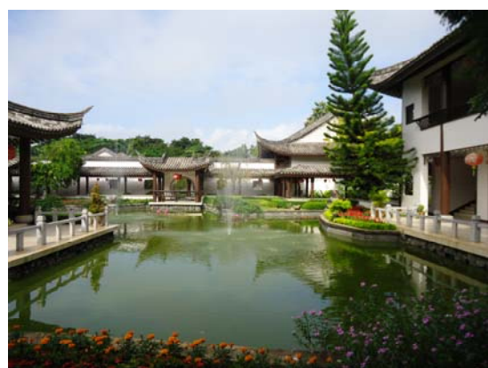
皇太后大學孔子學院內部，古色古香的庭園運用情境式環境教學，使學生融入中華文化氛圍