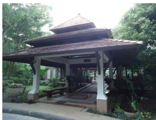
皇太后大學 Resort 提供外賓休憩、用餐，內部還有游泳池、涼亭、SPA 室，多元化設施值得借鏡，是餐旅系學生絕佳的實習場所