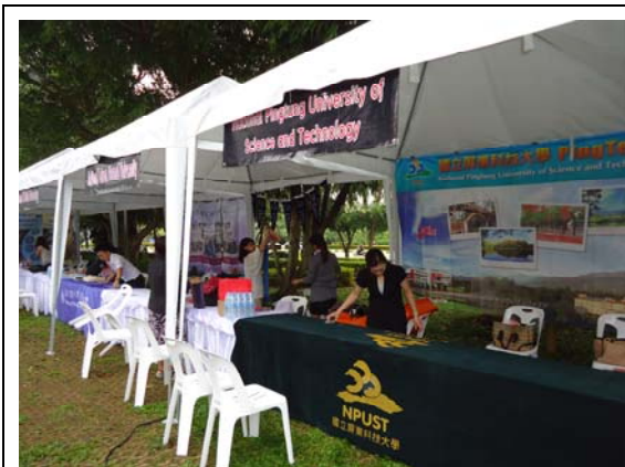
工作人員正在布置皇太后大學教育展會場