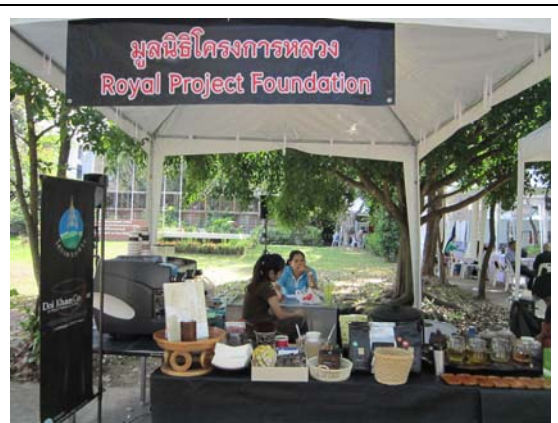
泰國皇家計畫於清邁教育展會場設攤展示計畫成果