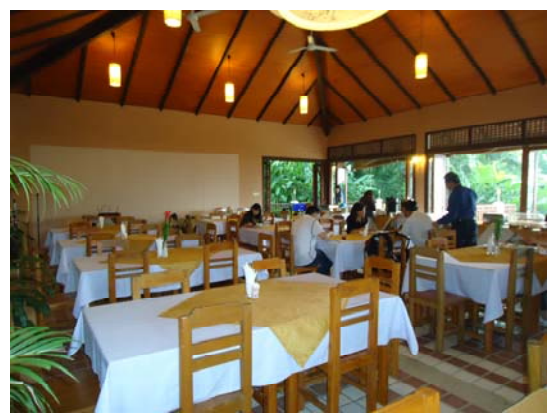
皇太后大學 Resort 餐廳提供早餐，可作為本校未來迎賓館服務的參考