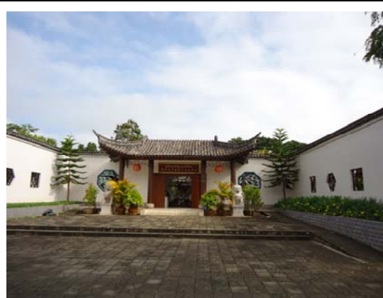
皇太后大學孔子學院入口