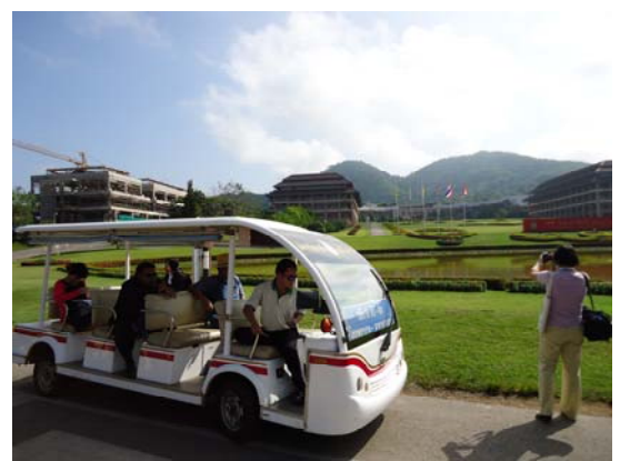
皇太后大學校園參訪用接駁車，可以做為本校未來規劃校園參訪參考