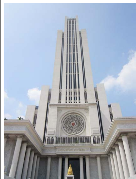
易三倉大學圖書館