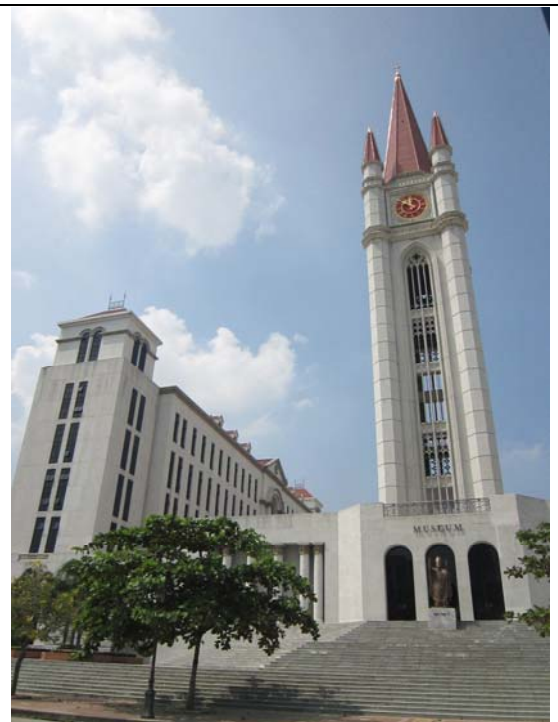
易三倉大學博物館