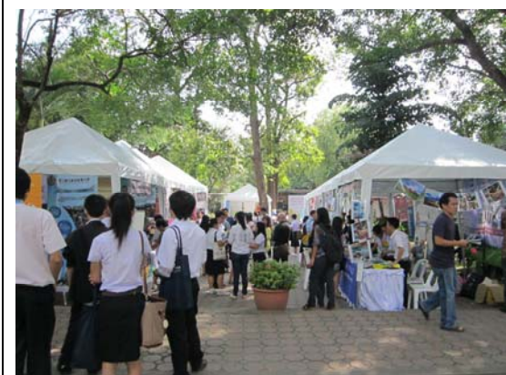
清邁教育展學生下課後到展場參觀，因學院分布較分散且下課時間有限，除鄰近學院學生以外，較少其他學院學生有機會到會場