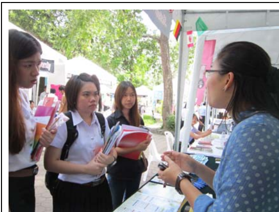
本校博士班畢業校友肯佳納小姐向清邁大學學生介紹學校