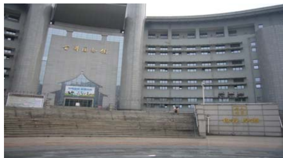
圖 18 北京首都圖書館 (2)