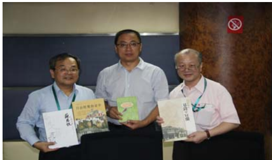
圖 9 參訪中國版本圖書館