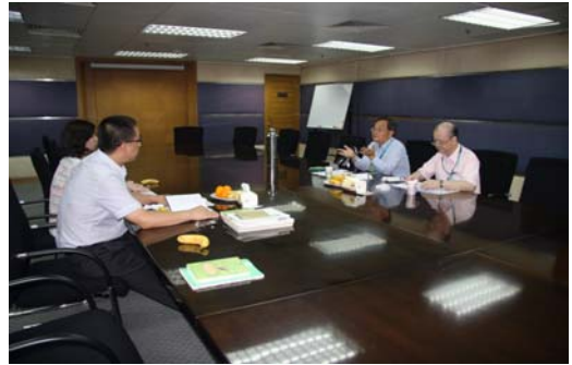
圖 10 ISBN 編碼問題座談會