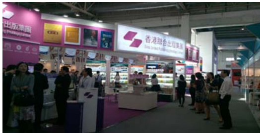
圖 2 圖書博覽會場：香港攤位