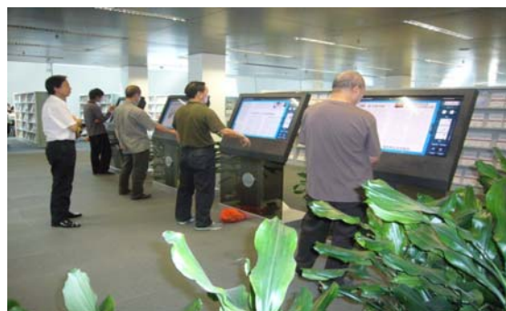
圖 16 北京國家圖書館數字閱讀區