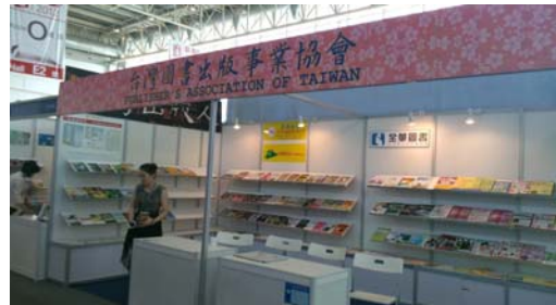
圖 5 圖書博覽會場：臺灣攤位