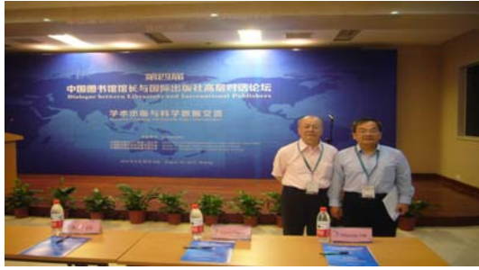
圖 7 參加出版論壇學術研討會