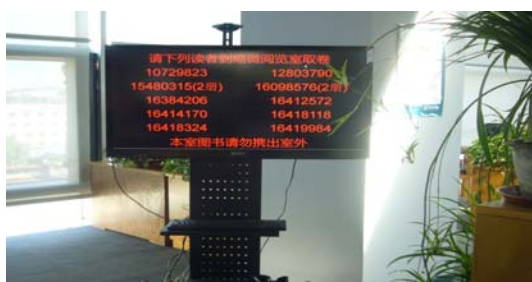
圖 14 北京國家圖書館調閱顯示機