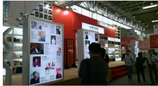
圖 4 圖書博覽會場：中國攤位