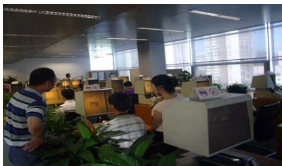
圖 15 北京國家圖書館縮微閱覽室