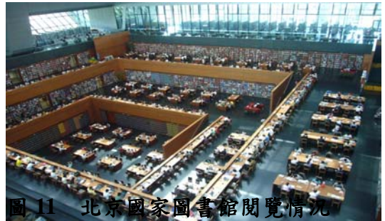
圖 11 北京國家圖書館閱覽情況