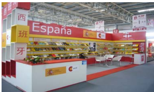
圖 3 圖書博覽會場：西班牙攤位