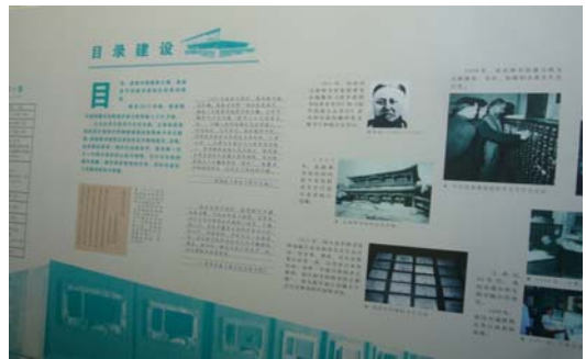
圖 12 北京國家圖書館百年展