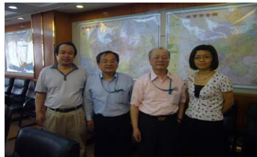
圖 6 圖書博覽會與臺參展人員合影