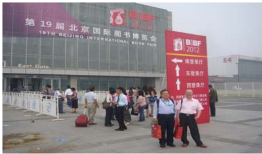
圖 1 第 19 屆北北京國際圖書博覽會