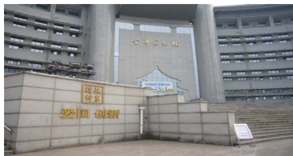
圖 17 北京首都圖書館 (1)