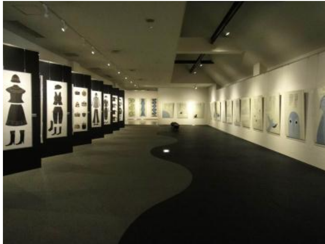
圖 7 毛巾美術館以毛巾呈現畫作並布置如藝廊