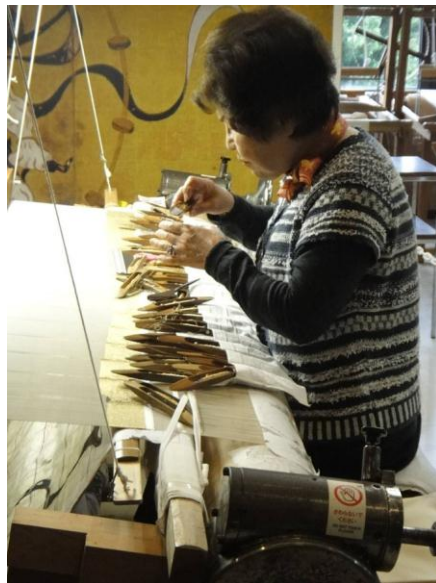
圖 12 西陣織會館資深工匠示範織布機操作