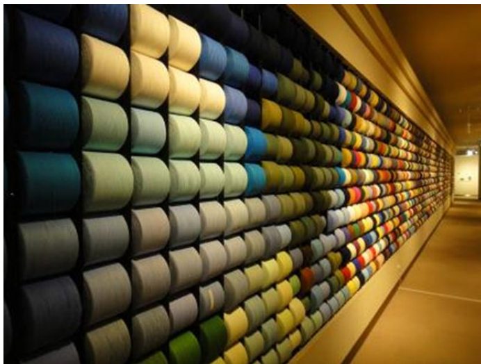
圖 8 毛巾美術館之色紗牆