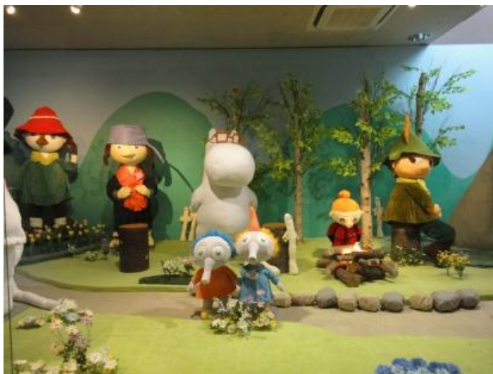
圖 9 以毛巾為素材布置的姆明家族場景