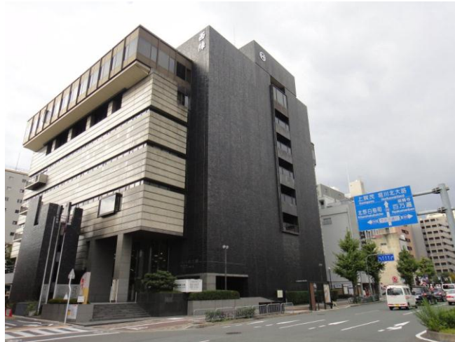
圖 10 西陣織會館外觀