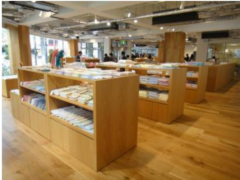
圖 1 今治毛巾本店展售場地