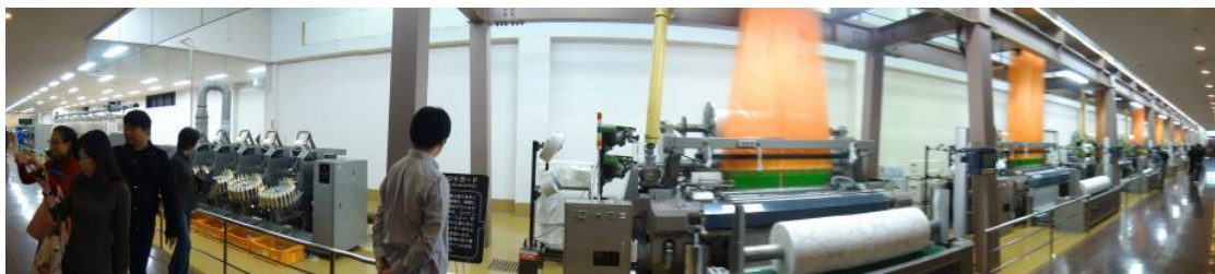
圖 5 毛巾美術館之毛巾生產實境廊道