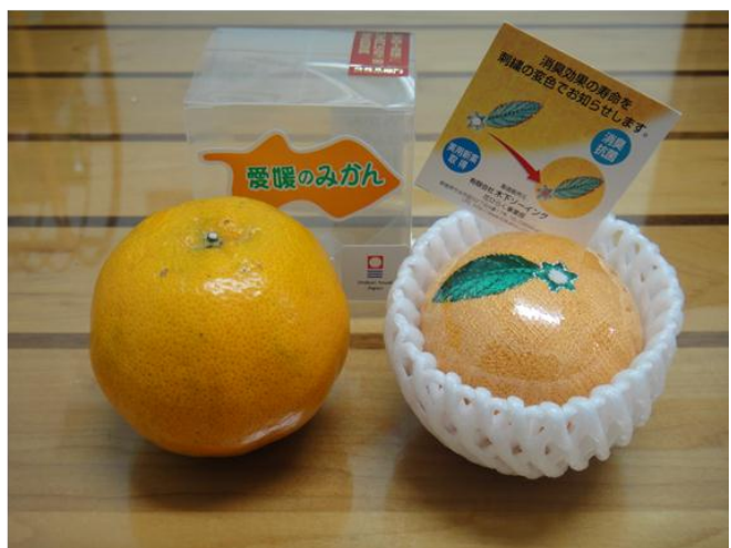
圖 3 散發果香並具保濕美容功效的毛巾(左)，可作為面膜使用；以愛媛縣特產「蜜柑」為造型之毛巾(右)