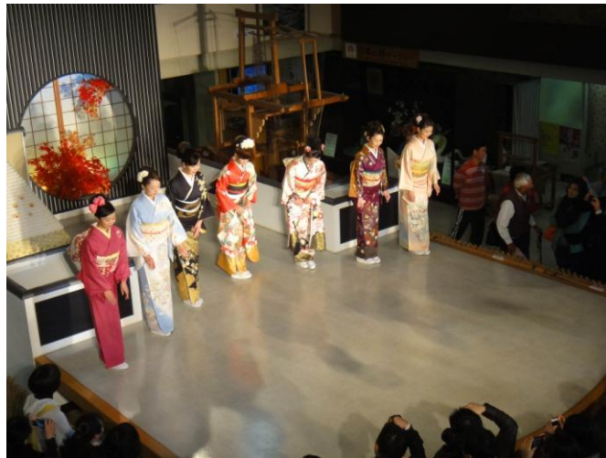
圖 11 西陣織會館內之和服走秀