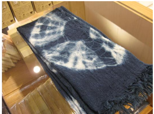
圖 2 今治毛巾本店利用織紋/色調變化傳達視覺美感之毛巾產品