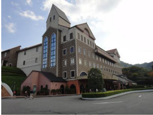
圖 4 毛巾美術館之外觀