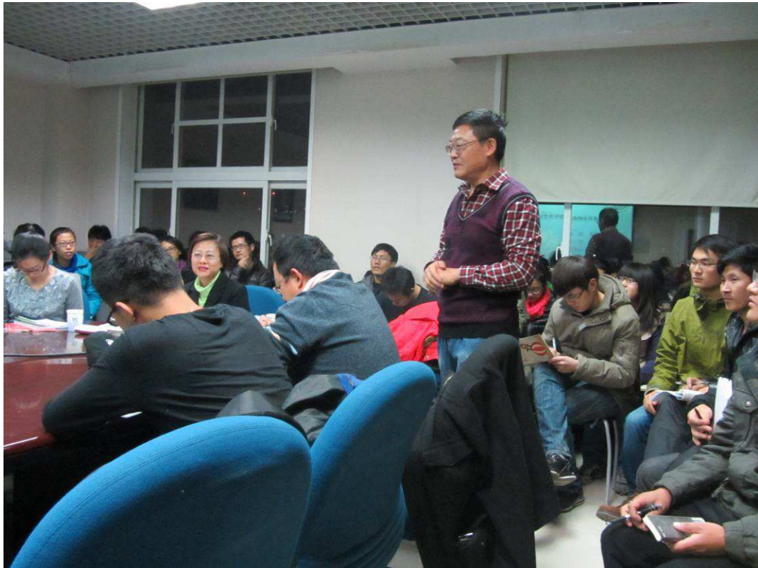
照片 1 第一場演講