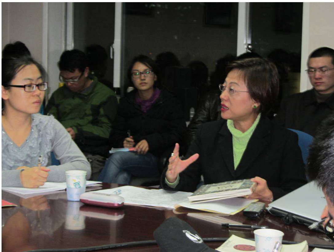
照片 2 第一場演講