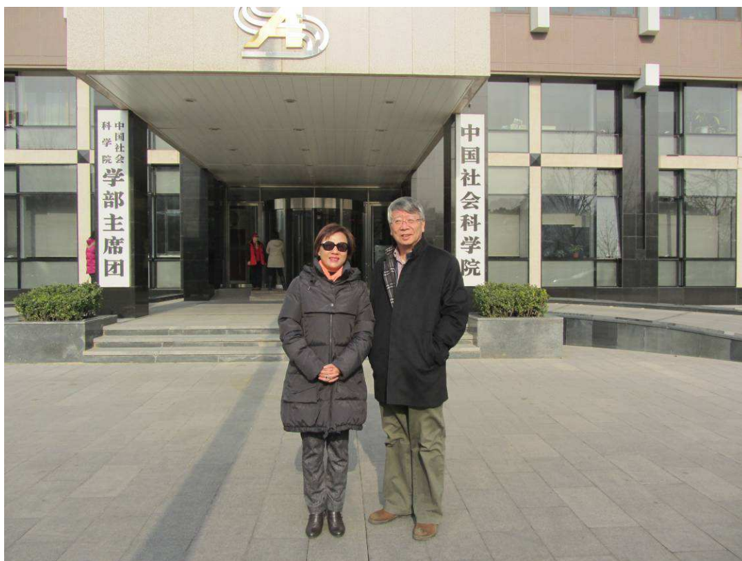
照片 5 拜會中國社會科學院副秘書長郝時遠教授