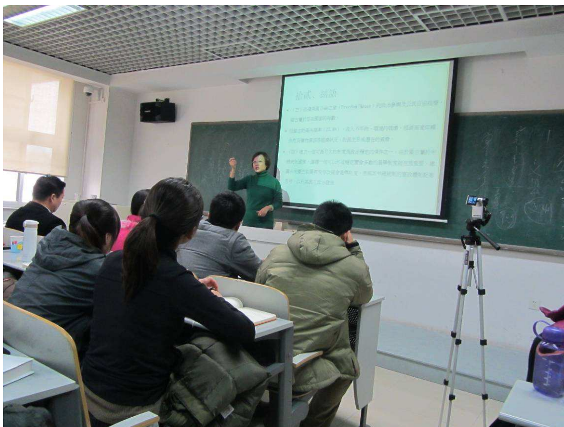
照片 3 第二場演講