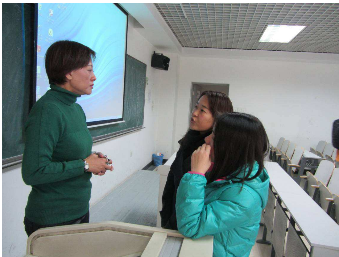
照片 4 第二場演講