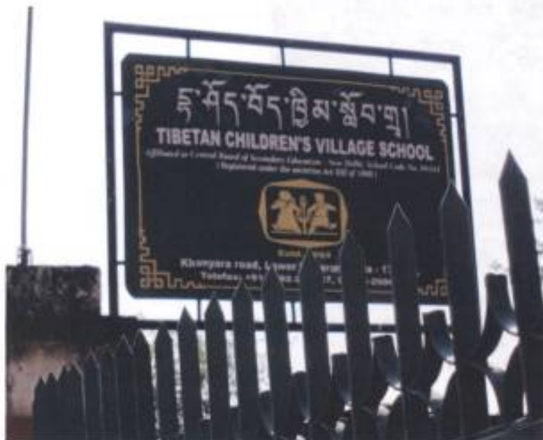
13. 下達蘭薩拉西藏兒童村學校