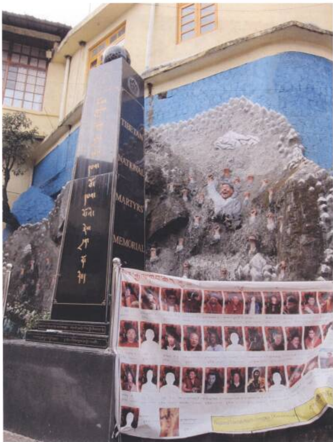
7.為藏區自焚犧牲者立紀念石碑