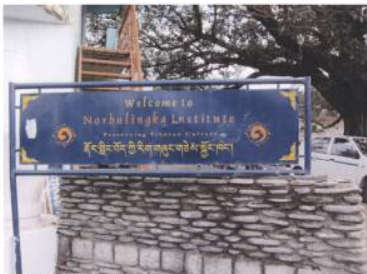
15.諾布林卡藝術研究中心