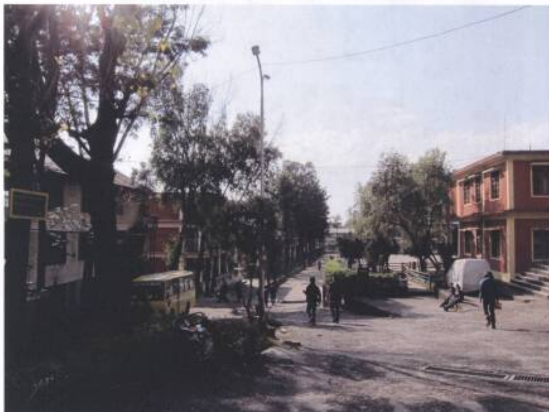
14. 西藏兒童村學校校園