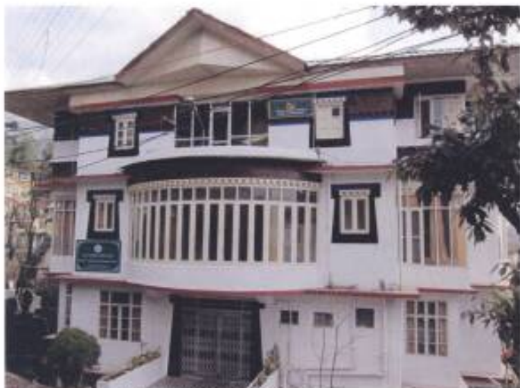
10. 外交暨新聞部辦公室