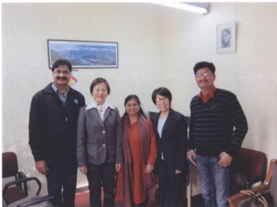
1. 尼赫魯大學國際問題研究學院研究蒙古及西藏議題學者