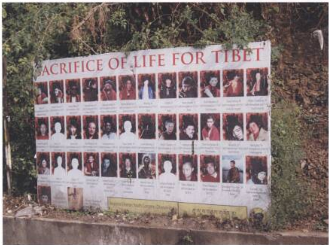
6. 麥克羅干吉市中心張貼大陸藏區自焚者肖像