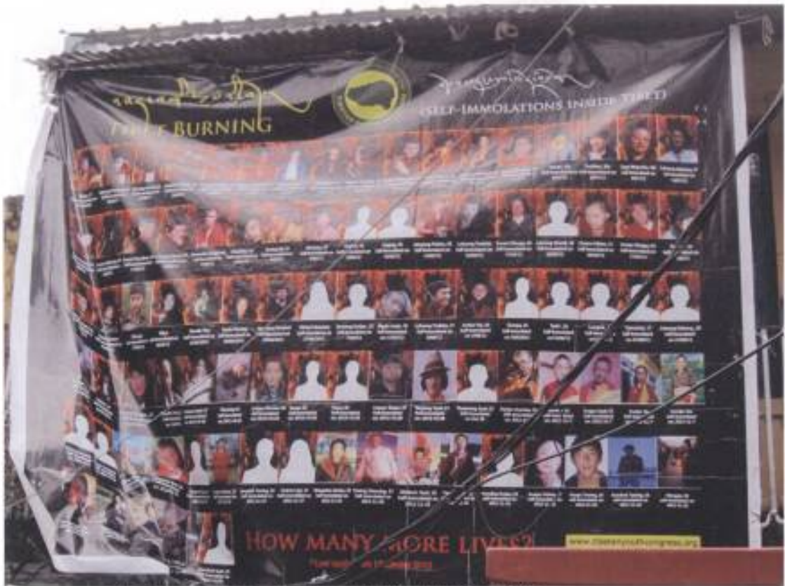
5. 麥克羅干吉市中心張貼大陸藏區自焚者肖像