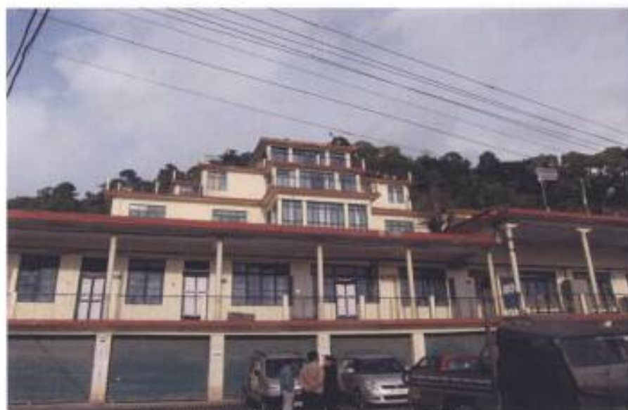
12. 噶廈各行政部門及西藏流亡議會等