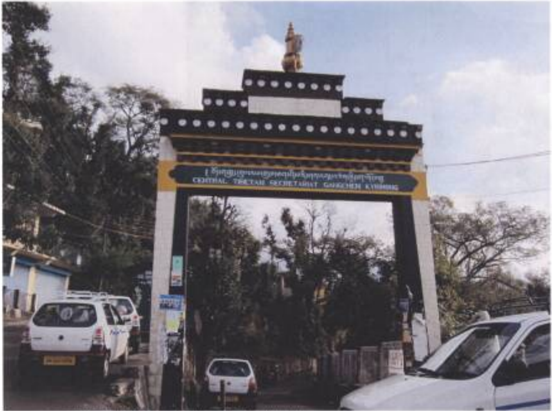
8. 西藏流亡組織行政中心「崗堅吉雄」