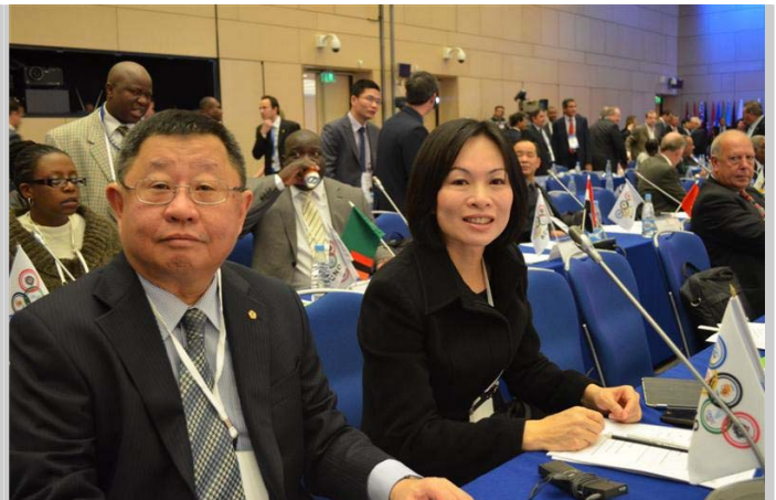
戴遐齡主委與中華奧會蔡辰威主席於會場。