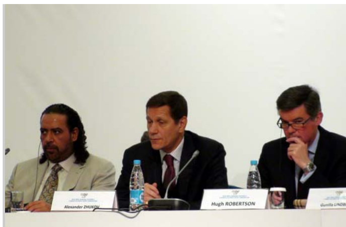
亞奧會主席兼 ANOC 會長 Sheikh Ahmad、俄國體育部長 Alexander Zhukov 及英國體育部長 Hugh Robertson