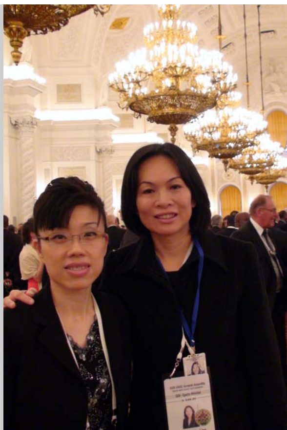
戴主委與駐俄羅斯代表處陳組長於克里姆林宮。