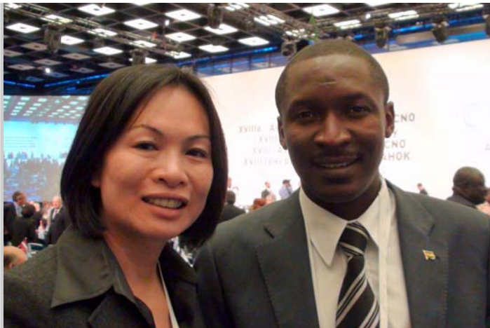
戴主委與我友邦聖多美普林西比官員代表。