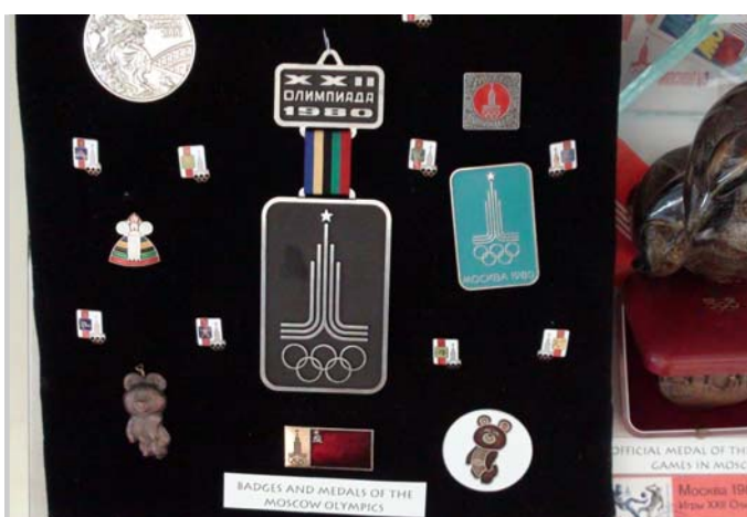
會場展示 1980 年莫斯科夏季奧運相關文物。

月 16 至 4 月 17 日為期 1 天半，假俄羅斯首都莫斯科召開。「世界奧林匹克運動大會」邁入第 2 屆，各國代表出席相當踴躍，全球國家奧會代表及各國體育最高主管機關代表齊聚一堂，（本屆共有世界 170 國體育部長與會）已躍升為國際體育運動發展與交流之重要平臺，對國際體育交流及提升我國國際能見度均有相當助益，本會戴主任委員遐齡首度以部長身分出席會議。