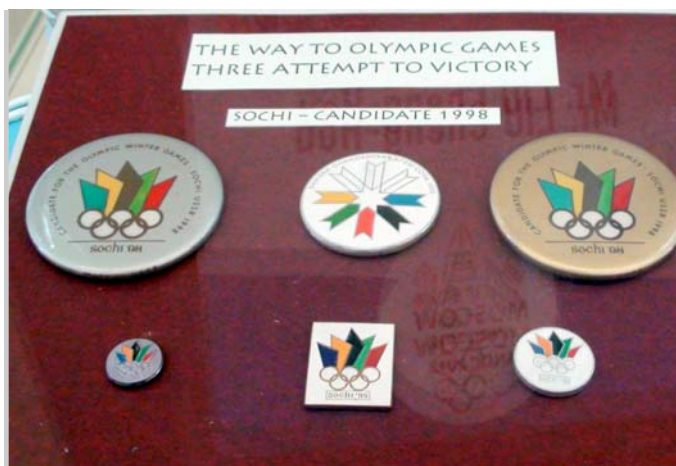
會場展示索契申辦冬季奧運相關文物。