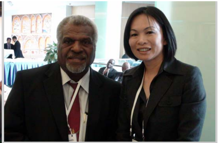
戴主委與萬那杜共和國官員代表。