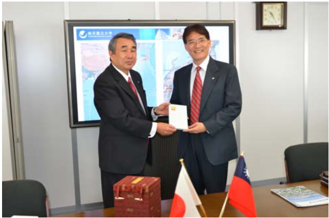
兩校校長互贈紀念品