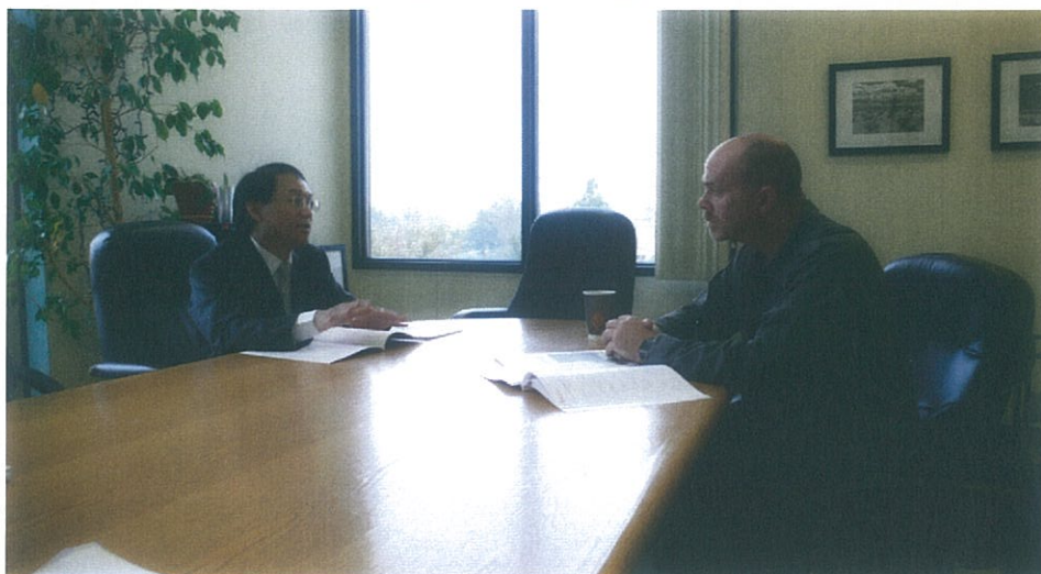
圖4、郭校長與自然人科學院物理系主任討論雙方碩士班合作事宜

11月28日上午首先於9:30-10:30拜會科學及數學學院，由該副院長及物理系主任接待，雙方就兩校理學院，尤其是物理系1+1碩士雙學位之可能合作事宜進行洽談及意見交流，並就後續實質推動雙聯學位之可行性達成共識。