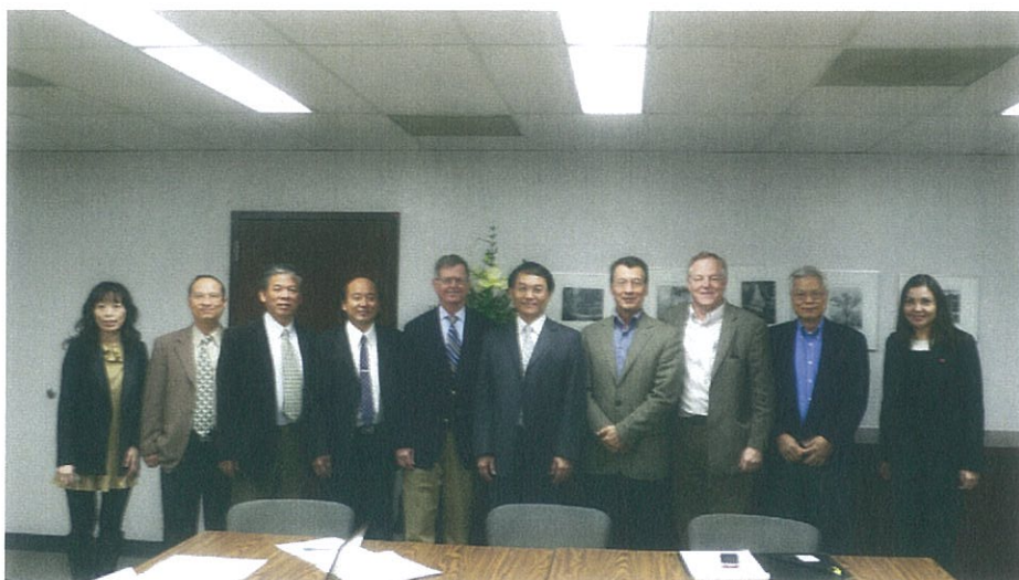
圖5、本校代表團成員與克瑞格商學院(Craig School of Business)與會人員合影