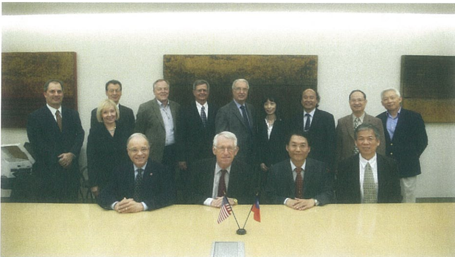
圖 3、本校與 CSU Fresno 分校參與簽約儀式人員合影