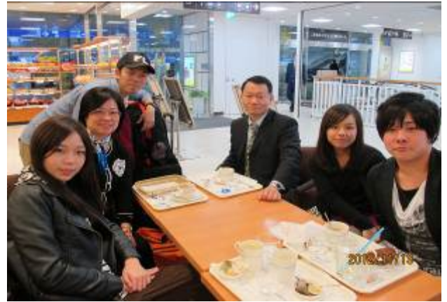
九州國際大學交換生師生聯誼