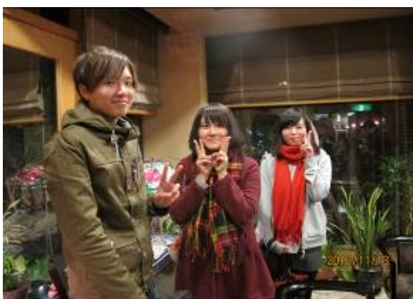
山口大學經濟學部交換留學3位同學