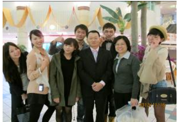
師長到來同學們相當興奮