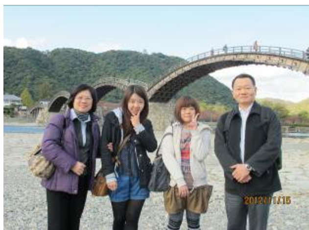
村瀨先生招待與德山大學交換留學同學至觀光勝地岩國出遊