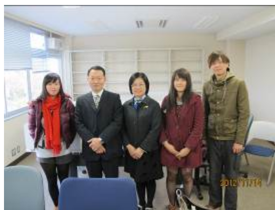
與山口大學交換留學3位同學聚餐

(3) 此行最令人感佩的是姊妹校德山大學，雖是一個全校只有 1500 名左右小規模的大學，而留學生人數就達 230 名之多，占整體的 20%。不僅如此，在照顧留學生的事上也很用心。特別是留學生支援室的村瀨秀輝先生，不僅積極招募海外學生，也經常帶領留學生體驗日本各類文化及節慶活動。且與齊藤由里惠副教授一起定期舉辦留學生的演講等各類文藝競賽。且熱心為同學安排住宿和可靠的實習單位藤吉日本料理店，這些足供本校在留學生的照顧上借鏡。學生們在此學習、實習、交友，並接受各類的刺激和洗禮，他們異口同聲說來到德山學習很幸運，很珍惜在日本的生活。