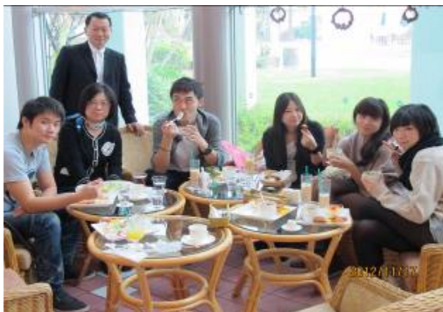
與沖繩實習同學聚餐