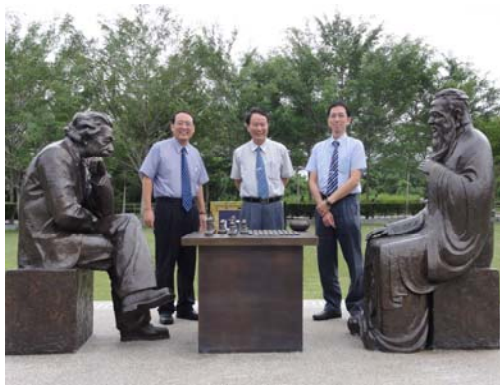
拉曼大學內愛因斯坦與孔子下棋的雕像：象徵東方思想與西方科技之融合