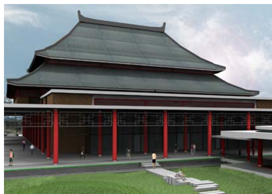
拉曼大學之會議廳