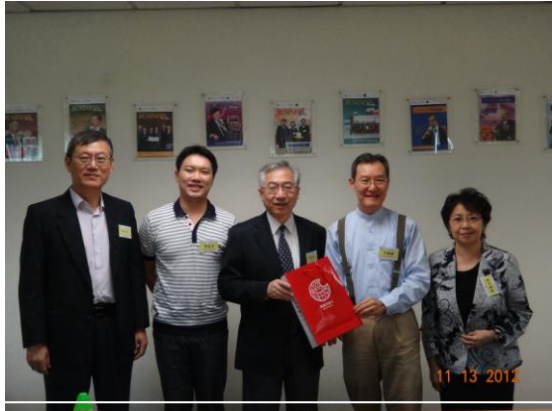
李研發長(右二)和國合組賴組長(左二) 與浸會大學接待人員合影