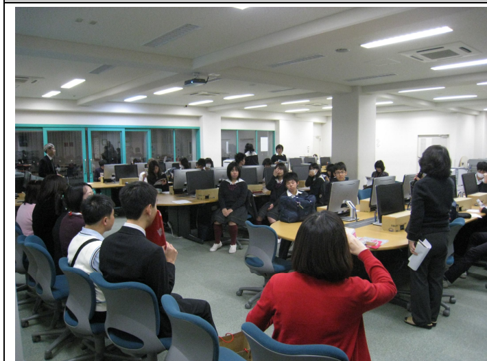
櫻美林高中臺灣留學說明會

櫻美林高中為一私立高中，於中國創校 25 年後因戰爭而回日本重新創校，目前與臺灣高雄師範大學、靜宜大學及東海大學為姐妹校。此說明會為抵達日本後第一場說明會，對象為已開始學習華語的高中生為主（高一及高二），此場次的同學雖然為高中生，但由於已開始接觸華語文，再加上媒體及曾經臺灣對於日本的援助下，對於臺灣已有些許認識，因此整場說明會下來，在問與答部分顯得十分熱絡，除了與學校各代表互動頻繁外，也會主動提出問題，希望能獲得更進一步的了解。