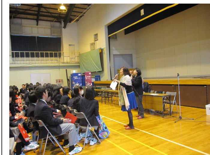
城西高中臺灣留學說明會

城西高中為日本城西大學附屬中學，全校僅一千多名學生，為一小型中學，於美國、澳洲、韓國及中國共有 5 所姊妹學校，此次學校安排高一學生來參加說明會，主要是因為先讓高一學生對臺灣高等教育有初步的認識，如有興趣爾後再慢慢規劃自己未來的方向，因此對於教育方面學生仍不清楚該問甚麼樣的問題，但關於文化部分學生則有高度的興趣，因此在互動間，學生也對於文化這部分也顯得比較熱絡。