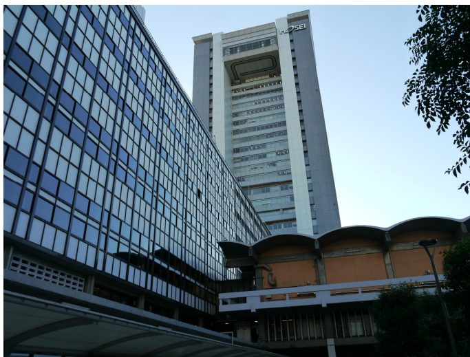
參訪法政大學市谷校區