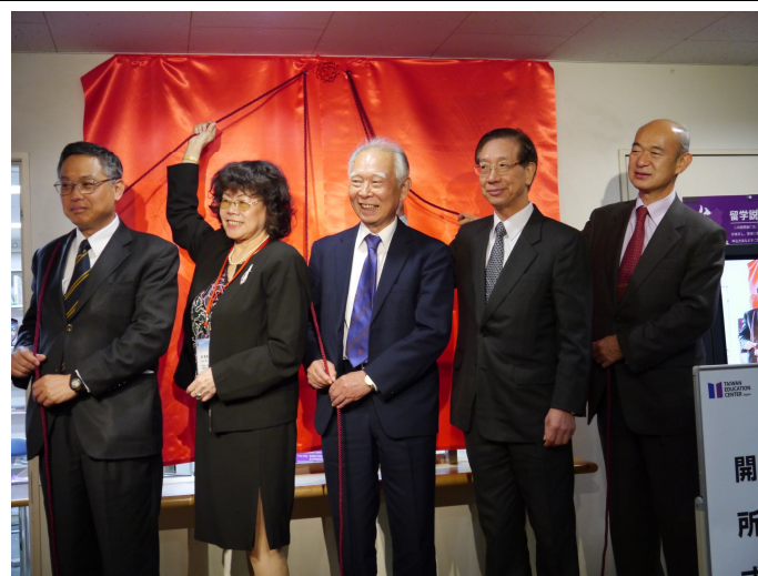
臺灣教育中心揭幕式

這場臺灣教育中心儀式當中邀請了法政大學總長、臺灣財團法人高等教育國際合作基金會執行長以及其他臺灣及日本代表長官共同揭幕，而在紀念祝賀會場除了法政大學校內長官和相關同仁，還有日本留學機構 JAFSA 和 JASSO 代表出席外，更邀請曾經留學臺灣的日籍人士以及僑界人士到場參加，整個晚會現場如同小型國際交流會，除了與會者對於臺灣高等教育的肯定外，僑界人士更是大力讚賞臺灣高等教育的推動，日本臺灣教育中心成立的開幕紀念祝賀會可堪稱是圓滿成功。