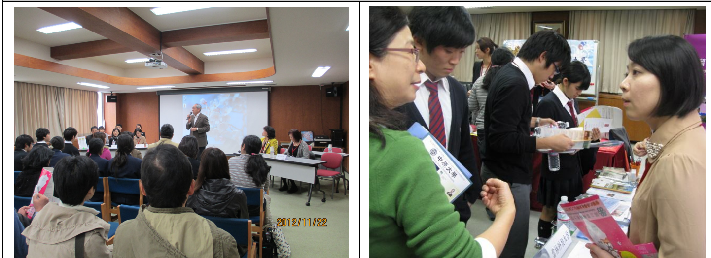
中華學校臺灣留學說明會

這一場的說明會主要對象為僑生，在進行簡報說明的過程可以直接用中文來表達，因此也更好發揮宣傳的效果，無障礙的溝通讓整場說明會顯得更豐富。而說明會結束後於現場有大約一個小時的擺攤時間，開放給來參加的家長及同學直接面對面諮詢，藉此機會深入宣傳學校優點並加以介紹各學院。