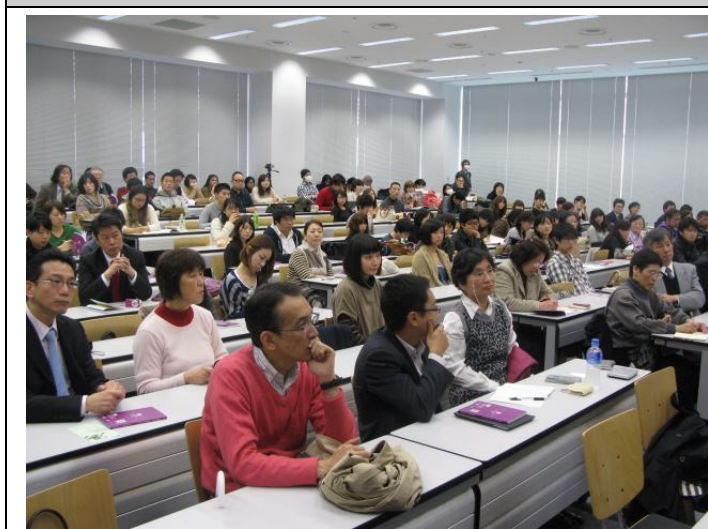
法政大學臺灣留學說明會

法政大學說明會為此次說明會中較大型的一場，法政大學的國際部門也出動來支援此活動，名古屋產業大學的校長及該校臺灣籍教授亦到場協助台灣高等教育的推廣，此說明會來參加的對象除了該校學生外，亦有想進一步了解臺灣教育的家長，同樣的也於說明會結束後擺攤進行面對面諮詢，在擺攤過程中偶遇一兩名已會說華語的學生，對於自己未來的目標已非常明確，並已開始鎖定臺灣學校做為未來申請學位的目標，另外也不乏一些想到臺灣學習華語的學生及社會人士，其他則仍多為尚在瞭解及摸索階段的家長來替自己小孩蒐集資訊。