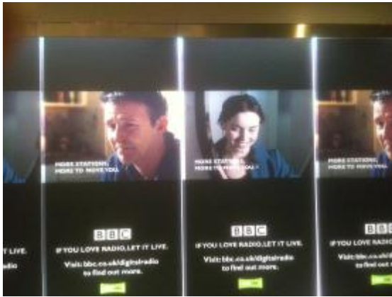
攝自英國廣播公司大樓錄音室迴廊，各頻道的看版介紹廣告