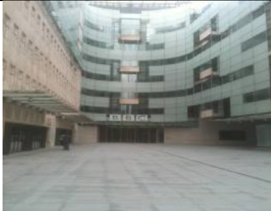
英國廣播公司廣播製作大廈(Broadcasting House)外觀