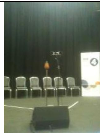
英國廣播公司 Radio Theatre(電台劇場)主席台