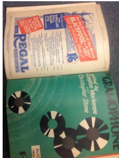
1932 年的 The Gramophone (留聲機雜誌)，也由英國廣播公司節目檔案中心暨大英圖書館聲音檔案中心收藏。