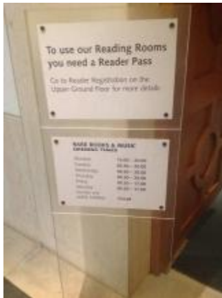
英國廣播公司節目檔案中心暨大英圖書館聲音檔案中心(British Library Sound Archive) (稀有資料區)