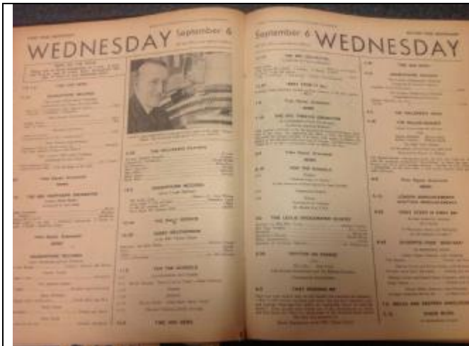
上下： 1930 年代英國廣播公司發行的電台雜誌 (Radio Times) 節目表