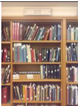
英國廣播公司節目檔案中心暨大英圖書館聲音檔案中心(British Library Sound Archive)，內收藏諸多英國廣播公司相關歷史文獻(一)