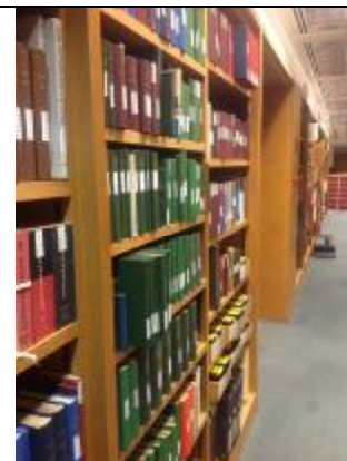
英國廣播公司節目檔案中心暨大英圖書館聲音檔案中心(British Library Sound Archive)，內收藏諸多英國廣播公司相關歷史文獻(二)。