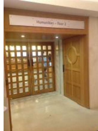
英國廣播公司節目檔案中心暨大英圖書館聲音檔案中心(British Library Sound Archive)門口