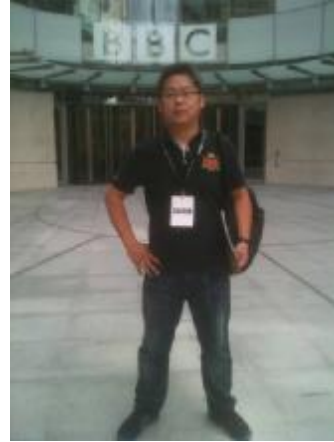
筆者於英國廣播公司廣播製作大廈(Broadcasting House)前留影，請英國廣播公司員工協助拍攝