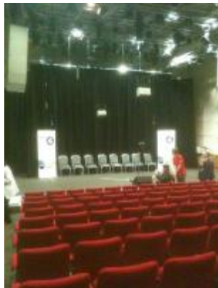
英國廣播公司 Radio Theatre(電台劇場)內部