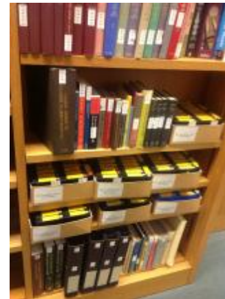
英國廣播公司節目檔案中心暨大英圖書館聲音檔案中心(British Library Sound Archive)節目檔案架。