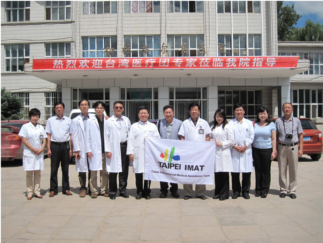
臺灣醫療團診療服務組醫師們，在內蒙古呼和浩特市和林格爾縣人民醫院進行服務。