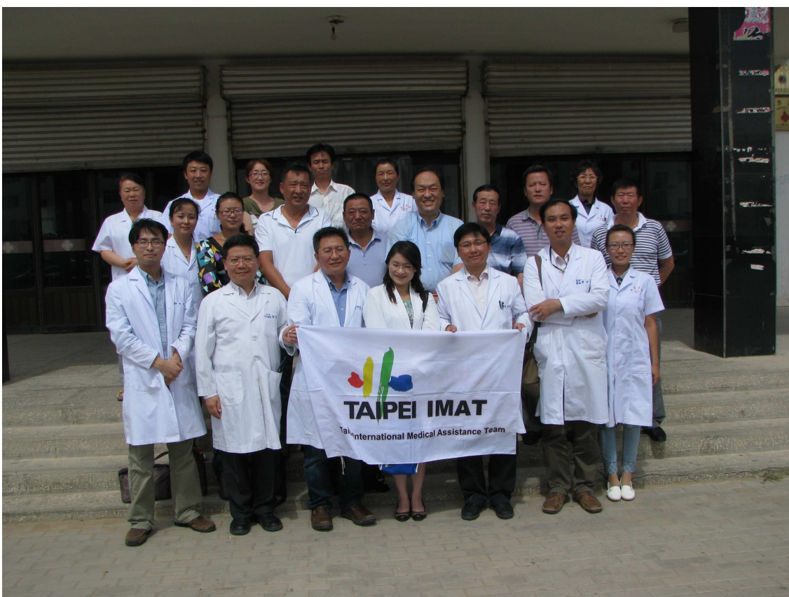
臺灣醫療團診療服務組醫師們，在內蒙古蘇尼特右旗人民醫院進行服務。