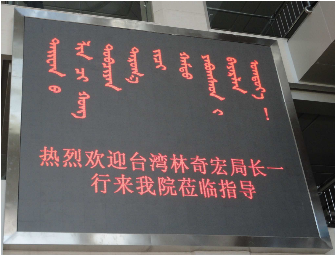
內蒙古國際蒙醫醫院，以蒙、中兩種文字歡迎臺灣醫療團造訪。