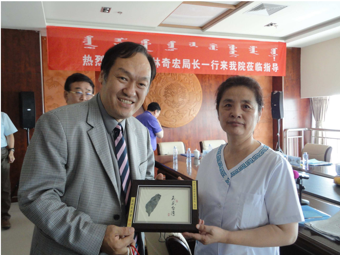
本會蒙事處海中雄處長與內蒙古國際蒙醫醫院交換紀念品。