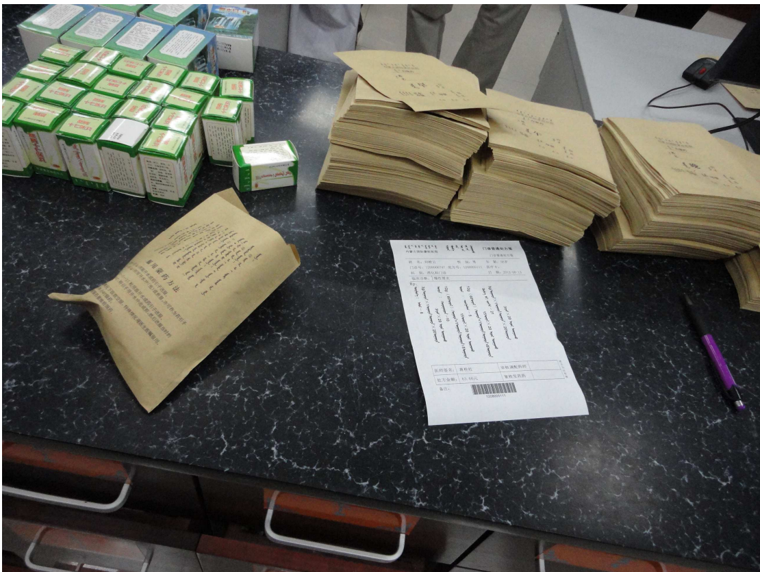
內蒙古國際蒙醫醫院以蒙文書寫的處方籤。