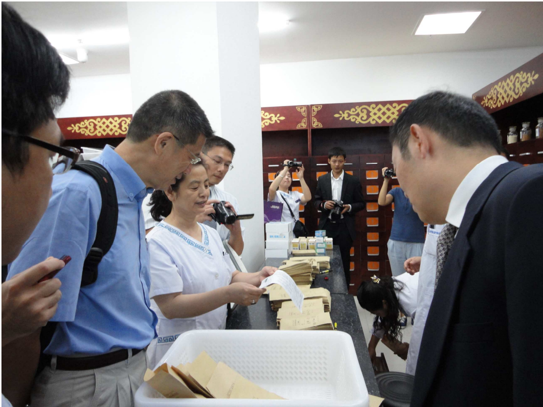
內蒙古國際蒙醫醫院賽西亞副院長為臺灣醫療團說明該院處方籤用蒙文書寫。