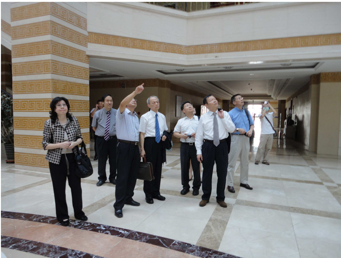
內蒙古醫科大學阿古拉校長向臺灣醫療團介紹該校頗具蒙族特色的圖書館。