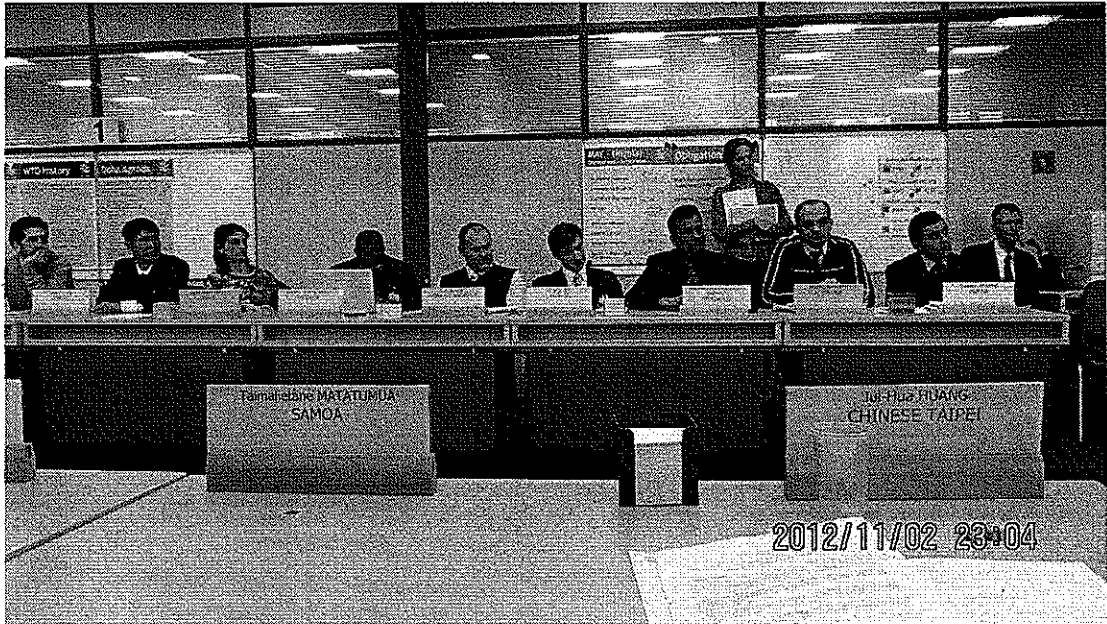
本次課程座位分配按國家英文字母順序