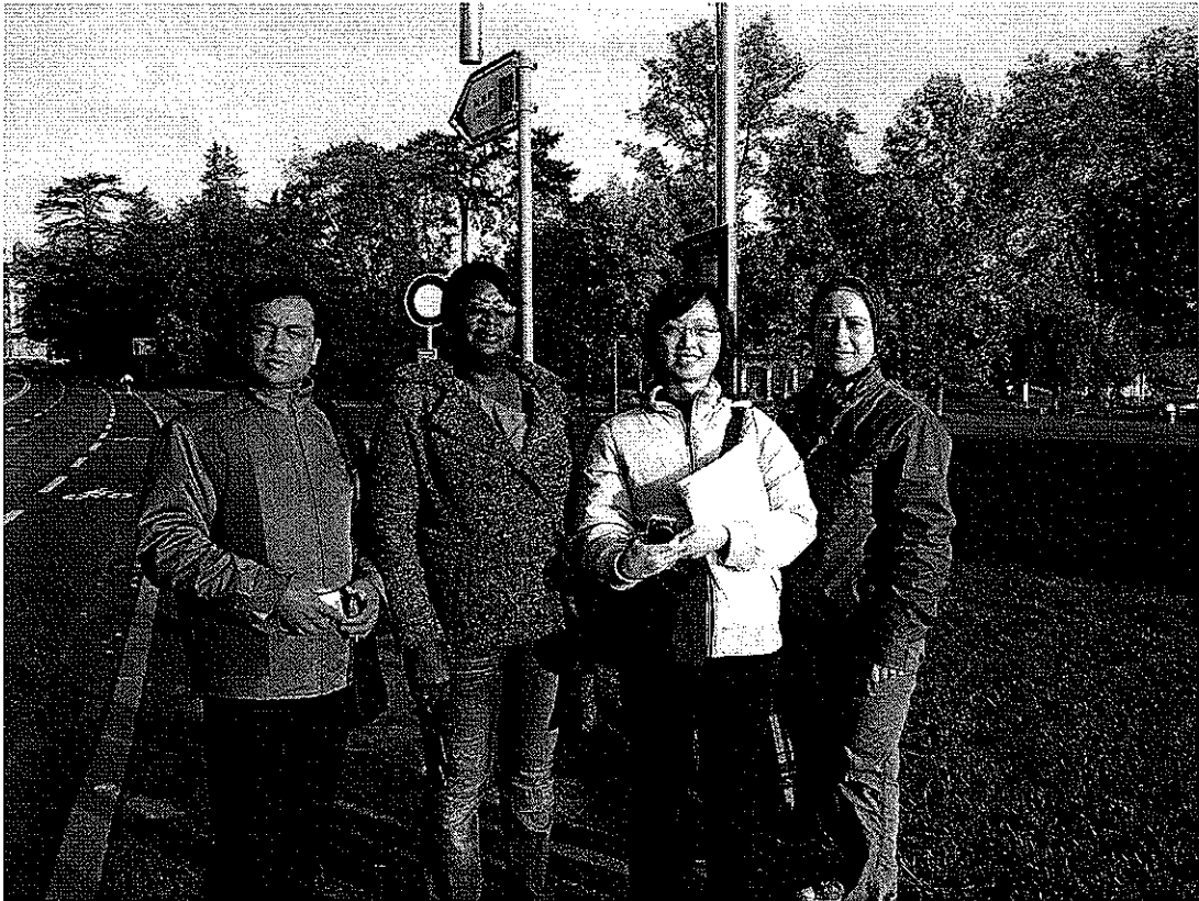
與黎巴嫩(右一)、那米比亞(左二)及孟加拉共和國(左一)代表合影