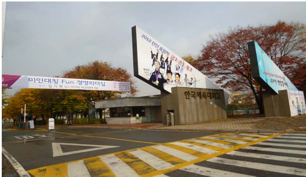
韓國體大校們口看板

(二)倫敦奧運校友及在校生榮獲金牌看板，讓經過的民眾一目了然：校門口製作 2012 年在校大二生榮獲體操跳馬金牌，校友包括羽球等五面金牌，凸顯韓體大角色扮演及重要性。反觀本校倫敦奧運只有一面銅牌作收，值得學習傲警。