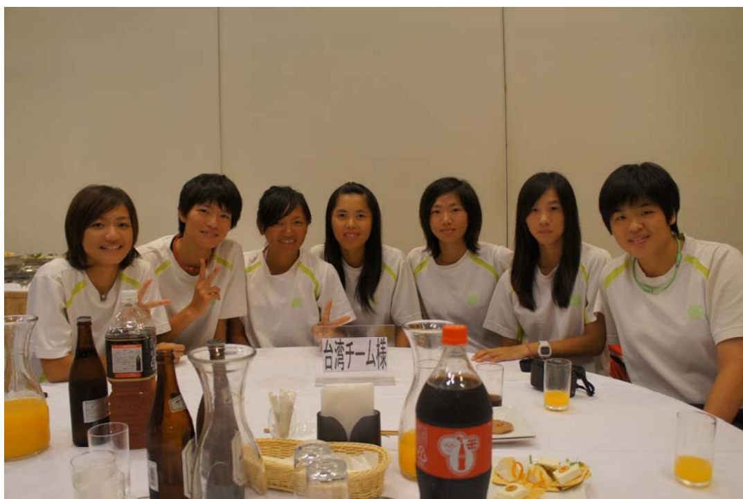
照片二：剛抵達日本的歡迎晚會。