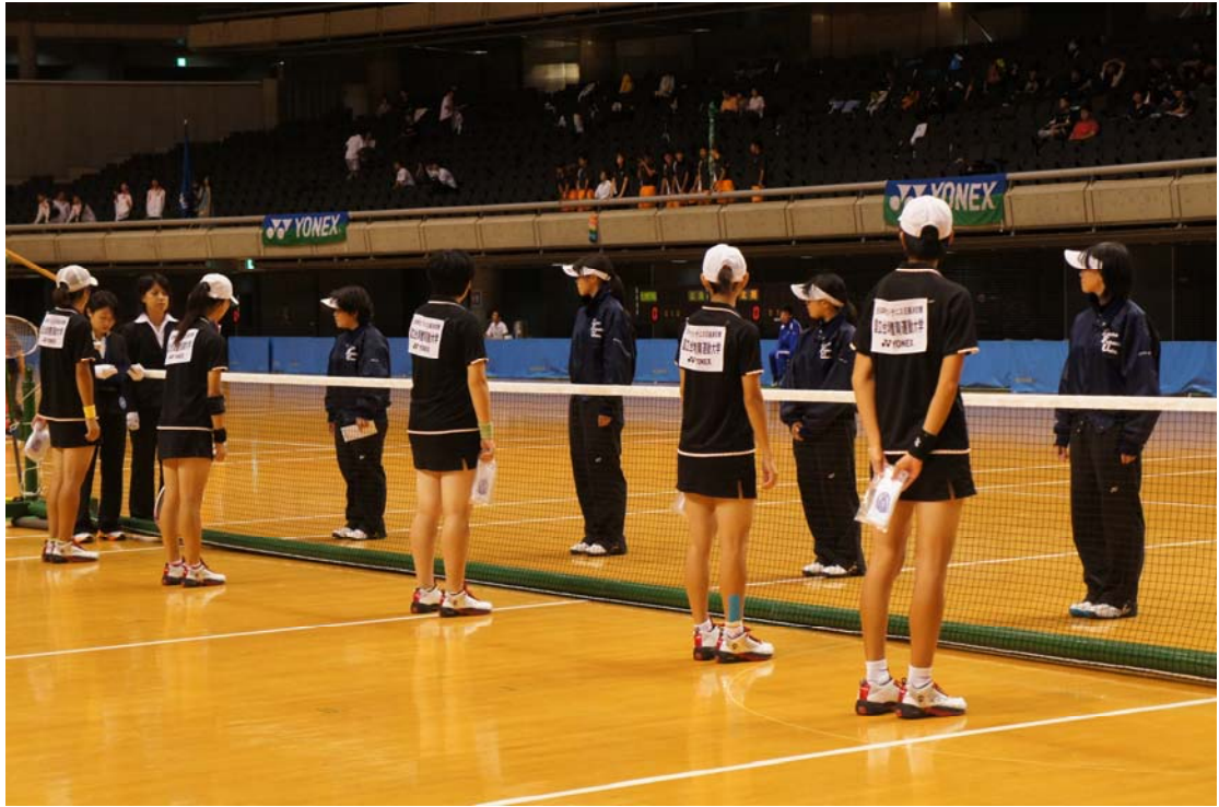
照片五：與東北福祉比賽照片。