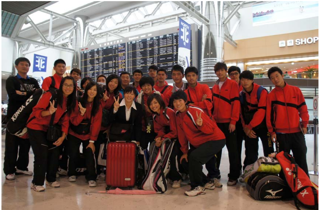
照片六：成田機場準備回國。