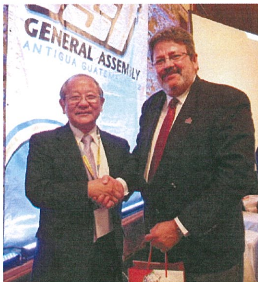
周會長與美洲區副會長會晤