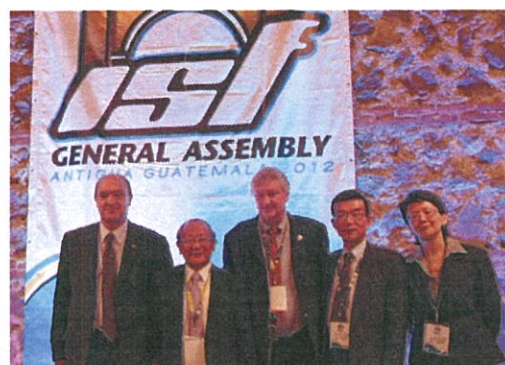
我國代表團與 ISF 會長及秘書長合影