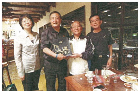
我國代表團與 ISF 會長、秘書長、中國大陸中體協秘書長等人餐敘