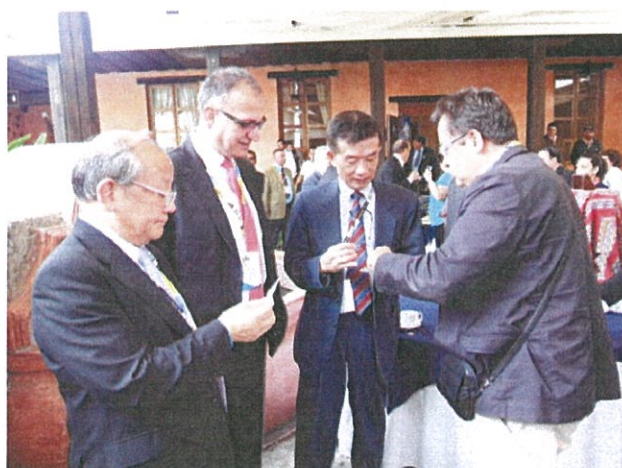
周會長及洪秘書長與其他會員國代表交流