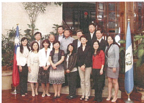
孫大成大使伉儷與代表團及參訪團合影

我國駐瓜地馬拉孫大成大使於6月29日晚間於官邸宴請出席ISF會員大會代表團及國立政治大學南美洲交流團（政治大學吳思華校長率南美洲交流團一行6人當時正在瓜國參訪），席間孫大使詢問兩團與會及參訪情形，並談及我國在瓜地馬拉及中南美洲拓展外交工作情形及心得。