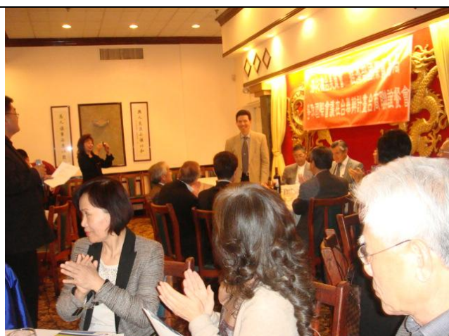
圖 24 參加鼓勵台商回台舉辦企業會議說明會