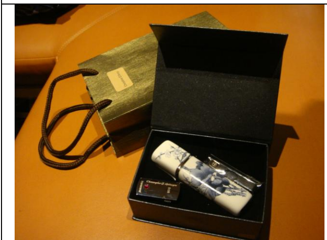
圖 15 於 Extended Board 發送之 Meet Taiwan 貴賓贈品