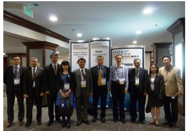
圖 4 爭取團隊與駐外單位及中國代表合影