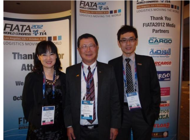
圖 2 爭取計畫與本局代表拜訪 FIATA 會長 Stanley Lim 傳達台灣政府支持之意