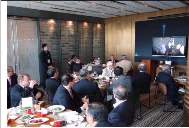
圖 13 遊說活動時播放 MEET TAIWAN 影片