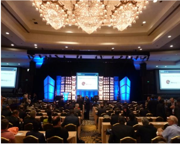
圖 1 FIATA 大會開幕典禮