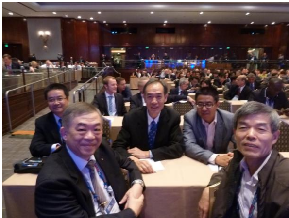
圖 3 FIATA 楊副會長與中國代表開幕式合影