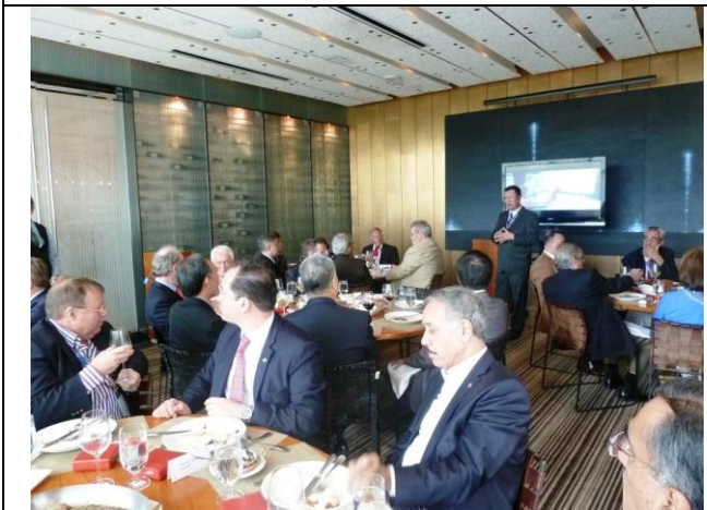
圖 14 FIATA 會長 Stanley Lim 致謝詞