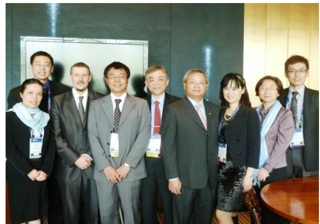
圖 6 爭取團隊於 11 日遊說活動後合影