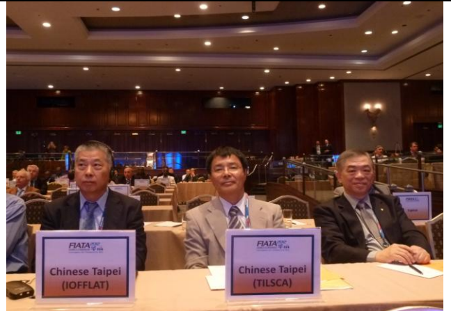
圖 16 Tilsca 與海纜公會代表參與 FIATA 大會