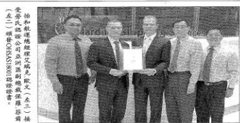
怡和航運獲勞氏OHSAS18001認證 亞太地區首家 將會強化對HSSE承諾

【本報記者王聖賢台北報導】怡和航運日前獲得英國勞氏OHSAS18001國際職業安全衛生管理系統認證，成為亞太地區首家獲得此項認證的航運公司。