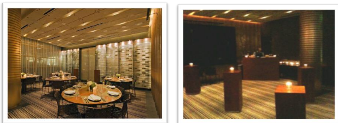
Craft 餐廳- Private Room（包廂）

Craft餐廳距離會議地點約100公尺，走路時間為2分鐘，擁有3個用餐區包括主廳（開放空間，最大容納人數為400人）、Private Room（封閉空間，最大可容納160人/雞尾酒及48人/桌椅）及戶外場所（最大容納人數為50人），在與Tilsca討論後爭取計畫建議使用Private Room，原因為Private Room為獨立空間，餐廳能提供專屬服務人員及料理，封閉空間也有助於交流，場地亦可設置影音設備，對整體活動較為聚焦活動舉辦效果，相關資料如下：