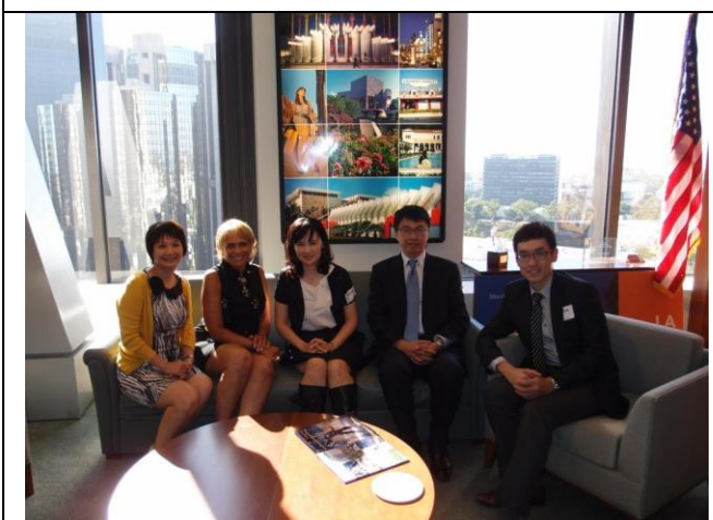
圖 20 與本局代表及駐外單位共同拜會 LA CVB