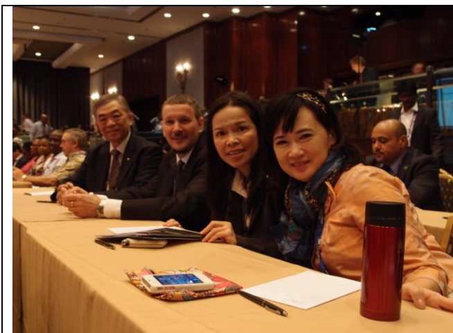
圖 19 參加 FIATA 章程會議