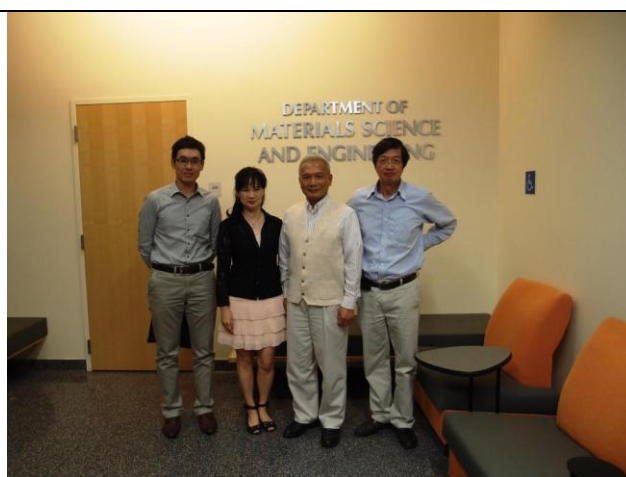
圖 23 與本局代表拜訪 UCLA 材料科學所