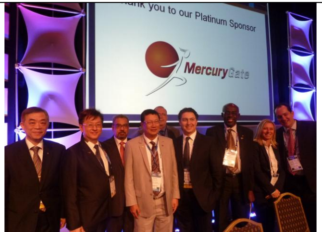
圖 17 FIATA 楊副會長與 Extended Board 之合影