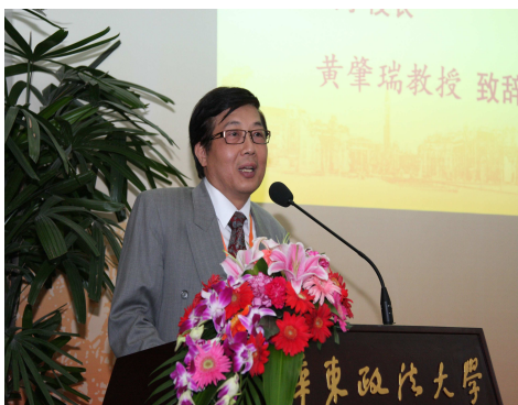
圖表一：黃校長致詞