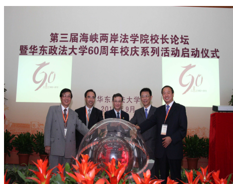
圖表二：黃校長參與論壇啟動儀式