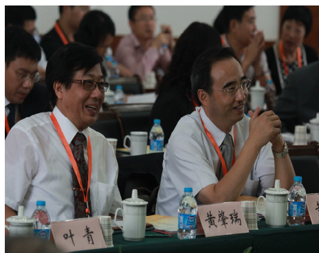
圖表四：研討活動之互動