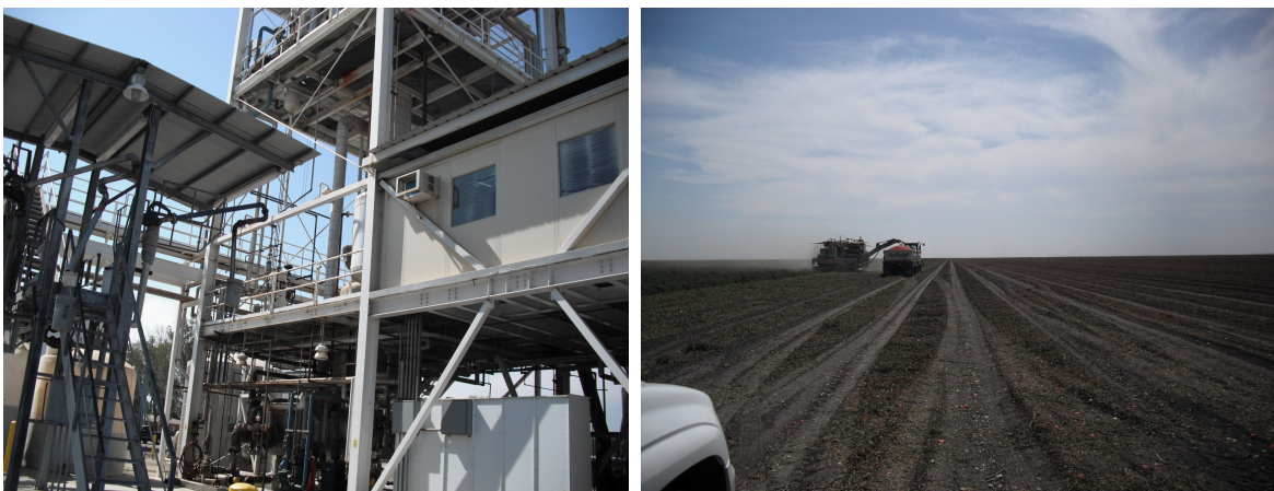
(J. G. Boswell Company 榨油廠及農田)

J. G. Boswell Company 在美國是主要供應紅花籽油的公司之一，該公司自 1980 年代即開始種植紅花籽，種植面積約 10,000 英畝(4,047 公頃)。紅花籽(Safflower)在美國的種植有一個非常顯著的特色，就是輪種(rotation)，輪種主要的目的是使土壤保持肥沃。此次參觀該公司，一方面參觀其紅花籽榨油設備，另一方面也參觀其種植農田，了解種植與生產流程。該公司也提供相關品質文件，以備參考。