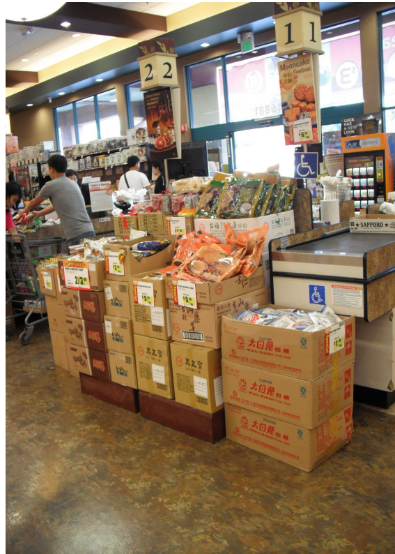
(台糖產品在大華超市作落地陳列)