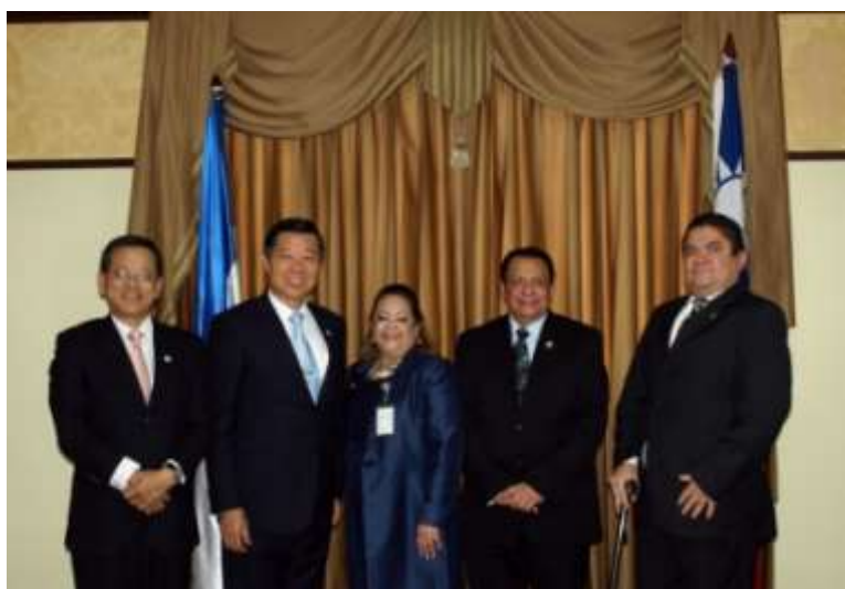
林審計長與宏國最高檢察署檢察總長魯比等人合影