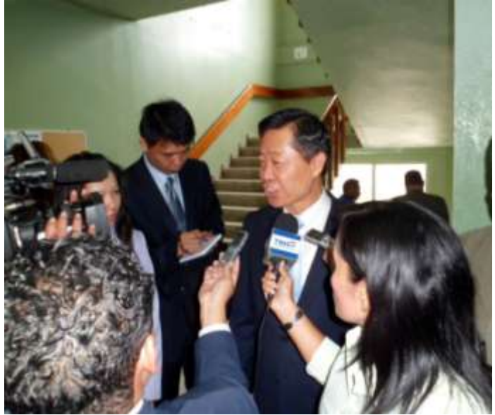
林審計長演說後接受各大媒體記者採訪

林審計長於演說後，除回答宏國多位審計人員所提問之審計相關問題外，另就我國如何防止貪污之相關問題，詳予介紹我國刻正推動廉政之作為與成果。與會人員對於馬總統大力推動之防貪「四不」原則，及監察院王院長推動之「孝順」作為，均留下深刻印象。歐瑟