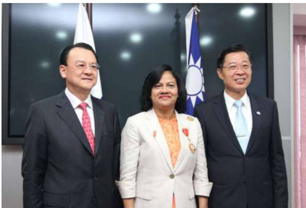
林審計長與巴國審計長陶樂絲、周麟大使合影

民國 101 年 6 月 21 日(星期四)上午，前往巴拿馬國家審計總署，拜會巴國審計長陶樂絲(Gioconda Torres de Bianchini)。陶樂絲審計長不僅領導巴國國家審計署，同時負責拉丁美洲及加勒比海地區最高審計機關組織(OLACEFS)秘書長之工作，林審計長此行特別頒贈陶樂