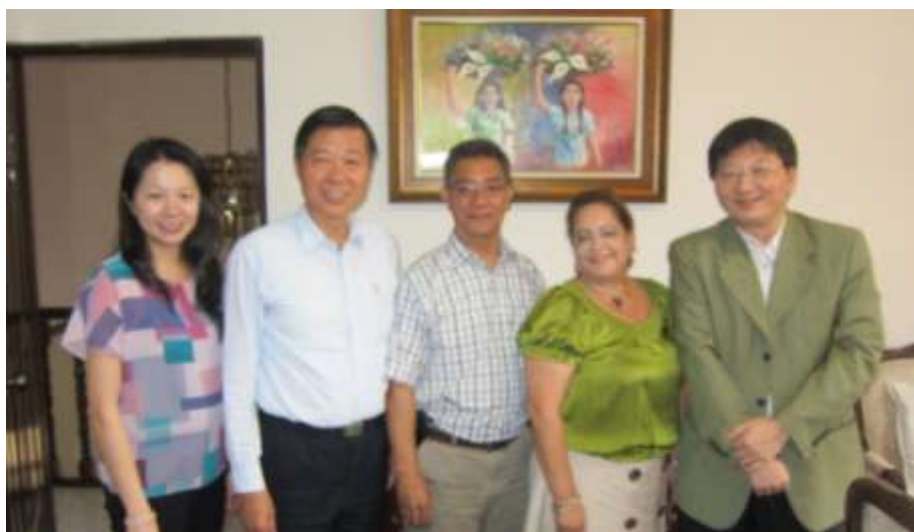
林審計長與林正惠總領事及宏國高等審計法院歐瑟古拉院長、柏格朗審計法官等人合影

民國 101 年 6 月 16 日(星期六)上午搭機抵達宏都拉斯汕埠市，在機場接受宏國高等審計法院歐瑟古拉院長與柏格朗、梅西亞兩位審計法官，及我駐宏都拉斯林正惠總領事之歡迎後，即在其陪同下，前往訪視我國駐當地總領事館。林總領事首先對林審計長遠道而來親臨指導，表達至為感謝之意。接著介紹所在地汕埠市，為宏國第二大城，由於鄰近中美洲第一大港及宏國最新穎現代化之國際機場，位居宏國北部交通樞紐，因此近年經濟發展迅速，掌握宏國 60% 以上之經濟命脈；而聞名之馬雅文化古蹟果邦(Copan)廢墟即在附近，極具觀光發展潛力，惟當地治安狀況並不甚佳，須特別小心注意。林審計長於聽取簡報後，對總領事館人員駐外工作辛勞，表達勉勵之意；對林總領事致力推動館務工作，並代表我國積極參與文化交流等各項活動，拉近與宏國當地人民之距離，亦表示嘉許，更期勉未來總領事館能在林總領事之領導下，繼續堅守外交工作崗位，為促進中、宏兩國外交關係奉獻心力。