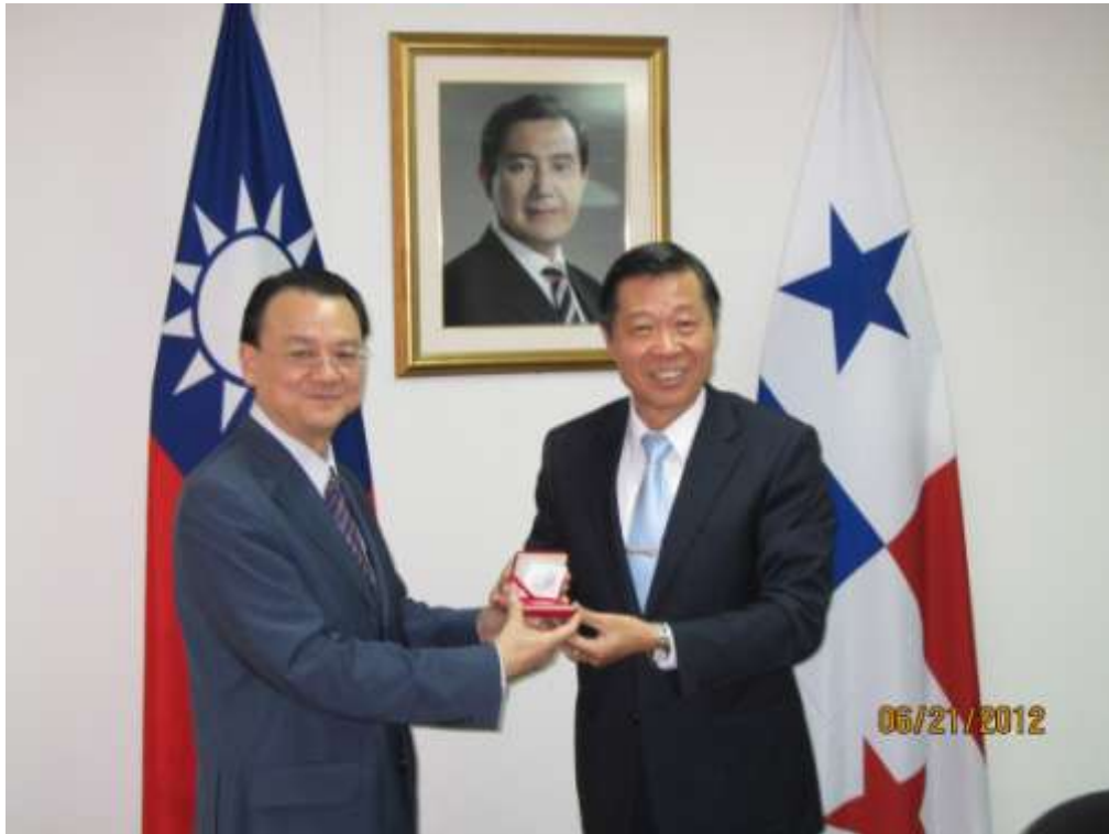
林審計長與周麟大使合影

民國 101 年 6 月 20 日(星期三)抵達巴拿馬共和國，並於當日下午訪視駐巴拿馬大使館。周麟大使首先表達歡迎之意，並感謝林審計長此行，讓駐巴大使館能有機會與該國審計及有關單位接觸，增進彼此互動與情誼，也可藉此提振使館人員的士氣。周大使並表示，審計部與中南美國家審計機關有許多國際審計專業交流活動，可作為協助拓展對中南美洲邦交國家的重要催化劑，相信林審計長此行可增進我們與巴國政府的邦誼。接著，周大使重點介紹巴國政情、巴國對兩岸之外交政策、經濟表現與其國家發展，並期盼能精進突破，使兩國關係更加穩固。