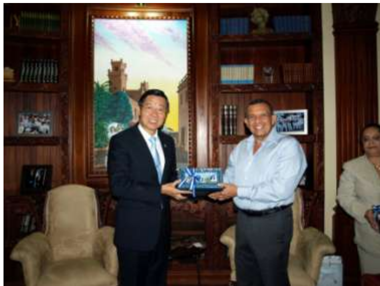
林審計長與羅博總統合影