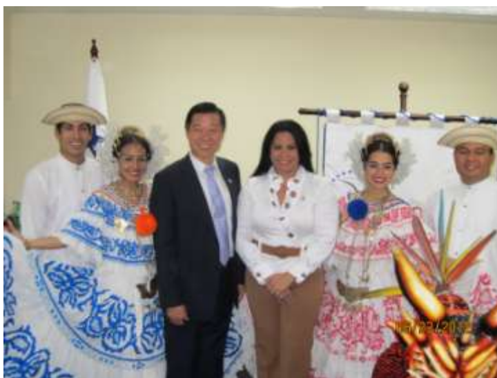
巴國護民官署以巴國傳統舞蹈歡迎林審計長來訪

民國 101 年 6 月 22 日(星期五)下午，前往巴國護民官署，受到薄圖嘉(Patria Portugal)護民官熱情接待，先以巴國傳統歌舞表達歡迎之意，再引導參觀署內各辦公室與所屬公共關係室等重要單位，並進行會談。薄圖嘉護民官介紹表示，巴拿馬護民官署係於 1997 年設置,護民官經該國總統提名,立法議會核准通過，任期 5 年，其主要任務為接受民眾陳情，推動及捍衛人權，調察監督及舉發政府機關或公務人員的違法