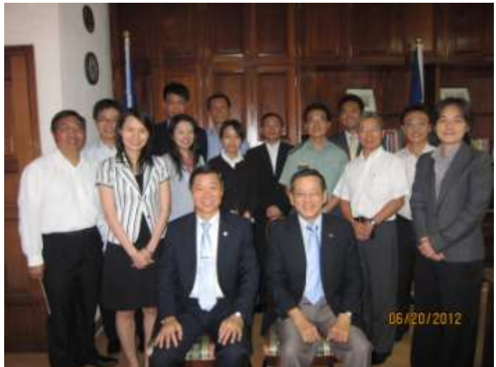
林審計長與我駐宏國大使館人員合影

組織(INTOSAI)成員國持續互通資訊，不斷改革創新。監察院王院長對審計機關有高度期許，提供很多的協助，讓審計部得以有所發揮，並順利推動審計業務；而監察院與審計部則相輔相成，三年來百分之