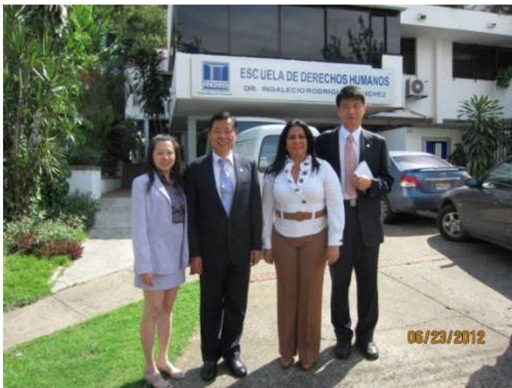
林審計長與巴國護民官薄圖嘉合影

民國 101 年 6 月 22 日(星期五)下午，前往巴國護民官署，受到薄圖嘉(Patria Portugal)護民官熱情接待，先以巴國傳統歌舞表達歡迎之意，再引導參觀署內各辦公室與所屬公共關係室等重要單位，並進行會談。薄圖嘉護民官介紹表示，巴拿馬護民官署係於 1997 年設置,護民官經該國總統提名,立法議會核准通過，任期 5 年，其主要任務為接受民眾陳情，推動及捍衛人權，調察監督及舉發政府機關或公務人員的違法