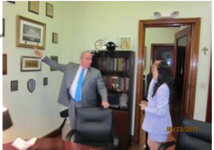
亞優總長分享其機關重要活動照片

隨後，林審計長與亞優總長就雙邊職務角色與意義交換意見。林審計長表示，審計職權隸屬於憲法五權之監察權，由審計機關獨立行使，並秉持 3E (Economy, Efficiency , Effectiveness) 原則執行審計業務。審計工作主要為確