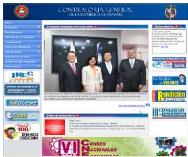
林審計長來訪訊息登載於巴國審計總署全球資訊網