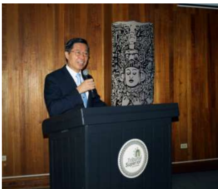
林審計長於宏國高等審計法院發表演說

林審計長演說前，先以宏國在高等審計法院門口迎接的醒獅團表演為開場，取「祥獅獻瑞」吉祥祝賀之意，祝福台宏兩國國運昌隆，邦誼永存，雙方審計機關運作能更順利，創造最大的審計價值，此語獲得在場人士熱烈掌聲。林審計長演講時，