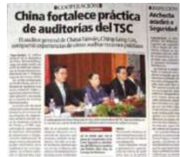
林審計長於宏國參訪期間受到各大媒體高度關注