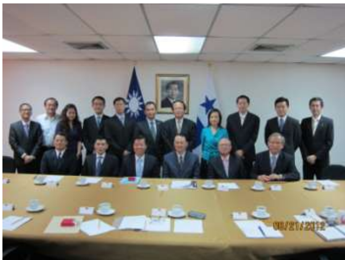
林審計長與我駐巴國大使館人員合影

表示此行係應宏都拉斯高等審計法院及巴國審計總署邀訪，順道來大使館為所有成員打氣加油。林審計長接著表示，我國與中南美國家審計機關以及國際最高審計組織長期建立良好關