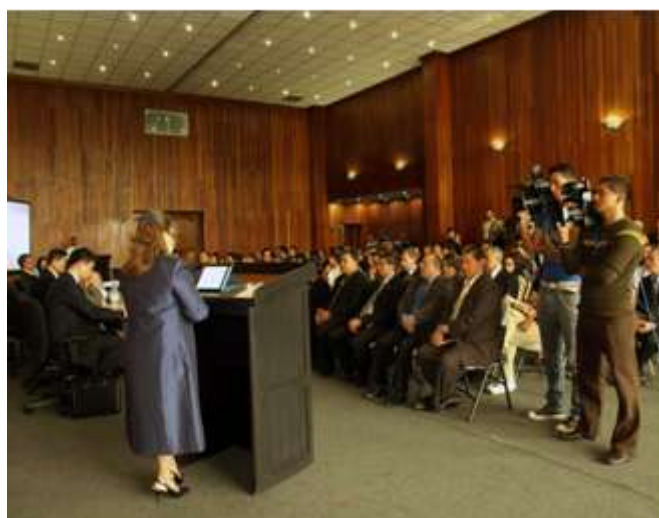
歐瑟古拉院長致歡迎詞

民國 101 年 6 月 18 日(星期一)上午拜會高等審計法院，受到熱烈歡迎，現場並有精心安排之儀隊、傳統醒獅團等表演。歐瑟古拉院長首先介紹現場所在的 Jose Trina Cabañes 議事廳，係命名自該國一位以「誠實」、「正義」、「公平」為信念，引領該國走向世界的偉人。接著，向與會人員