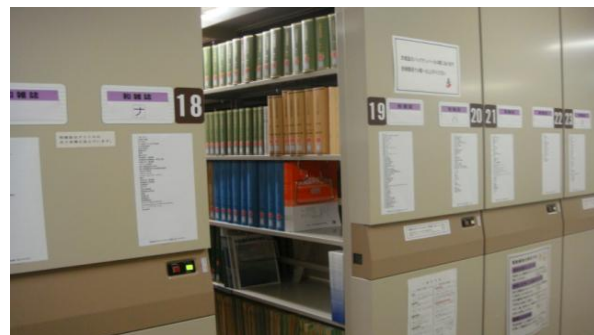
安田女子大學的圖書設施