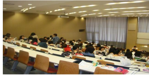
安田女子大學的大教室