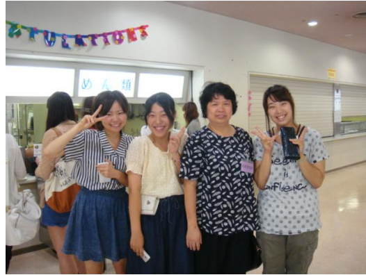
在大學餐廳偶遇此次參加華語研修的同學