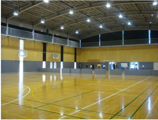
安田女子大學的體育館