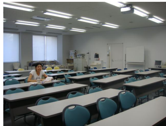
安田女子大學的教室