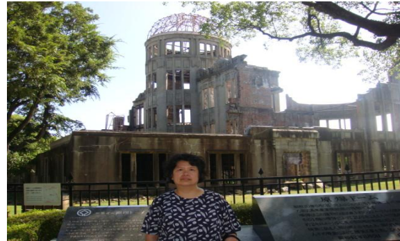
原子彈爆炸遺址： 原子彈爆炸圓形屋