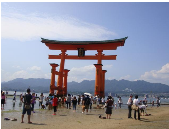
嚴島神社的大鳥居