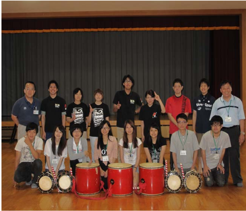
琉球大鼓社團合影