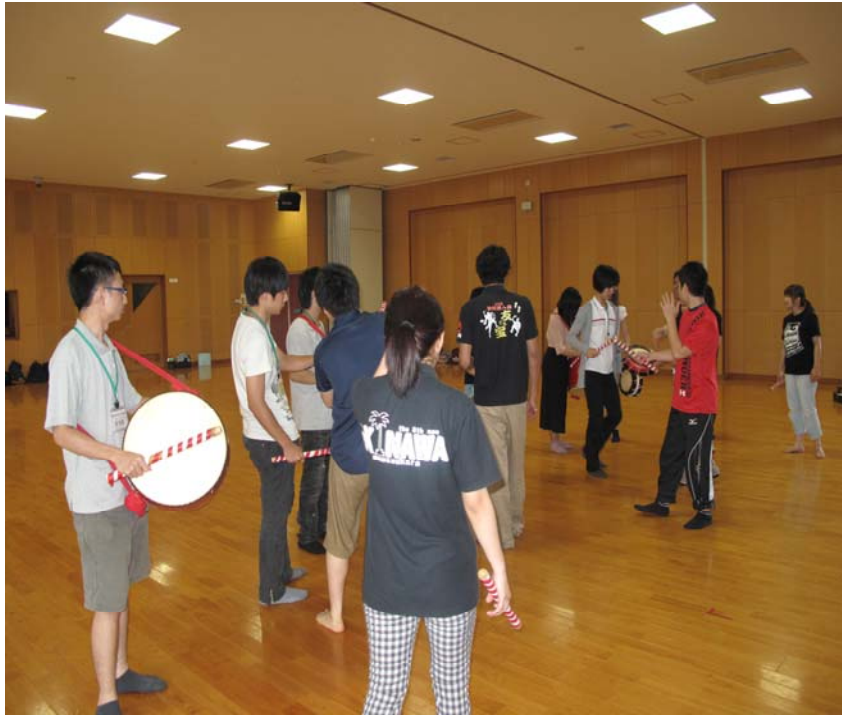
參加琉球大鼓社團演出