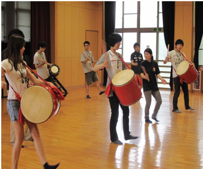
參加琉球大鼓社團演出