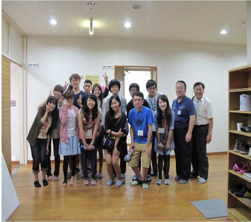
日籍社團學生合影