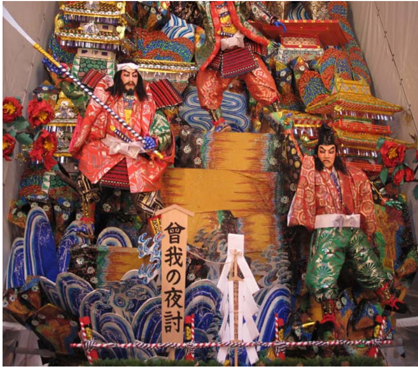
福岡街頭賽會花車