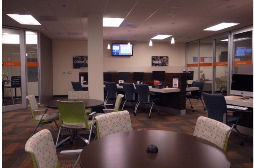
電腦區中提供學員使用的電腦或自行帶筆記型電腦的使用空間