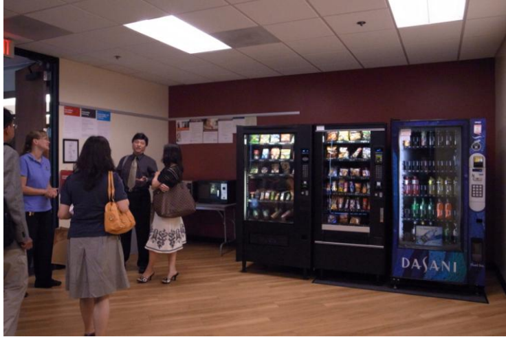
溫馨便利學生休息室

最少7人才能開班，兼顧老師負荷量、教學的品質，維持一定的師生比例。另外，在教室座位的排列方式是為便於學生進行討論的U字型為主。