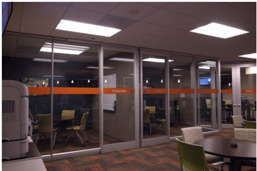
以透明玻璃隔成小間的討論室