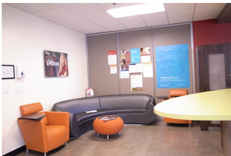
服務區的一角可以舒適休息或交談的沙發區