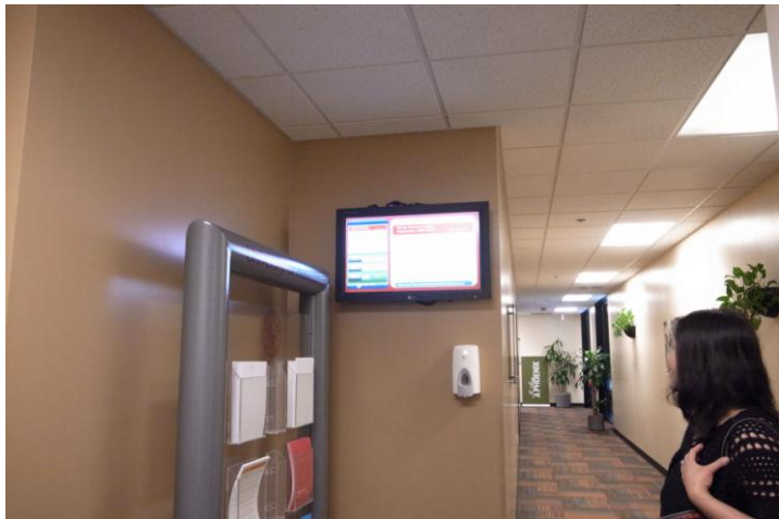
寬敞清潔的走廊及公播系統