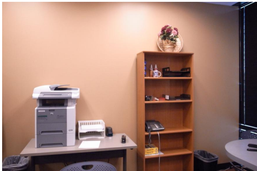
空間雖然不大，但設備很完善