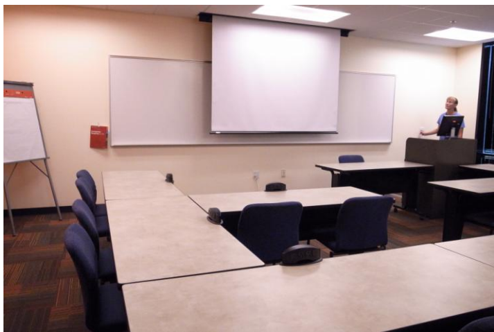
設備完善的實體教室