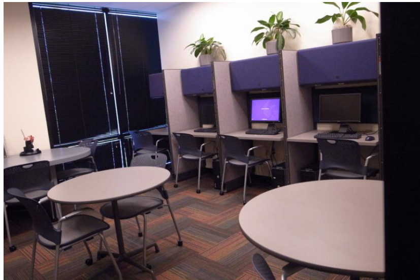
簡單舒適的講師備課環境

(四) 講座備課室(staff room)：這是爲了方便講座備課所設計的，主要的設備包含傳真機、影印機、4台獨立使用的電腦、會談桌3張、教師專屬信箱可傳遞實體郵件或資料及簡易文書工具，講座在這裡透過網路就可以找到學校所提供的數位資訊，由於鳳凰城大學將多數的學習資源如書籍、專業期刊等等都數位化了，所以空間方面就可以精簡很多。