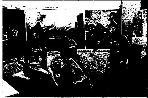
於展攤不定時演奏當地傳統音樂。