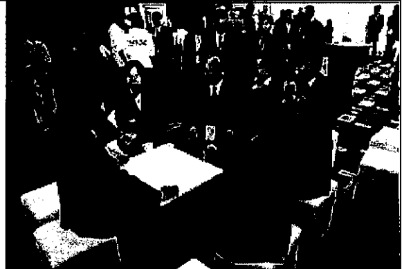
申辦團商討我國申辦因應狀況。