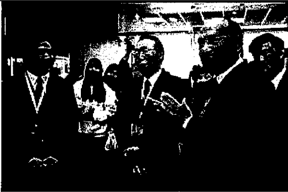
韓國籍執委於會場與表演團體一同高唱韓國歌曲。