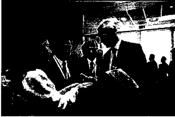
我國駐比利時留學生贈給 FISU 第一副會長(俄羅斯籍)我國申辦紀念品。