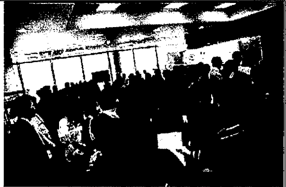
我國攤位聚集人潮實況。