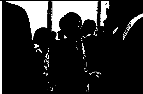
日本籍執委(亦為前次來臺場勘委員主 席)前往我國攤位表予支持。