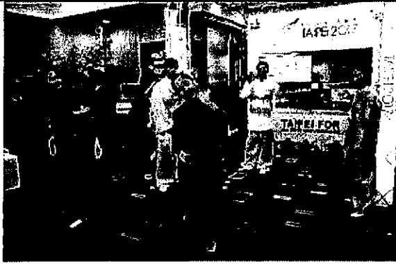
表演團體陸續進行表演活動，成功吸引 聚焦。