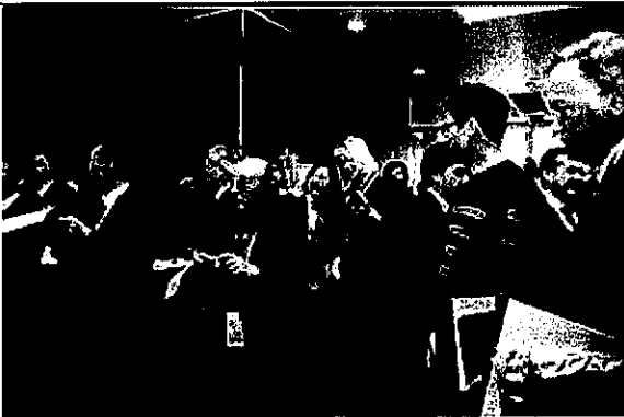
來訪觀賞我國攤位表演活動執委右至 左依序為波蘭執委(右一、亦為前次來 訪場勘委員)、愛沙尼亞執委(右四)、 FISU 榮譽顧問(右六)、韓國籍執委(右 七)。