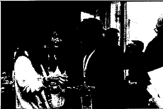
駐比利時當地學生贈給烏干達執委我 國申辦世大運紀念品。