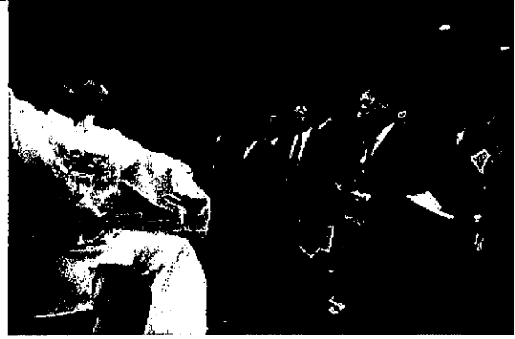
執委陸續前往攤位觀賞演出，深表讚 許，右至左依序為烏干達執委(女)、 FISU 秘書處秘書長、南非執委、FISU 副會長、新加坡洲際代表。