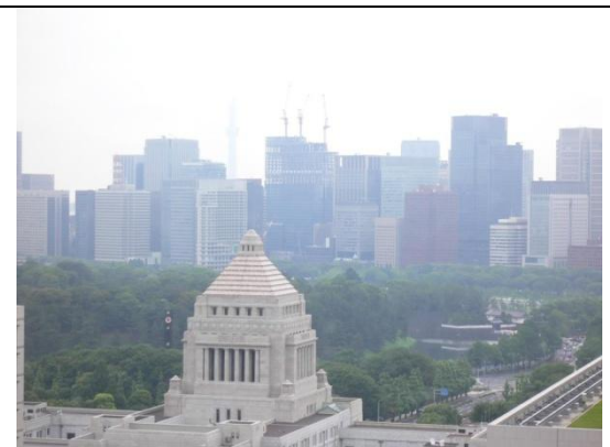
2012.7.20 攝於東京 國會山莊，遠處為東京晴空塔