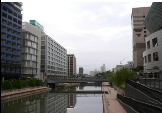
2012.7.18 攝於福岡市 Hotel Okura Fukuoda 飯店旁運河區