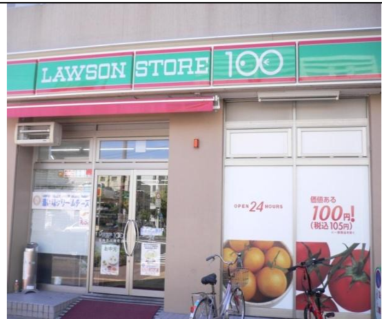
2012.7.17 攝於福岡市區 100 日圓商店