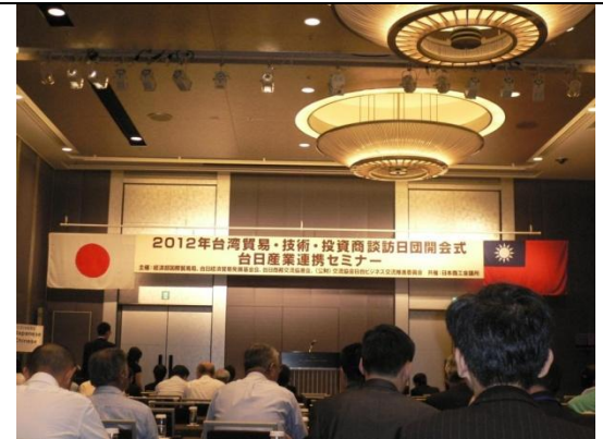
2012.7.19 攝於東京商談會 開幕式