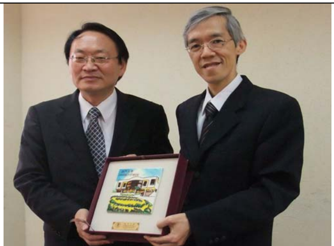
團長與澳門大學副校長交換禮品