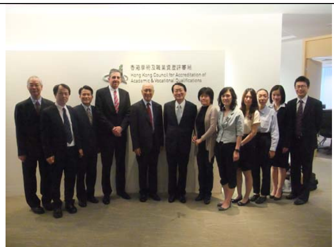
團員與學術及職業資歷評審局官員合影