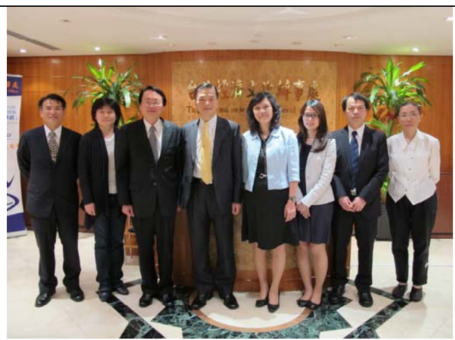
團員與港局朱局長合影