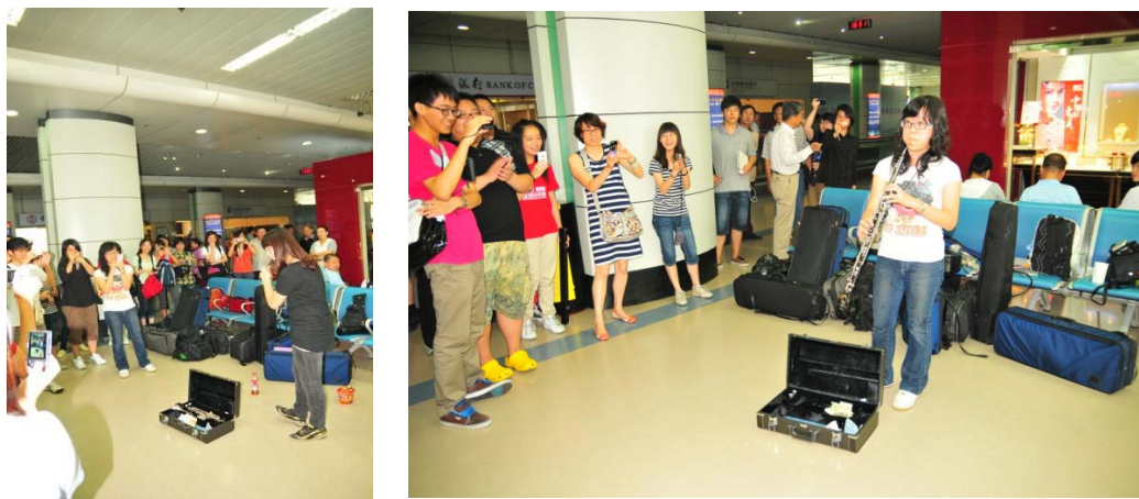
哈爾濱機場即興演出

在哈爾濱機場待機長達十多小時的時間，團員們一度拿起樂器就地進行即興演出，為班機大亂的哈爾濱機場與旅客帶來最具魅力的片刻！