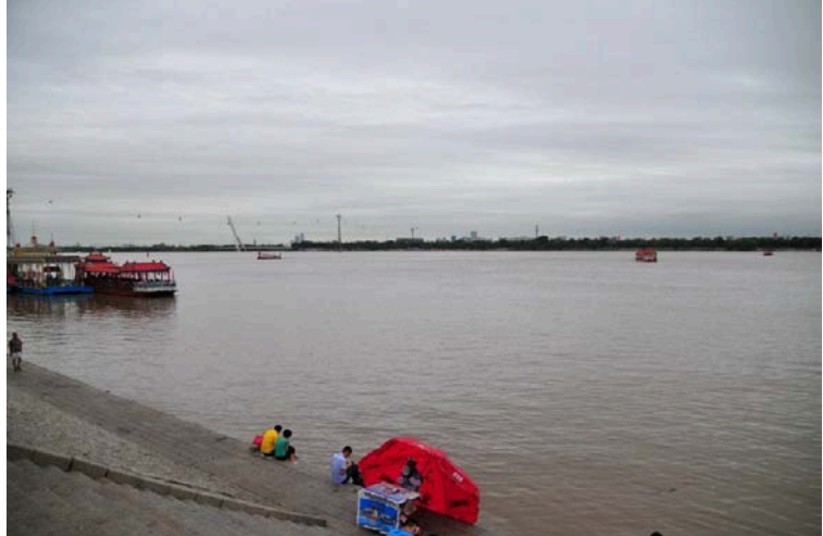
松花江畔防洪紀念塔(左) 與 松花江遊客渡船碼頭(右)