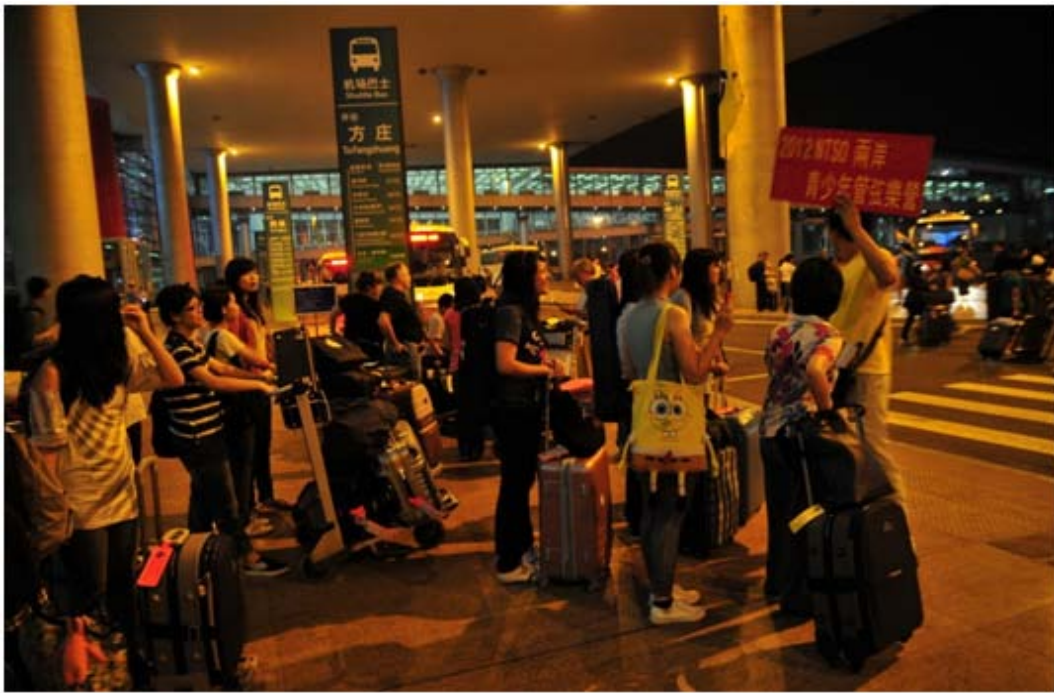
抵達哈爾濱囉！機場候車

我們抵達北京的時間已經是下午四點三十分，隨即轉乘六點十分起飛的中國國際航空班機前往哈爾濱，經過近二個小時的飛行，終於在晚間八點十分左右抵達哈爾濱，並轉搭巴士前往「鑫鵬酒家」享用晚餐；最後轉往在哈爾濱停留期間住宿的「波斯特飯店」。