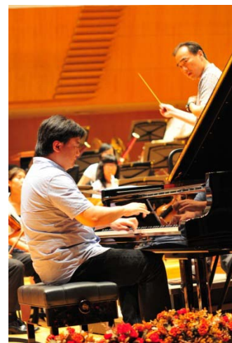
北京音樂廳彩排實況