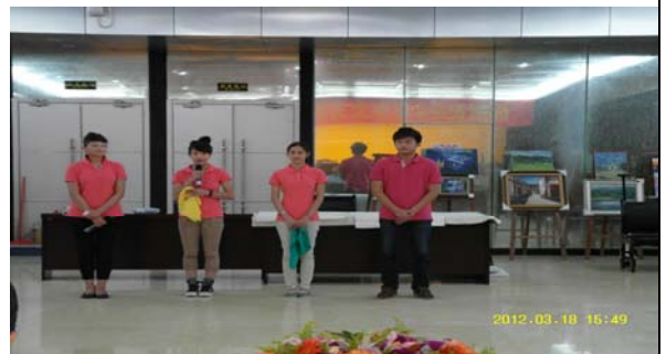
活動日程:3月18日 本校與海南師範大學校際交流活動