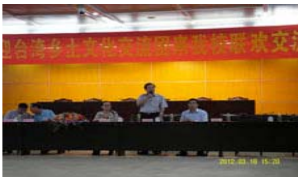
活動日程:3月18日 本校與海南師範大學示範交流活動