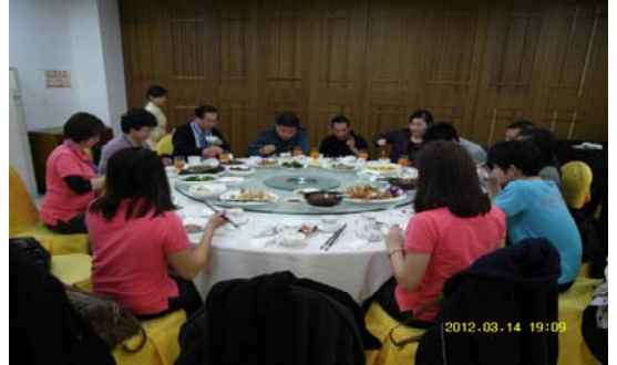
活動日程:3月14日 到達海口機場前往美蘭海航酒店用晚餐