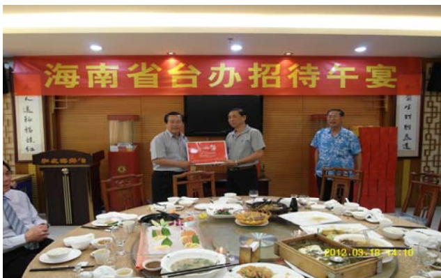
活動日程:3月18日 與省台辦交換紀念品