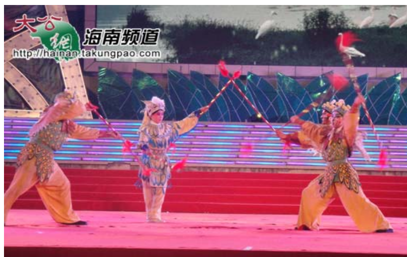
臺灣戲曲學院演員表演京劇《白鷺島》

【本報實習記者袁成志屯昌十六日電】以「兩岸中華情瓊臺一家親」為主題的瓊臺寶島民間文化藝術交流專場文藝晚會昨晚在海南屯昌上演，來自瓊臺兩地的民間文化藝術團體為現場觀眾獻上了地方特色歌舞、黎族樂器演奏、京劇、瓊劇、客家戲曲等十餘場精彩的演出。晚會以一場火紅熱烈的《火鳳凰》舞拉開序幕，其動感的音樂與激情的舞蹈點燃了現場的激情，更表現了海南人民對於臺灣親人的歡迎，贏得陣陣掌聲。隨後海南民間文化藝術團體帶來了自編自導富有草原風情的舞蹈《夏牧場的彩虹》、臨高傳統歌舞《哩哩美》、黎族特色樂器演奏及瓊劇等精心準備帶有濃濃民族、地域特色的節目，而由9歲小演員表演的瓊劇更是引得現場掌聲雷鳴，也獲得臺灣觀眾的盛贊。