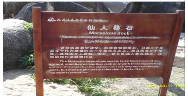
活動日程:3月17日 參觀天涯海角景點