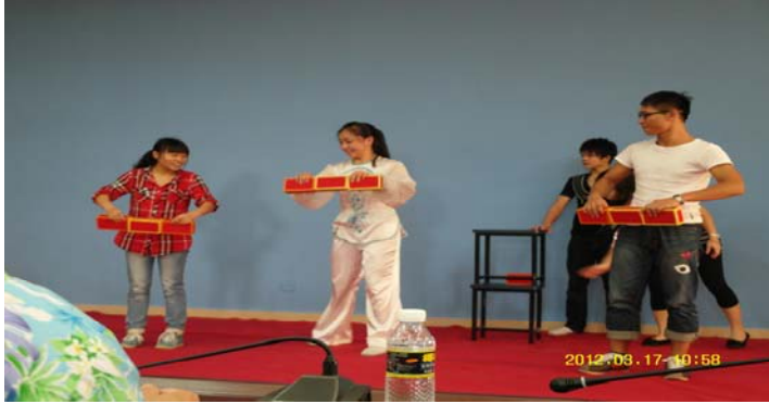
活動日程:3月17日 本校與瓊州學院校際交流演出