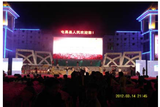
活動日程:3月14日 前往屯昌縣晚間 10 至凌晨 2 點彩排