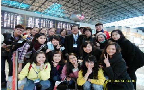
活動日程:3月14日 桃園國際機場準備起飛前往海口機場