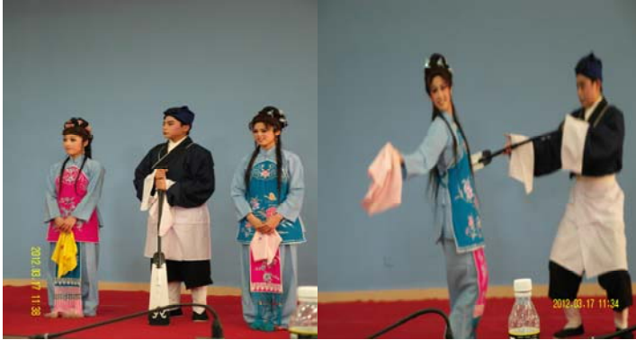
活動日程:3月17日 本校與瓊州學院 校際交流演出