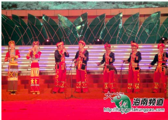
黎族樂器演奏