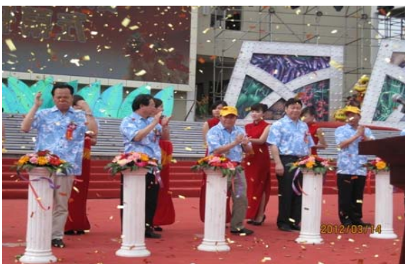
活動日程:3月15日 開幕式