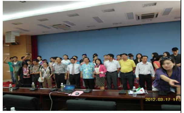
活動日程:3月17日 本校與瓊州學院校際交流活動