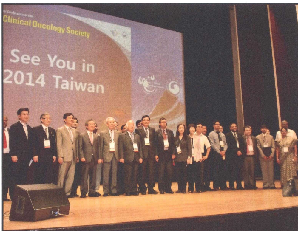
照片一:職本人與大會日籍會長及全體各國理事代表合影，背景為歡迎大家2014年到台灣的標題。