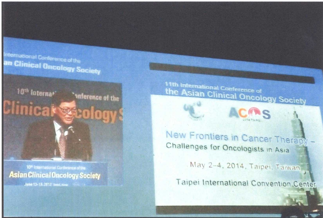
照片三:接過會旗後，由職本人簡單介紹 2014 年時，台灣舉辦第十一屆大會的主題，並放影片介紹台灣。