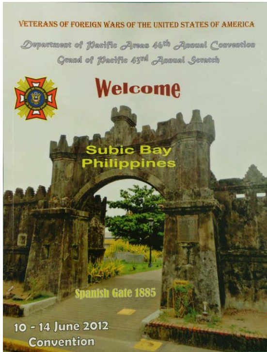
VFW 太平洋區會年會會刊封面