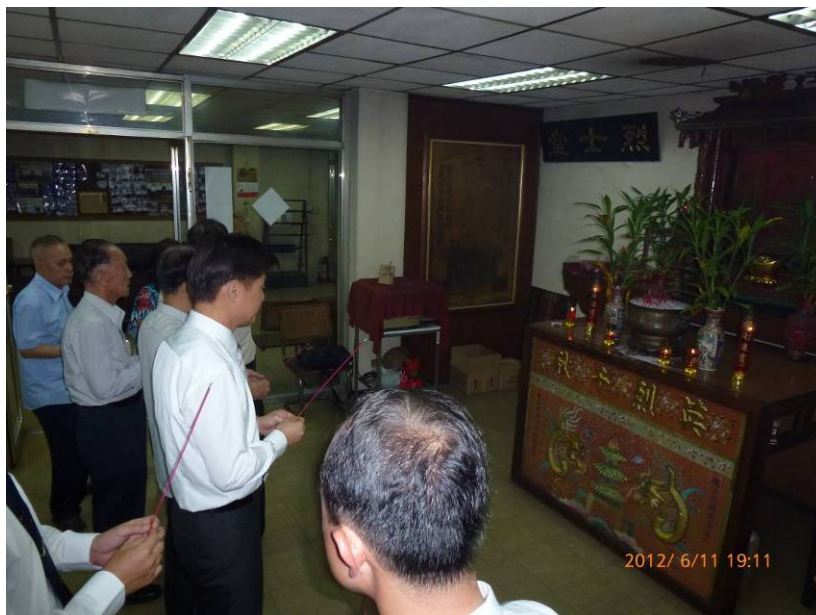
施副秘書長（右二）代表本會向菲律賓華人血幹團於第二次世界大戰犧牲之烈士上香致敬