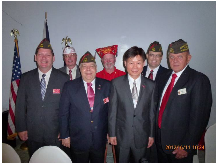
施副秘書長（右三）與美國海外作戰退協太平洋區會主要幹部合影