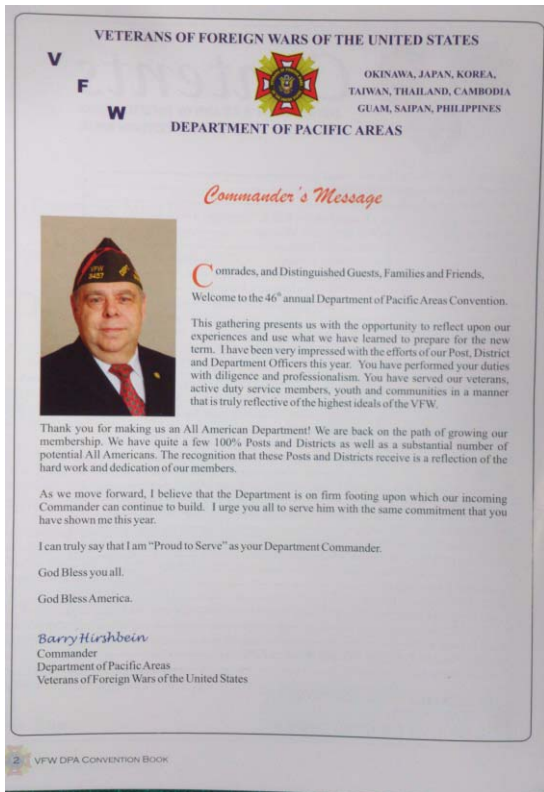
VFW 太平洋區會賀須班區會會長致大會函