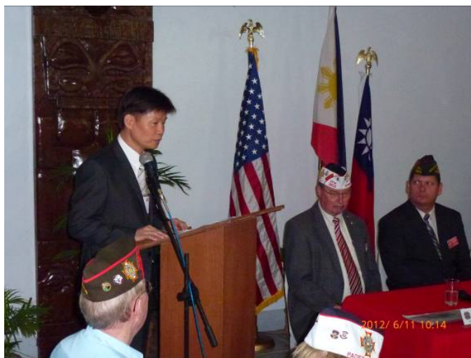
施副秘書長（立者）在該退協太平洋區會大會開幕式發表