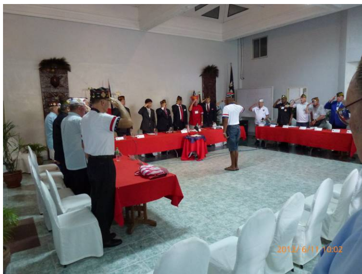
施副秘書長（中立者）參加美國海外作戰退協太平洋區會