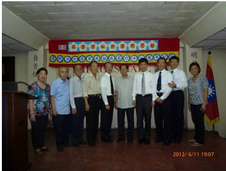
施副秘書長（右四）與菲律賓華人血幹團代表合影