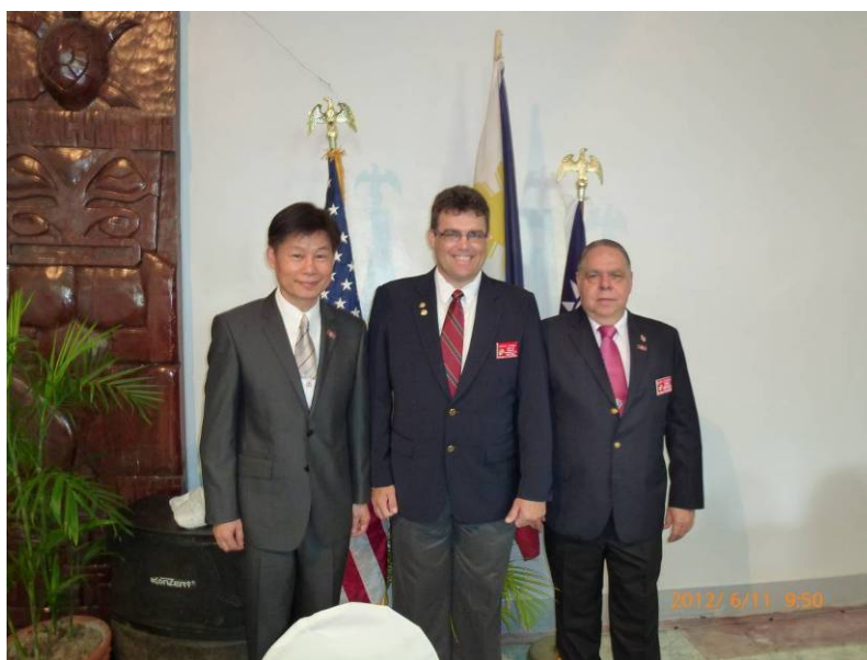
施副秘書長與新任孔姆斯區會長及現任賀須班區會長合影（由左至右）