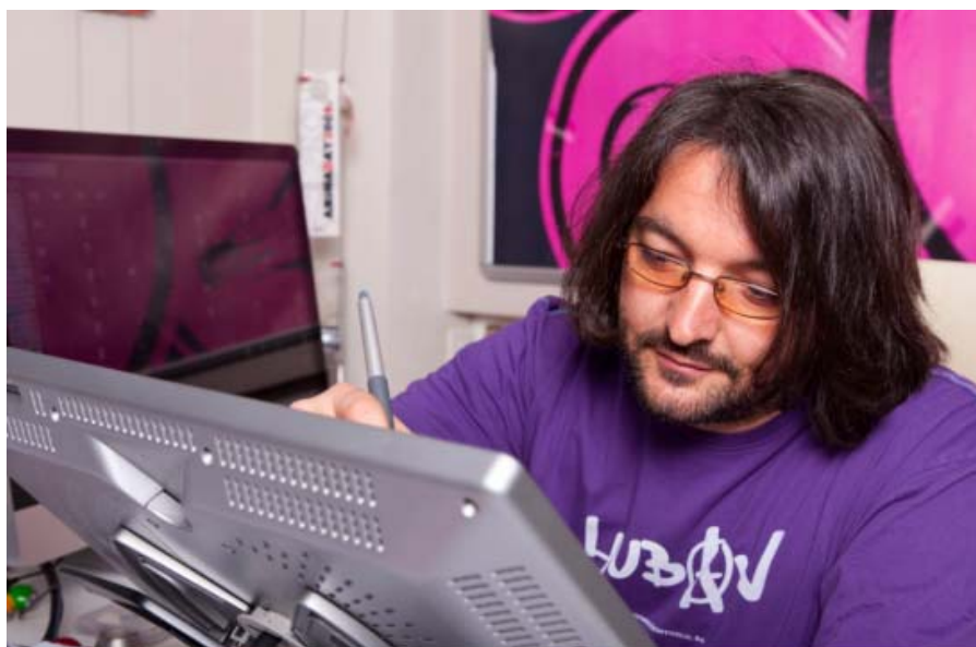
圖五、Golden Kuker Festival 的工作坊