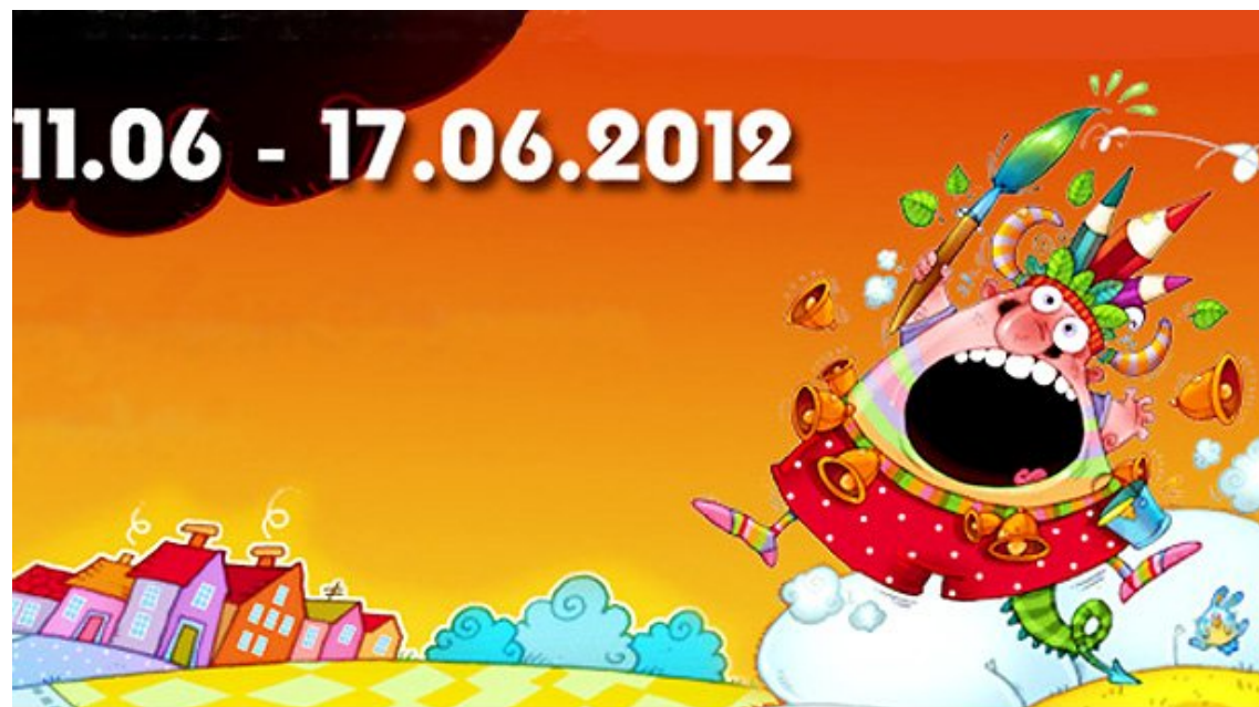
圖三 今年的主題海報之一

2012 年保加利亞 Golden Kucer 國際動畫影展的主題為 Ecology and preservation of the environment，所有競賽共分為以下項目： Competition programme