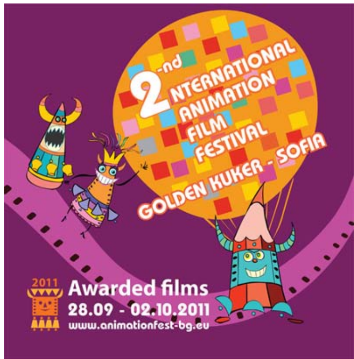
圖一 2010 第一屆、圖二 2011 第二屆的影展海報